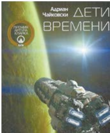
Адриан ЧАЙКОВСКИ «ДЕТИ ВРЕМЕНИ»

Что случится с планетой, если ее захватят пауки, наделенные разумом? Свой сценарий развития событий представил Адриан Чайковский.