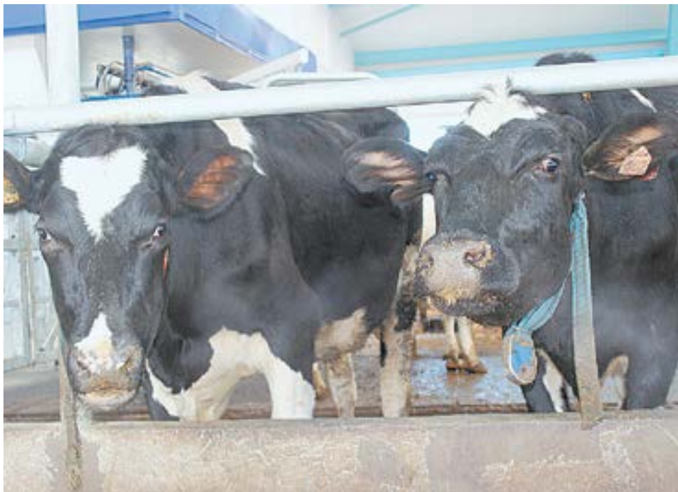
У этих коров не обнаружили вируса лейкоза.

Мы обратились за разъяснениями к специалистам.