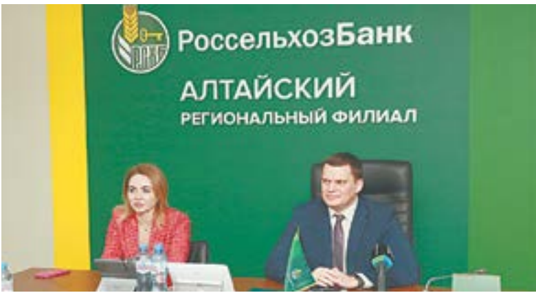
Подведение итогов «года уверенного роста».