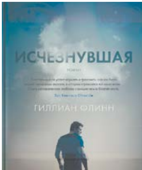
Гиллиан ФЛИНН «ИСЧЕЗНУВШАЯ»

Захватывающие миры и немыслимые герои-инопланетяне, созданные автором, с лихвой оценены критикой. Роман сравнивают с «Городом» Клиффорда Саймака и «Академией» Айзека Азимова. Книга удостоена Премии Артура Кларка. Вот в чем суть истории, описанной Адрианом Чайковским. Ученый Аврана Керн поставила эксперимент по наделянию животных разумом. Специально для этого на спутнике Земли подготовили все условия, чтобы было все как у людей. И вода, и земля, и воздух. Объект эксперимента – обезьяны, через год они должны были общаться с учеными на равных и в конечном итоге стать для людей обслуживающим персоналом. Но на Земле случилась война, обезьяны на экспериментальной площадке не выжили. Вместо них поумнели тараканы. Люди, которым удалось спастись, кочуют две тысячи лет по космосу. Их надежда – планета, созданная Керн. Смогут ли две цивилизации ужиться вместе? Кто кому уступит? И кто кому станет подчиняться? Кто умнее и предприимчивее? Главная загадка романа в этом.