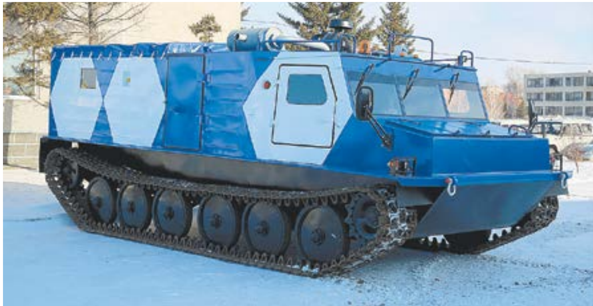
Новый снегоболотоход скоро будет передан заказчику.

К сборке 130-го вездехода для нефтяников и газовиков Крайнего Севера приступили на рубцовском заводе «Алтайтрансмаш-сервис». А на днях он впервые выпустил болотоход без использования импортных комплектующих.