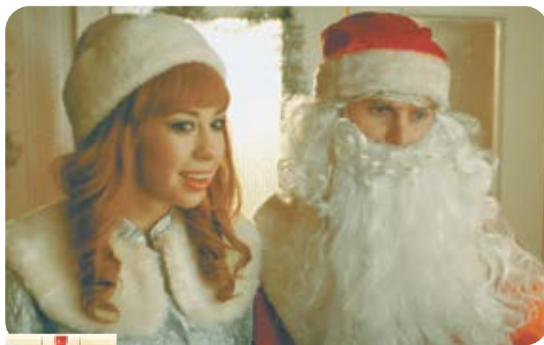
10.45 Х.ф. «Самый Новый год!» (16+)

23.55 Новогоднее обращение Президента Российской Федерации В. В. Путина 00.00 «Новогодняя Маска + Аватар» (12+) 02.00 «Новогодний Квартирник НТВ у Маргулиса» (16+)