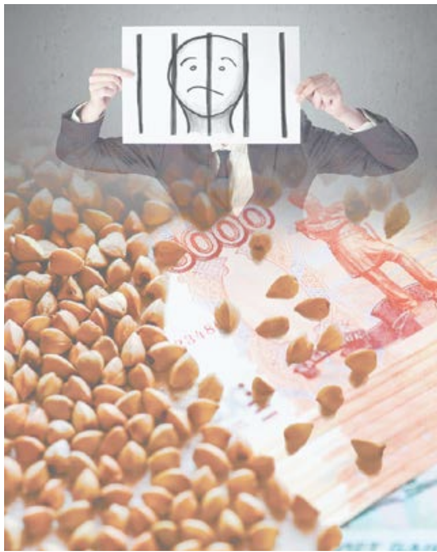
Коллаж О. ТАРАСОВОЙ.

Когда нашли тех, кто напал на предпринимателей при совершении сделки, оказалось, что это были друзья Семёна К. Мужчина уговорил их