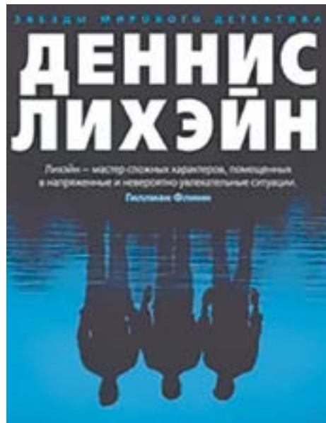
Деннис ЛИХЭЙН «ТАИНСТВЕННАЯ РЕКА»

Авторская оценка происходящего – вот что отличает книгу от фильма. Произведение буквально разобрано на цитаты. Писательница довольно иронично относится к самому институту брака: «Брак – трудная работа, требующая уступок, чем дальше, тем тяжелее. И тем больше компромиссов нужно находить», «Оставь надежду, всяк сюда входящий».