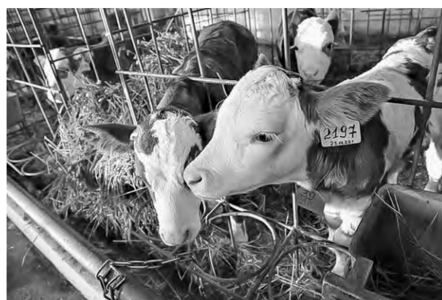
Молодняк упитан и ухожен.

если мы сами разберемся и сделаем что-то подобное, будет совсем хорошо, — отметил он.