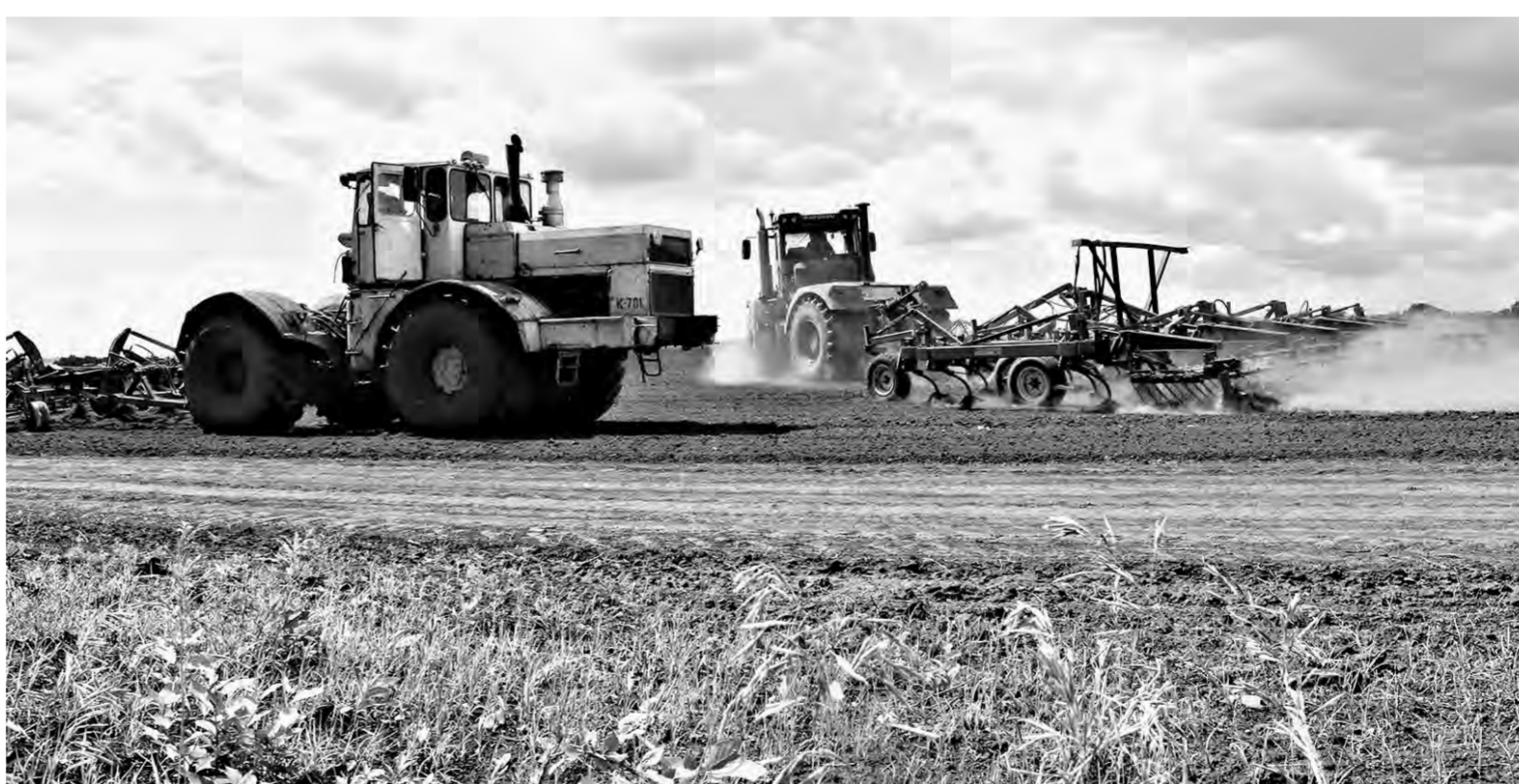
Дорога нынче плодородная земля в Алтайском крае.

«Что же это за АО «Бийское», если за его кусочек отвалили такие