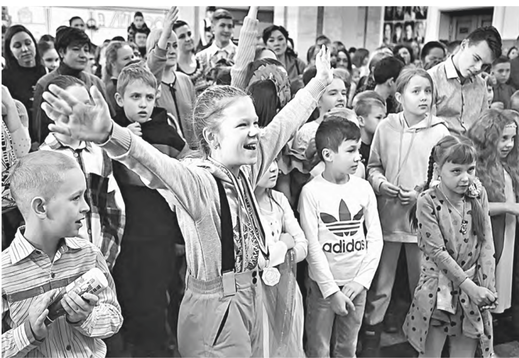
Дети от души радовались празднику.

– Сегодня у нас в зале ребята, чьи отцы выполняют служебно-боевые задачи в рамках СВО на Украине. Мы рады, что таким образом можем поддержать наших военнослужащих.