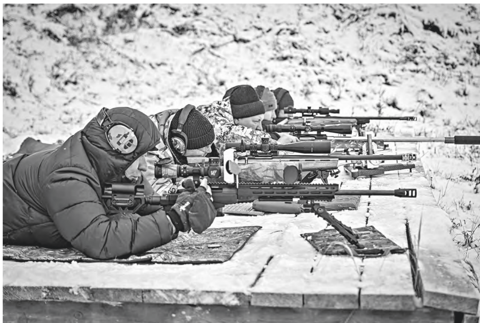
Стрельба из карабина – визитная карточка этого вида спорта.

До России (первоначально Магнитогорска и Челябинска) этот неолимпийский вид стрельбы добрался в 2000-х, а уже через несколько лет распространился во многих регионах, в том числе в Алтайском крае. Как раз тогда Барнаульский станкостроительный завод находился в поисках новых векторов развития, поэтому опыт соседей из Тюмени, Новосибирска оказался привлекательным. Так, 24 ноября 2003 года, практически в день рождения БСЗ, на базе полигона завода в Калман-