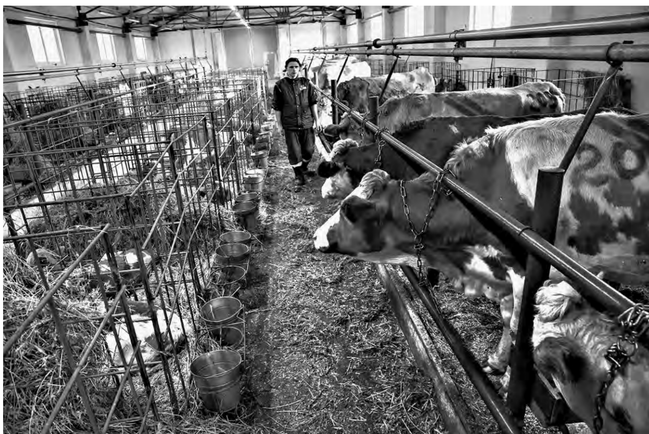
Этот животноводческий комплекс специализируется на племенном животноводстве.

— Самое главное для нас — сохранить качество молока, здоровье животных и комфортные условия для доярок. Белорусское оборудование, которое у нас установлено, все эти три компонента обеспечивает. Ну а