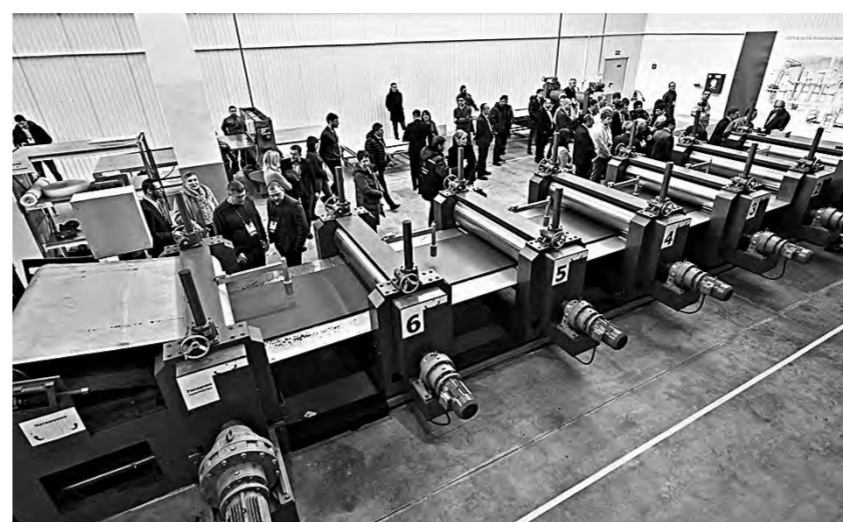
В зале нового цеха.

— Это пусть не самый масштабный, но очень хороший пример того, как нужно взаимодействовать бизнесу и власти, чтобы достигнуть ощутимых результатов на каждом