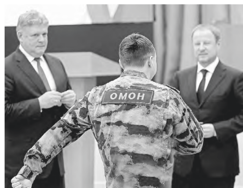
Награды вручили представителям силовых структур.