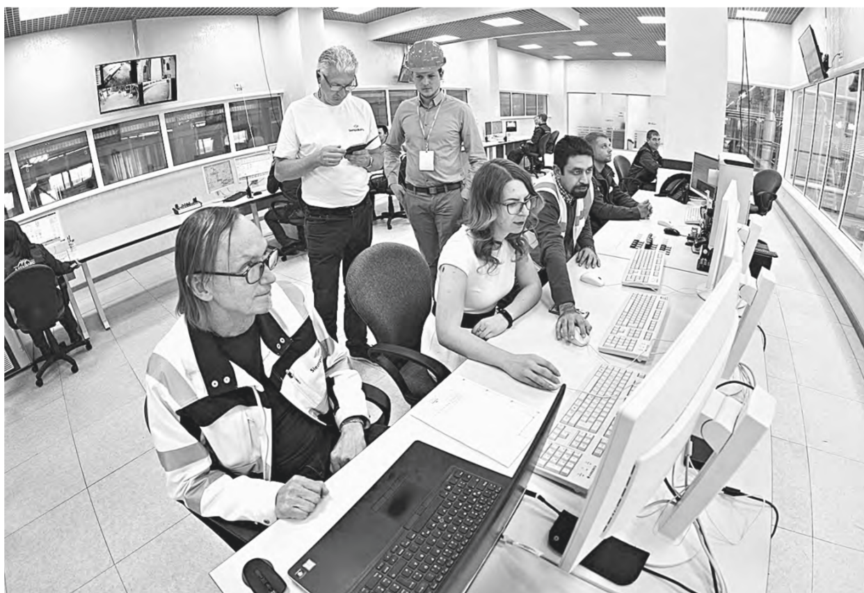
Методическую помощь оказывают местные специалисты.