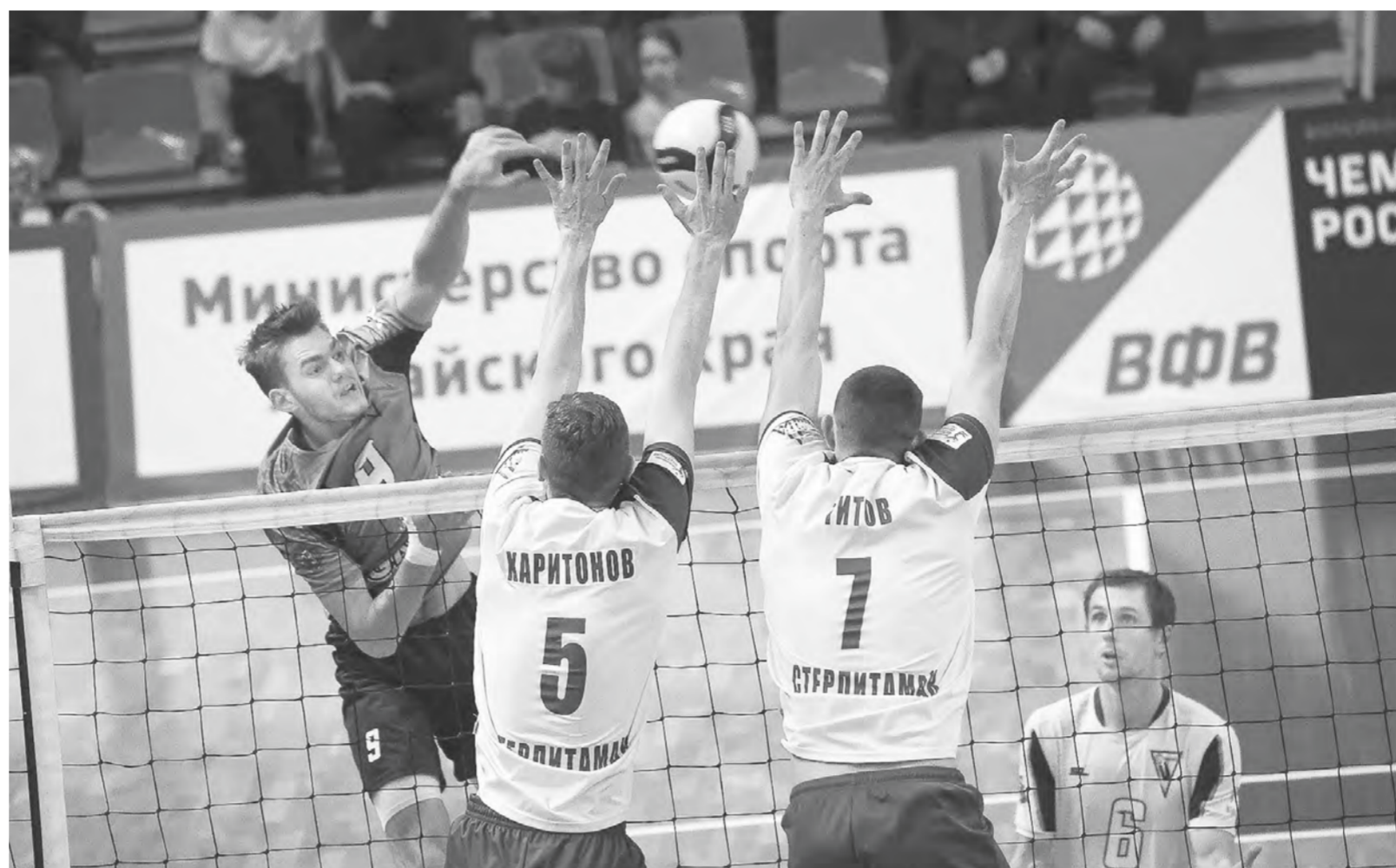
«Университет» пробивает блок, а вместе с ним и дорогу в топ-4 чемпионата.

В итоге к девятому туру чемпионата «Университет» сенсационно приблизился к первой четверке на расстоянии одной победы (если бы не два поражения в Магнитогорске, то мог быть и в числе «верхов»). Это важно потому, что именно команды из топ-4 «регуляры» впоследствии пробиваются