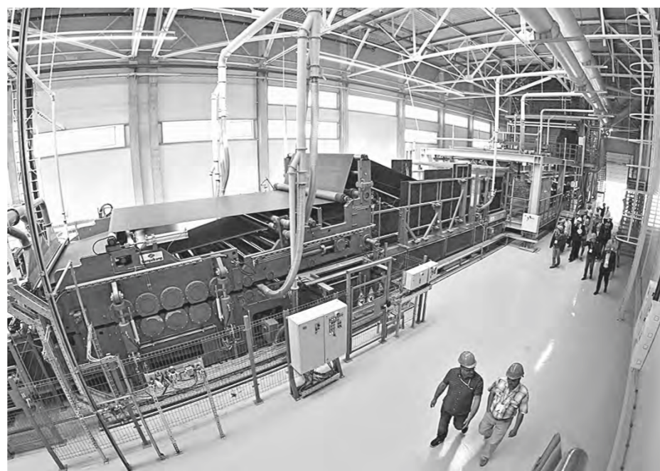
В проекте участвуют 77 алтайских предприятий.

В прошлом году в крае создали «Фабрику офисных процессов» — проект, направленный на повышение производительности офисных служащих и научных сотрудников. На площадке людей учат не тратить время на решение непривычных и нестандартных задач. Например, в течение одного рабочего дня группа сотрудников согласовывает коммерческие дого-