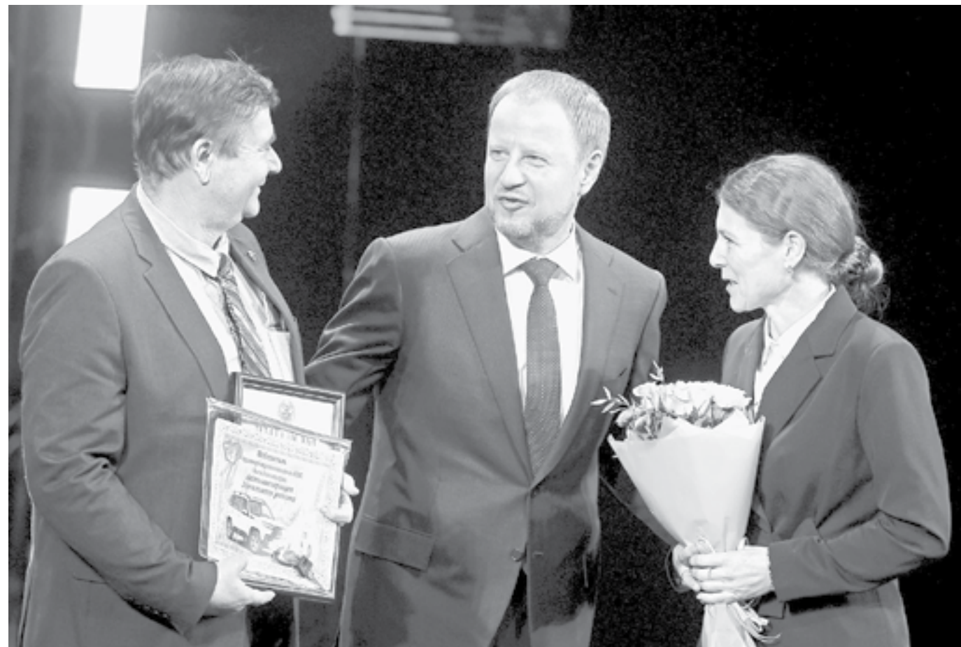
Губернатор Алтайского края вручил награды победителям трудового соревнования.