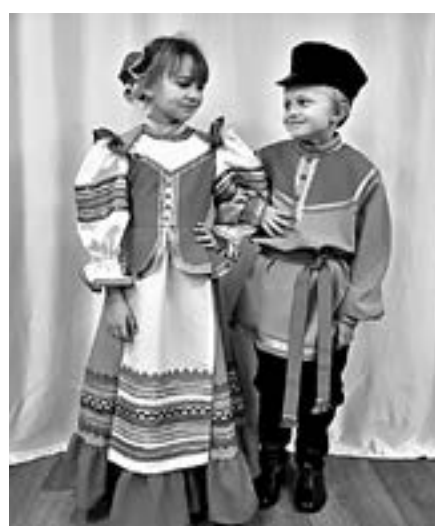
Сценические костюмы для краснощековских артистов.