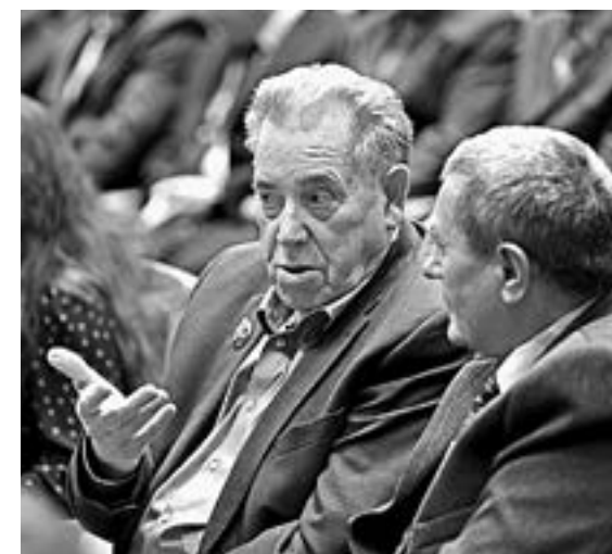
В зале – известные руководители и лучшие работники сельхозпредприятий.