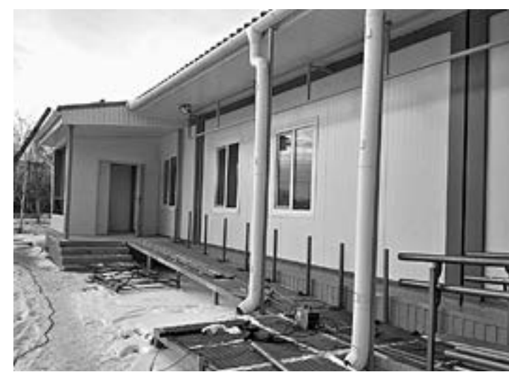
Врачебная амбулатория в поселке Мирном.