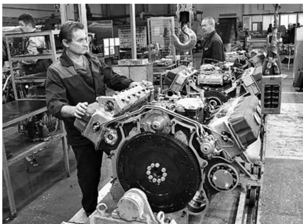
Оборонка набирает обороты.

– Потребности в чем? – Во многом. Например, были закуплены и отправлены