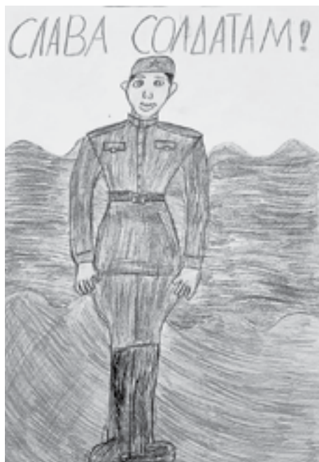
С начала проведения акции советы женщин Алтай собрали 200 тонн гуманитарного груза.

На нее откликнулись краевые и муниципальные органы