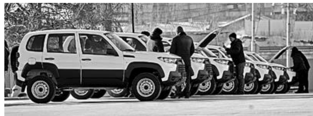
Автомобили четырех районов – победителям трудового соревнования.