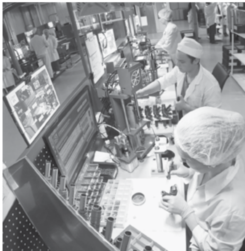
И большое дело по плечу.