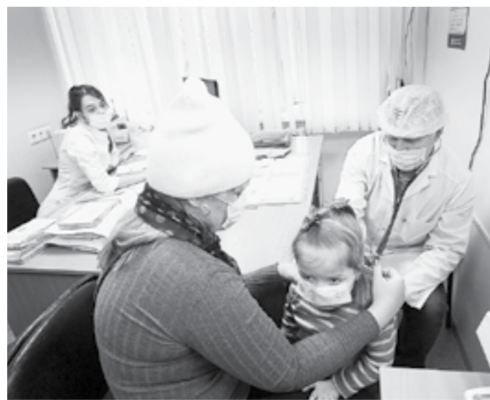
Среди заболевших все чаще дети.

— Полностью закрытых школ или детских садов нет. Но частично приостановлен учебный процесс в 24 классах школ Барнаула, Алтайского, Волчихин-