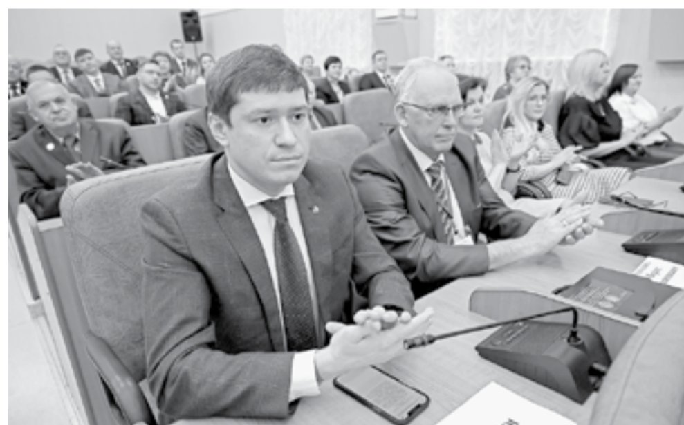
Чествование победителей прошло в Большом зале краевого правительства.