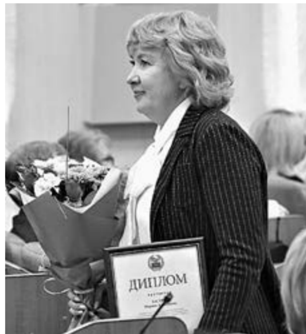
Награды получили 24 специалиста и более 70 социально ответственных предприятий.

Кроме лучших по профессии награду получили