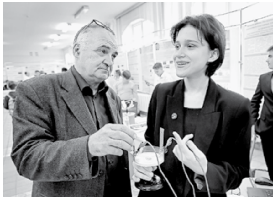
На выставке школьники показывали свои разработки.