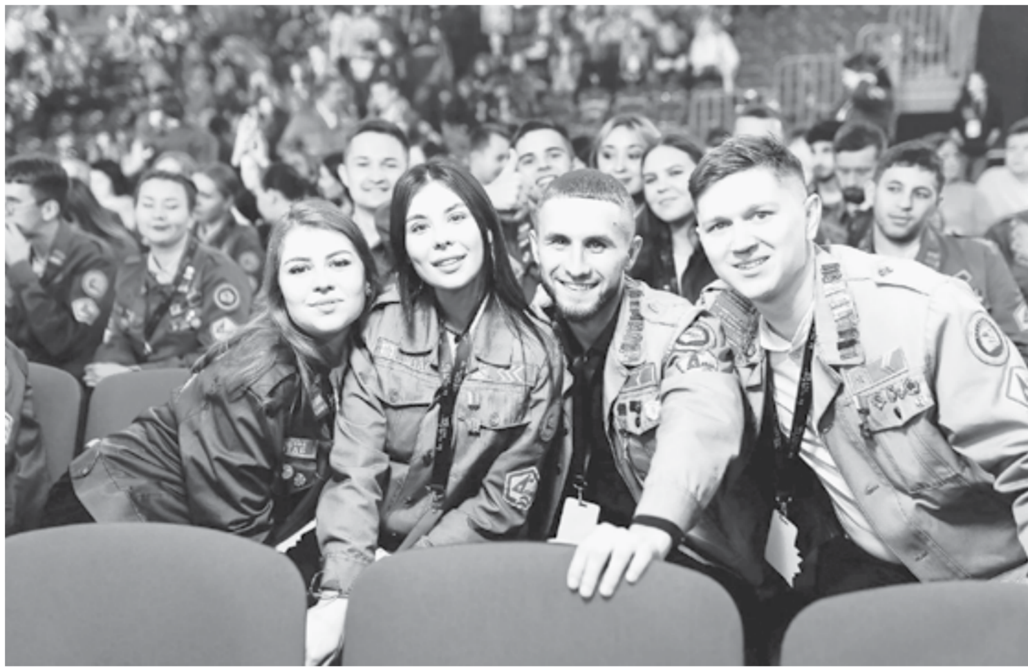
Команда Алтайского края заняла 9 призовых мест.