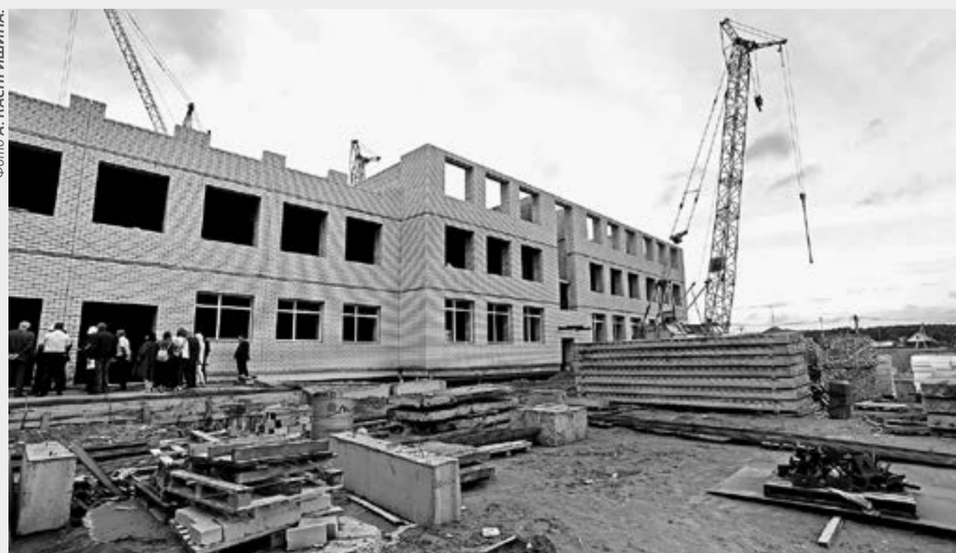
Увеличение стоимости контрактов позволит продолжить строительство социальных объектов.

В связи с ростом цен на строительные материалы за прошлый год были пересмотрены условия 12 краевых контрактов и 21 – в этом году. В целом по краю строительные подряды подорожали на 22%, или на 1,9 млрд руб.