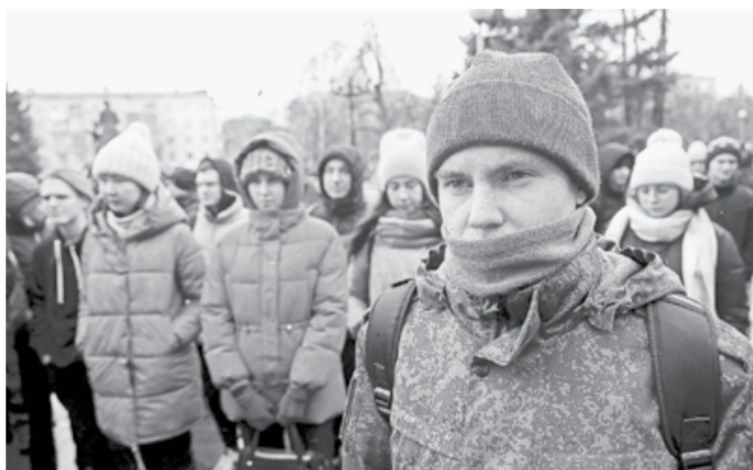
Студенты сегодня активно организуют и участвуют в патриотических акциях.

Отметим, в Барнауле в плановом режиме работают пункты приема гуманитарной помощи для мобилизованных