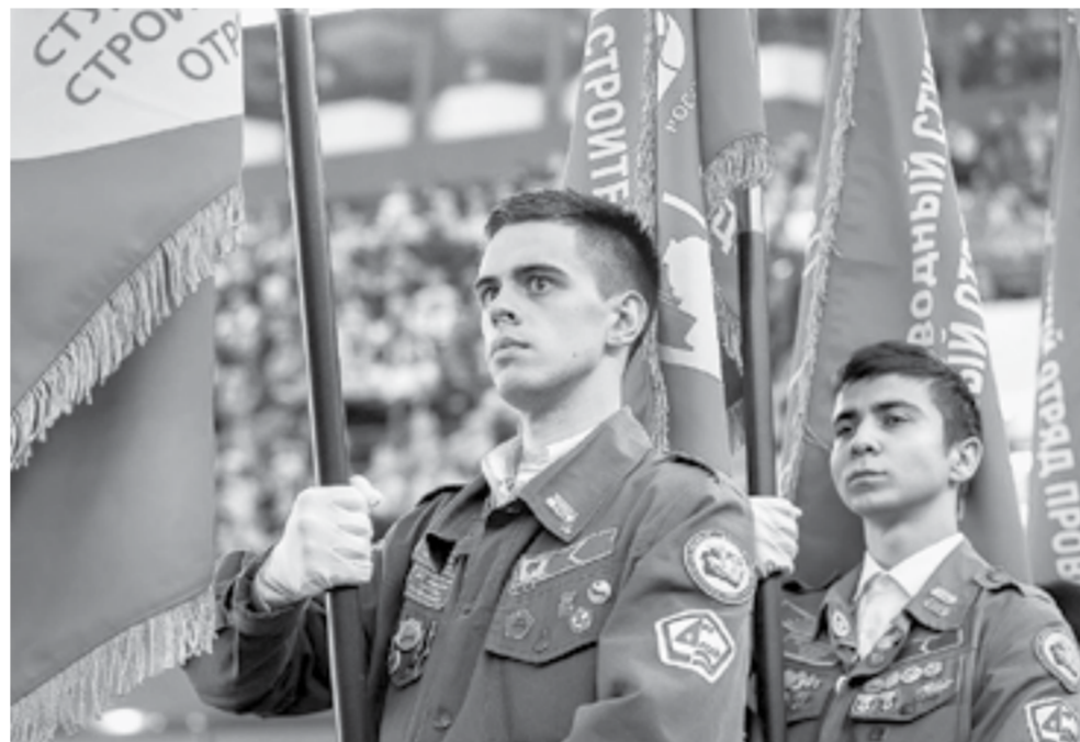
Знамена ССО – на вынос.