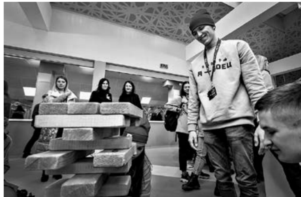
Во время фестиваля для студентов организовали игры и конкурсы.