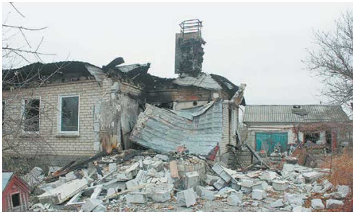
Так выглядит Славяносербск после обстрелов ВСУ.

– До 2014 года в районе проживало порядка 40 тысяч человек, но, когда Украина начала войну против граждан своей страны, многие уехали в Россию, население сократилось до 30 тысяч. Люди возвращались ради референдума, чтобы отдать свои голоса за воссоединение с РФ. ЛНР до знаковой для всех нас даты, 24 февраля, занимала меньше половины территории бывшей Луганской области, теперь она вся освобождена и является одним из присоединенных регионов. Было немного голосов и против, но жители в подавляющем большинстве настроены пророссийски. Более 30 тысяч проголосовавших