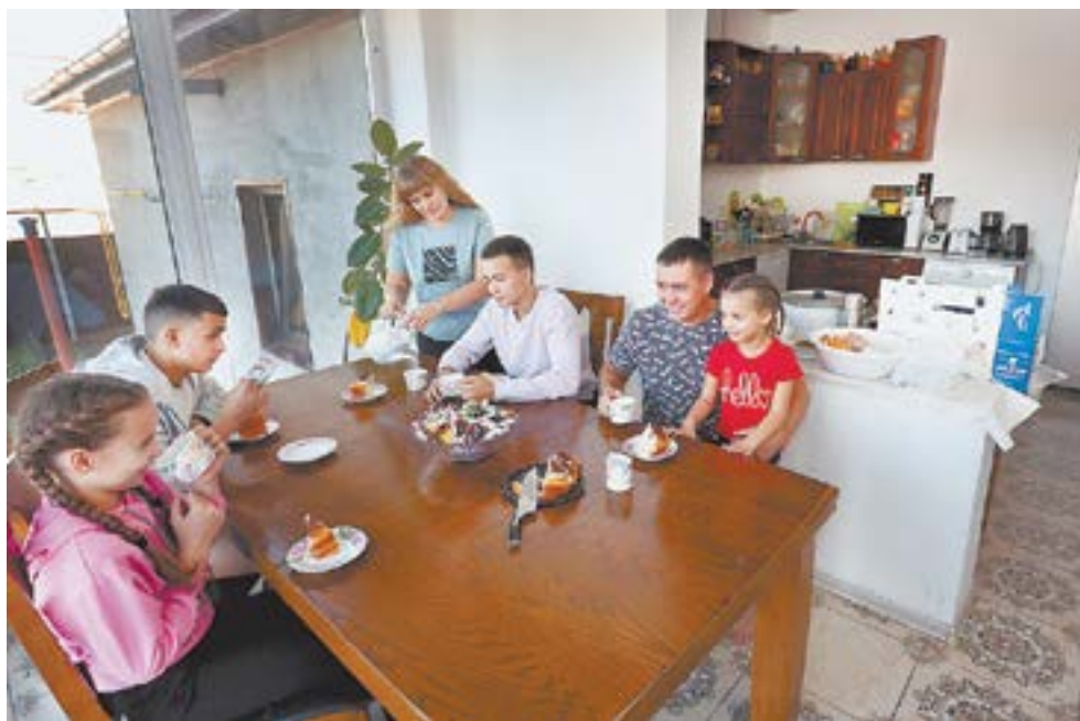
Все вместе за чаем.