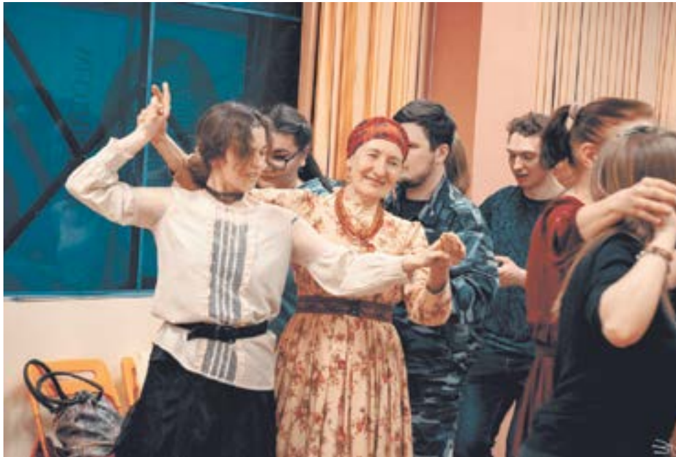
Русские хороводные танцы.