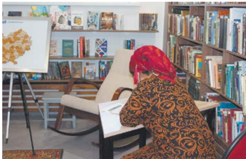
Писать по-русски – дело трудное.