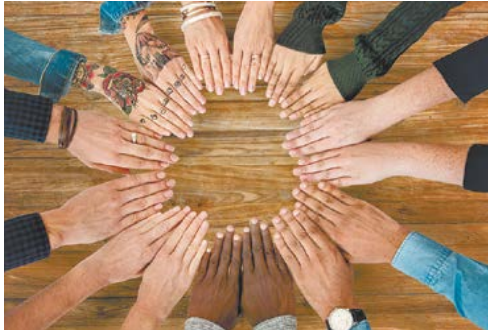
Творчество объединяет людей.