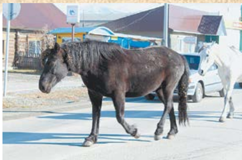
По райцентру гуляют кони.

Это сердце Усть-Коксинского района Республики Алтай. Она раскинулась между двумя горны-