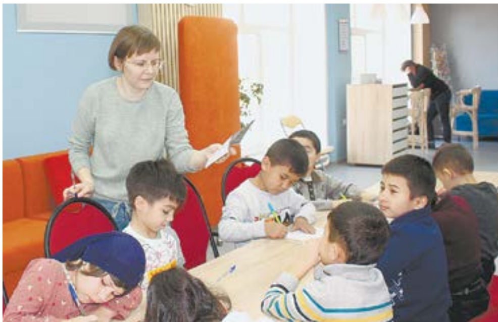
Занятия у младших школьников.