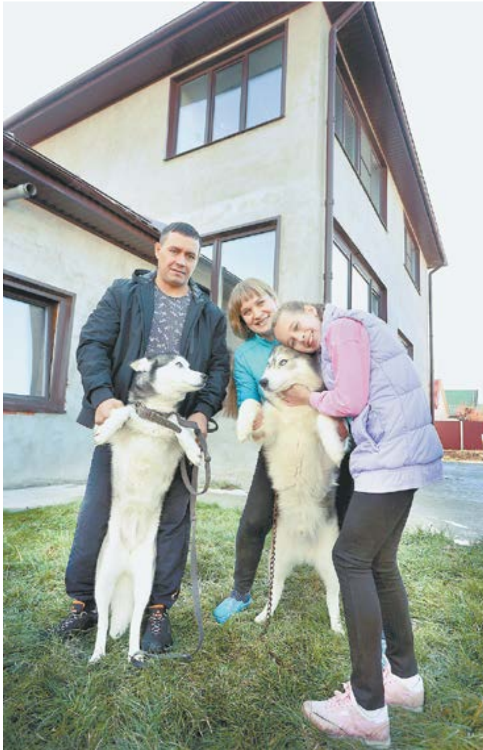
Голубоглазые питомцы – гордость хозяев.