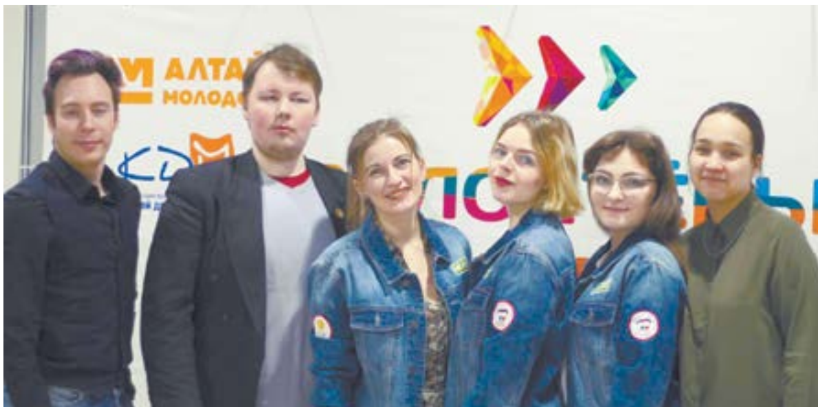
Добровольцы проекта «Волонтеры дружбы».