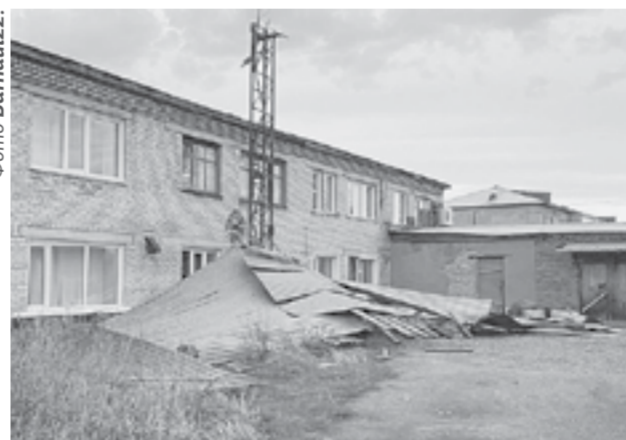
Со здания в Змеиногорске снесло кровлю.