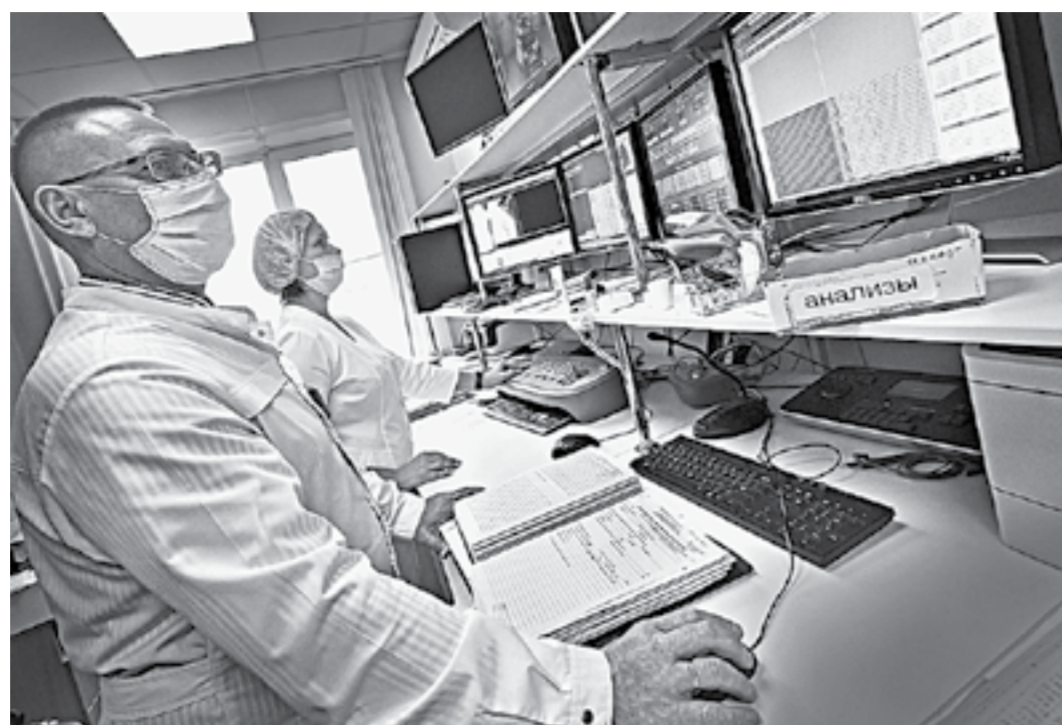
Статистика заболеваемости растет, но и медицина развивается.

— Пусть с каждым разом боль и физическое недомога-