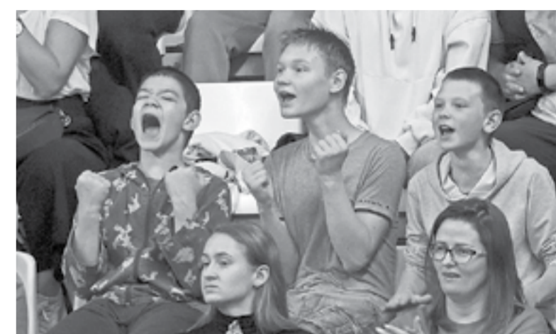
Барнаульцы едва не увидели сенсацию в матче с «Руной».