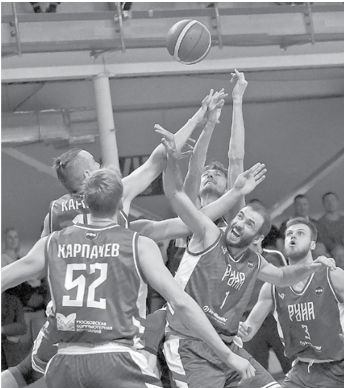
Поединок с фаворитом.

На такой приятной ноте команда подходила ко второму домашнему матчу. Правда, 22 октября соперник у «горожан» был куда серьезнее – московская «Руна», прошлогодний серебрянный призер Суперлиги.