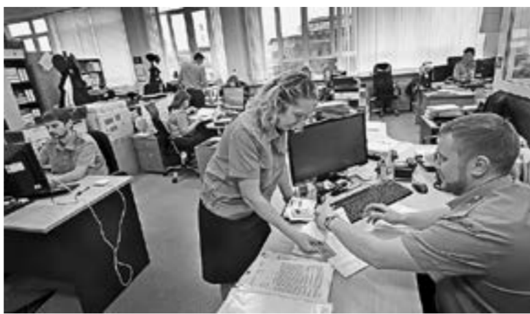
Рабочий день сотрудников таможенного поста в разгаре.