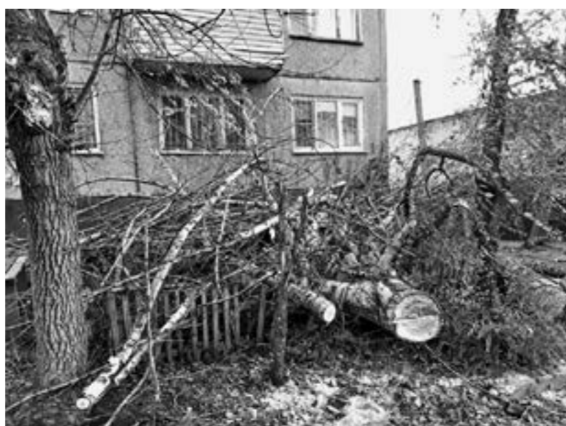
Сухое дерево упало на ул. Юрина, 225. У этого дома повреждено три балкона.

школа. Ветром приподняло старый шифер на образовательном учреждении, однако в целом здание не пострадало. Удаленные населенные пункты на короткий промежуток времени остались без электричества из-за мокрого снега.