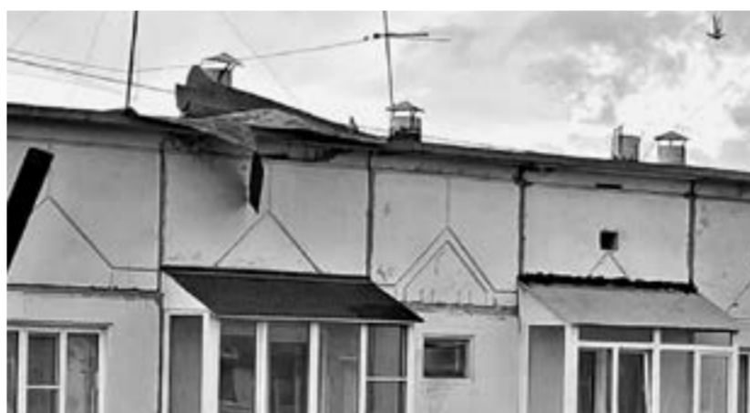
Поврежденная крыша в Рубцовске.