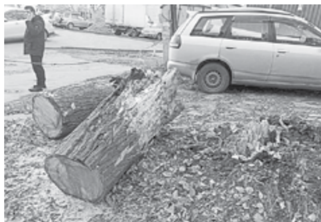
Службы Барнаула устраняют последствия.