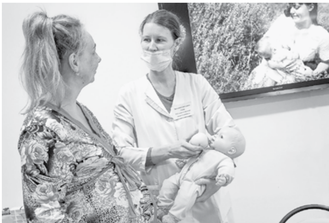
На занятиях по грудному вскармливанию.

Сегодня в каждом род- доме работают кон- сультанты по грудно- му вскармливанию. Они проводят курсы для пер- вородящих и опытных мам. Женщины призна- ются, что с годами все забывается и хочется наверстать упущенные знания.