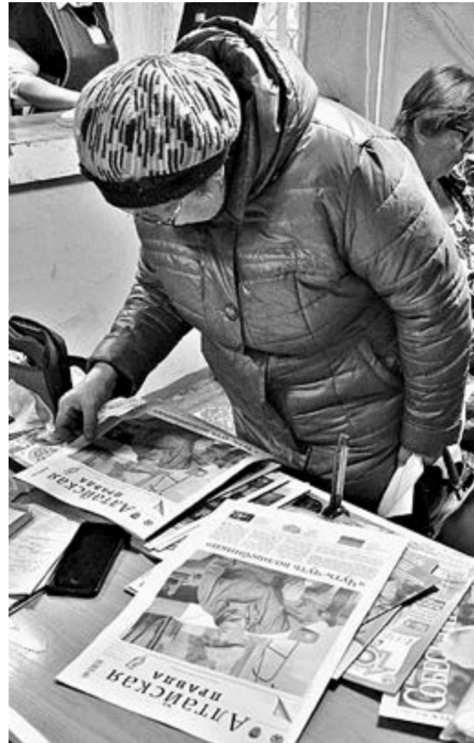
Многие подписчики остаются верными «АП».