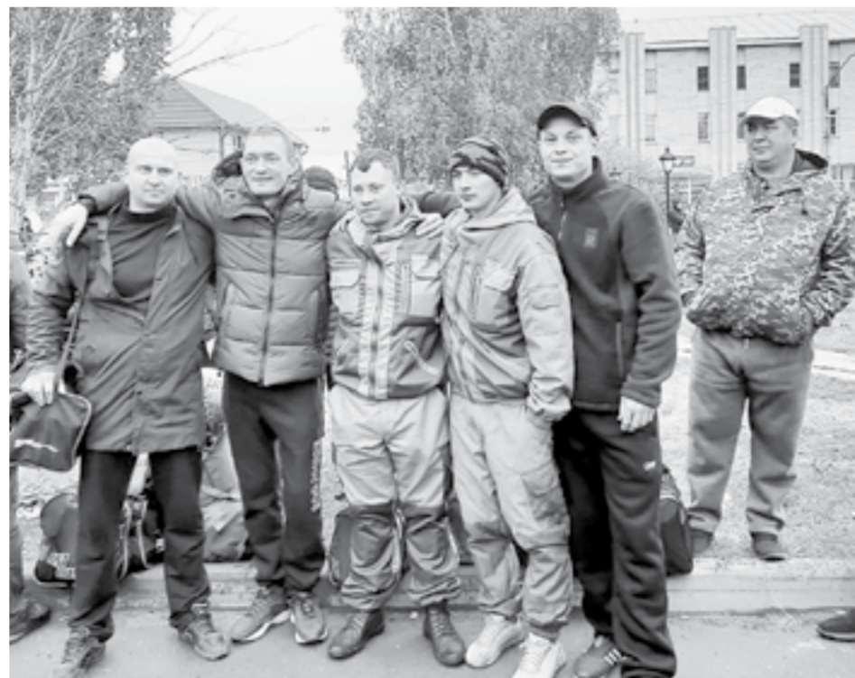
В районах края мобилизованных провожали тепло и душевно.

– В прошедшие выходные заслушали доклады представителей Правительства Алтайского края и военного комиссариата, которые выезжали в Омск в учебный центр. С руководством Омского филиала Академии тыла Вооруженных Сил РФ налажена прямая связь по вопросам размещения и обеспечения граждан, мобилизованных из Алтайского края. По моему поручению дополнительно проанализи-