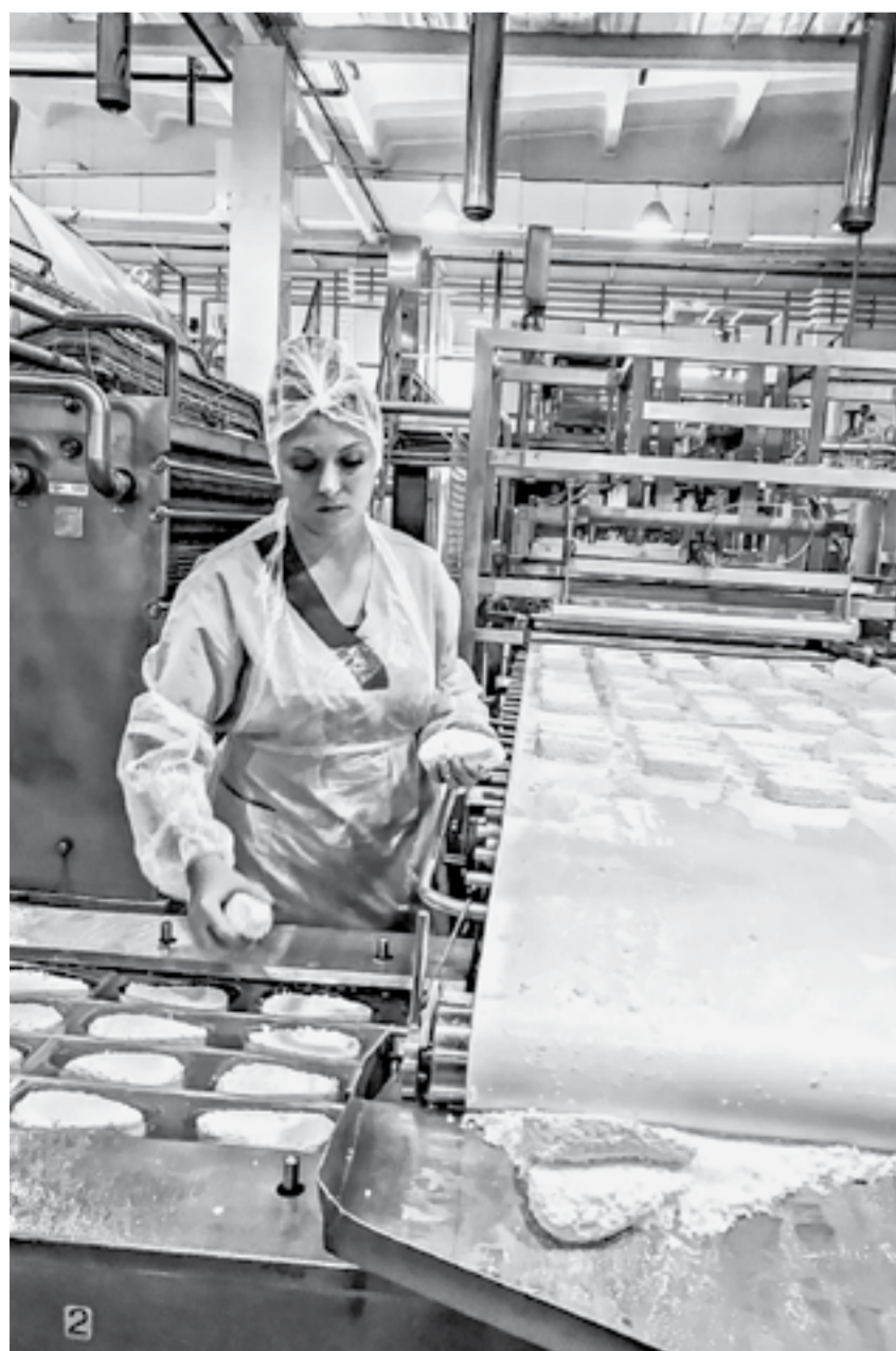
В компании решили сделать упор не на сыр, а на творог.