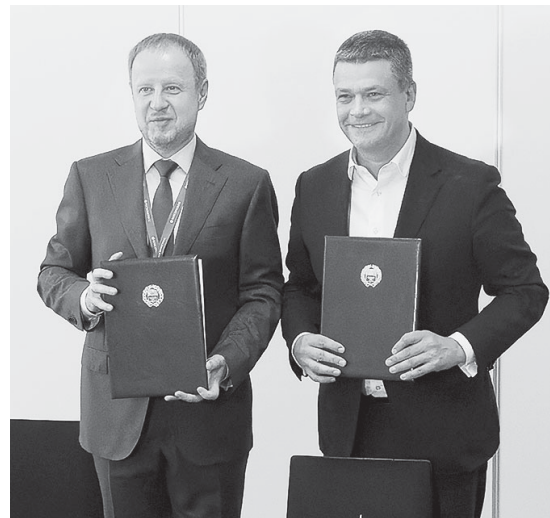
На форуме подписаны два соглашения об инвестпроектах на Алтае.

Недавно во Владивостоке прошел Восточный экономический форум – 2022, на котором Правительство Алтайского края заключило договоры о сотрудничестве по двум инвестпроектам.