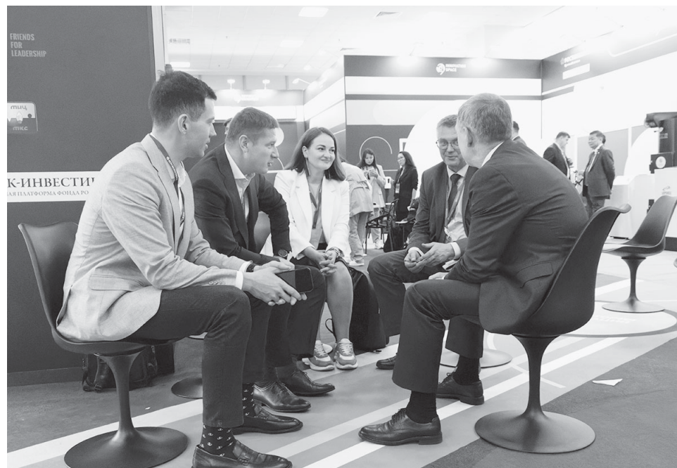
На ВЭФ обсуждались темы, важные для регионов.

Были и другие любопытные результаты участия алтайской делегации в Восточном экономическом форуме. На одной из сессий вице-премьер РФ Дмитрий Чернышенко поручил Минцифры России и Минсельхозу России рассмотреть возможность использования опыта Алтайского края по внедрению информационной системы доведения господдержки до сельхозпроизводителей в рамках создания домена «Сельское хозяйство» на платформе «Гостех».