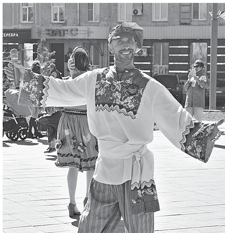
На площади с утра шло веселье.