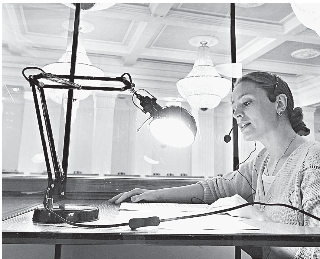
Тифлокомментатор озвучивает описание происходящего на сцене в реальном времени.

В одной из зрительских лож установили звукопроницаемую кабину, где работает тифлокомментатор. Еще перед началом сценического действия он рассказывает о театре, драматургии, постановке, описывает декорации. В случае спектакля «Временно недоступен» по пьесе Петры Виолленбер комментатор к происходящему получил примерно такой: «Ходит Матнас, шатен среднего роста с густыми усами и короткой бородой. На мужчине темный деловой костюм, белая рубашка с галстуком, в руке портфель. Он садится в автомобиль, кладет портфель на сиденье, пристегивается ремнем, надевает солнцезащитные очки. Делает движение рукой, будто проворачивает ключ в замке зажигания» – и так далее. Иногда необходимо упомянуть даже мимику артистов, если она имеет значение для дальнейших событий.