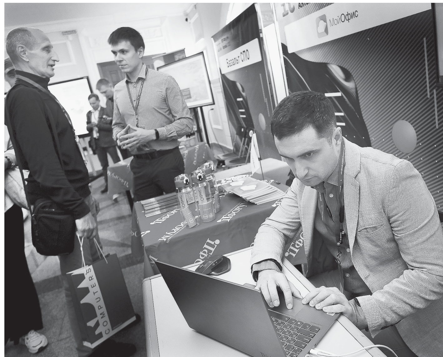
Импортозамещение – главный тренд российской IT-сферы.

– Многие иностранные вендоры перестали поддерживать свою продукцию