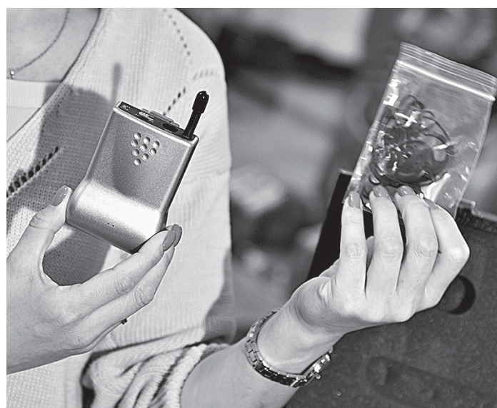
Театр получил 20 комплектов аудиоприемников с наушниками для зрителей.