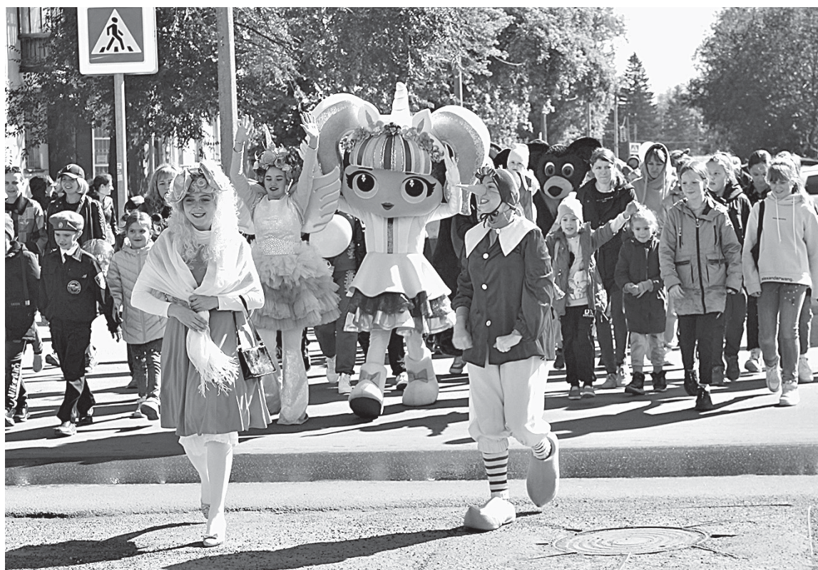
Фестиваль уличных театров начался с шествия ростовых кукол.