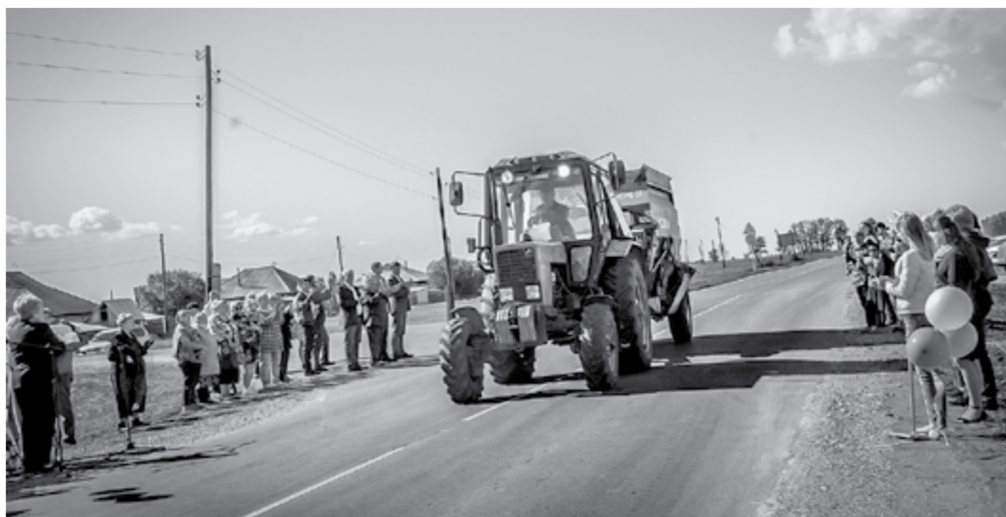
Норма буренкам – по новой дороге.