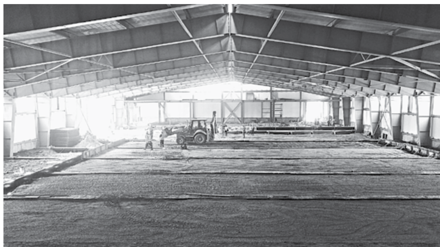
Вид на будущий каток со второго этапа.