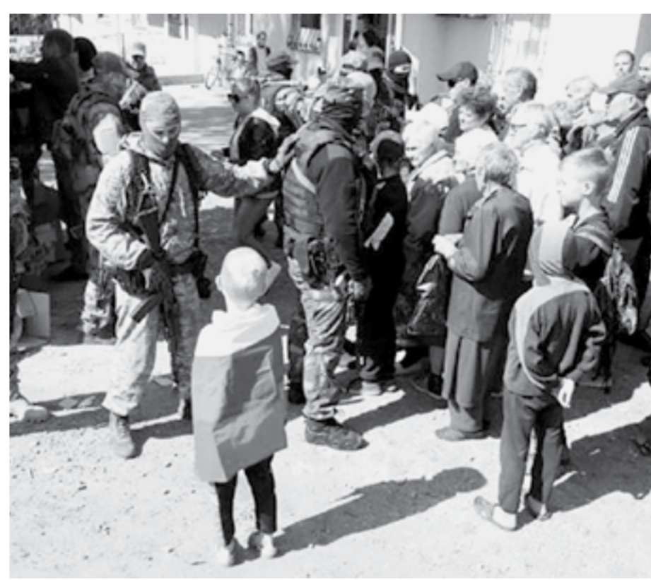
Помощь нужна всем пострадавшим.