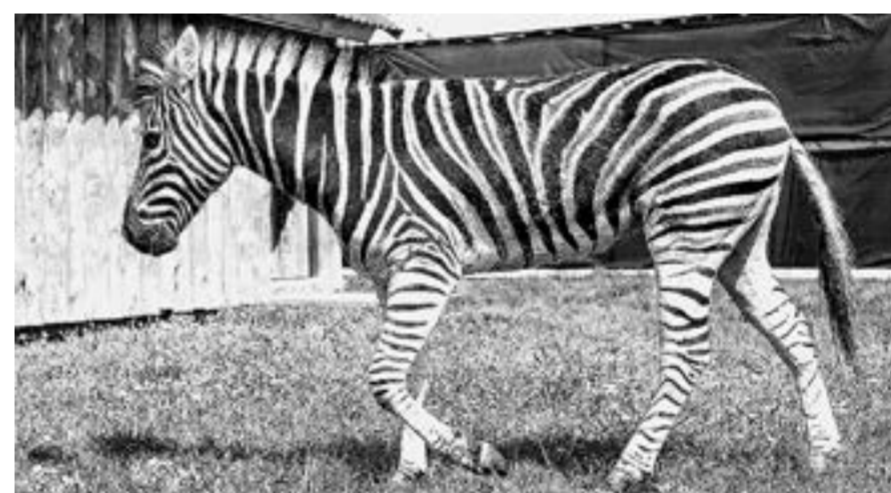
Фото зоопарка «Лесная сказка».