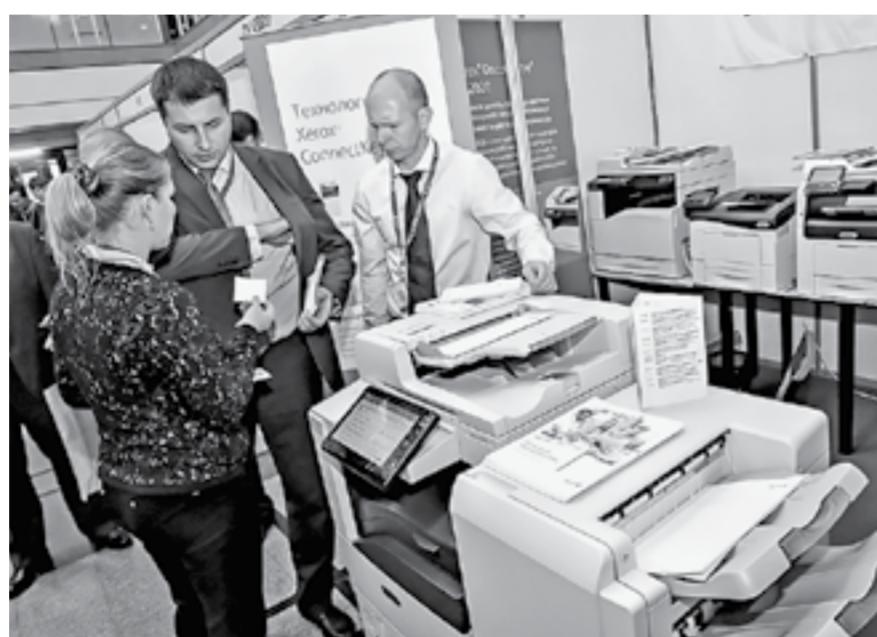
1500 участников, 15 стендов, 120 докладов.

– Мы все соскучились по очному общению, и в этом году участникам предоставится такая возможность, –