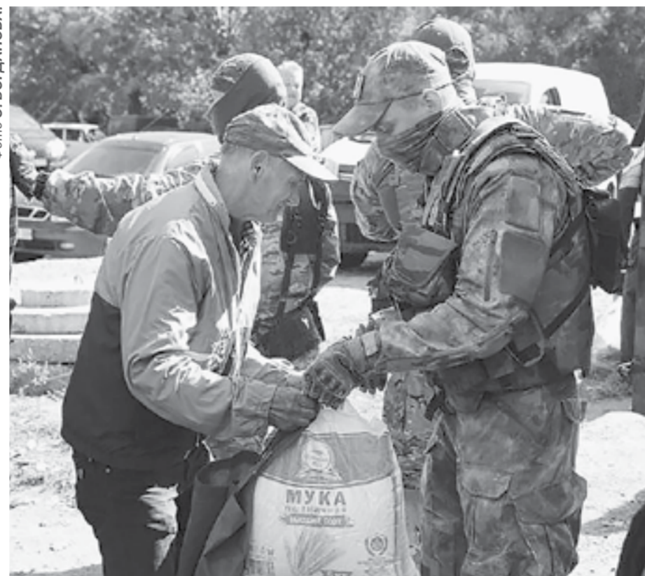
Раздача «гуманитарки» жителям Донбасса.

Более 175 тонн гуманитарных грузов за последние пять месяцев отправили из Алтайского края в Донбасс. Накануне военнослужащие и сотрудники Росгвардии доставили в Лисичанск 21 тонну продуктов из нашего региона.