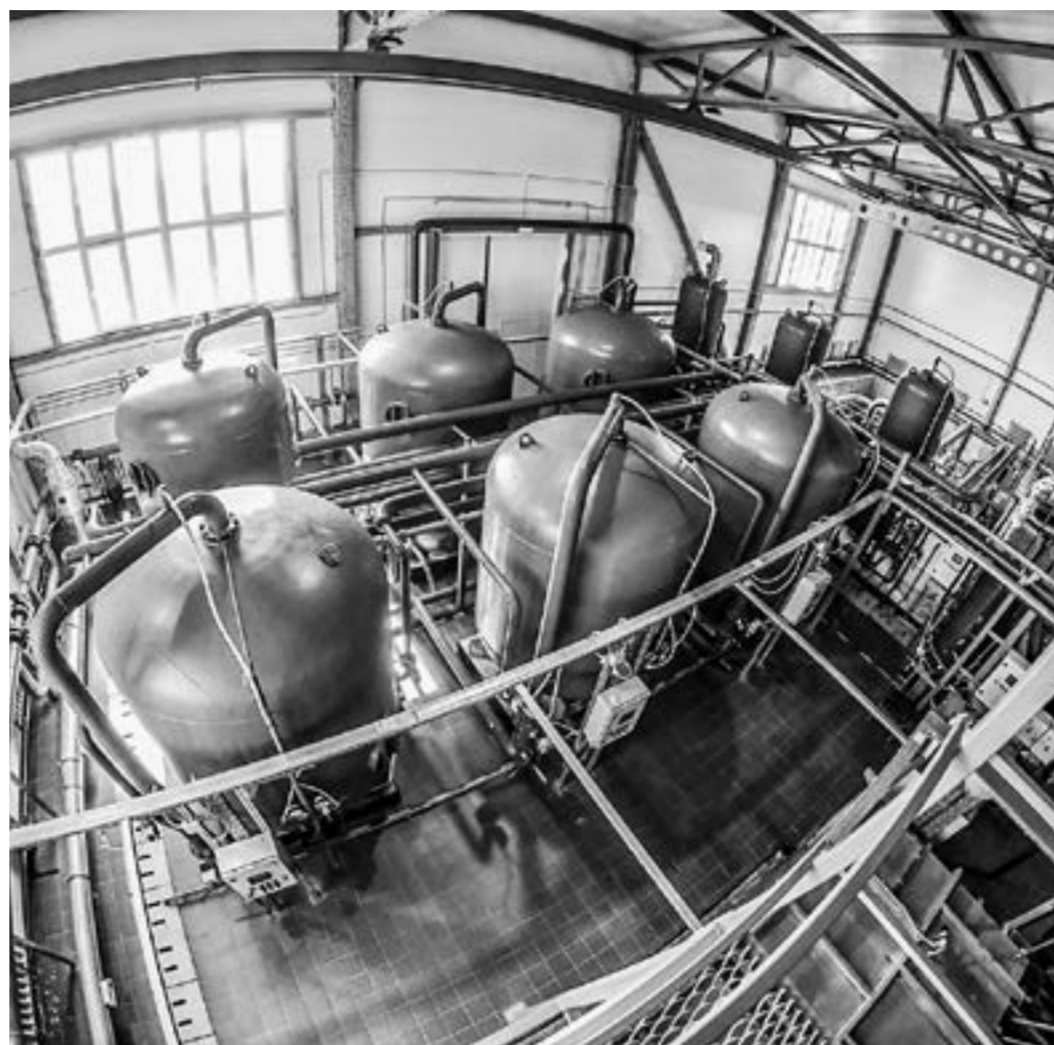
Современная система очистки.

В Тальменке построили современный комплекс водозаборных сооружений, с запуском которого местные жители надеялись на улучшение качества питьевой воды в райцентре. Она действительно стала лучше и, тем не менее, решить проблему окончательно не удалось из-за изношенности водопроводных сетей. Некоторые из них были проложены еще в 1913 году.