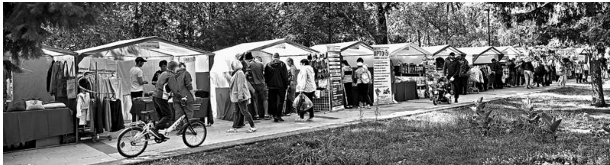
Ярмарка малых ремесел края собрала более 90 субъектов малого и среднего бизнеса.

Вторым производством, заинтересовавшим корре-