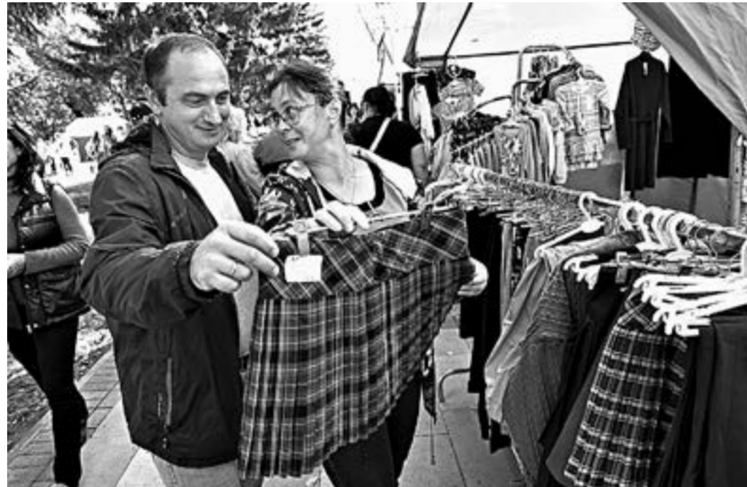
Барнаульцы могли найти товар на любой вкус.