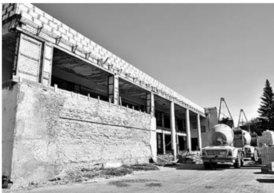
Ремонт ДК в Усть-Калманке закончится в следующем году.

В Усть-Калманке в рамках краевой инвестпрограммы приводят в порядок Дом культуры, который был построен в 1975 году и с тех пор не видел капремонта.