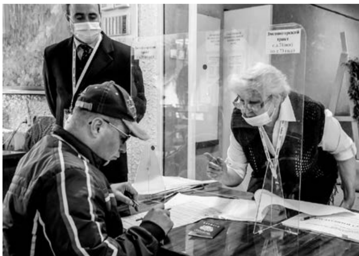
Жители региона сформировали органы местного самоуправления в Барнауле, Бийске, Заринске, Новоалтайске, Рубцовске и Яровом, в Суетском и Чарышском муниципальных округах.