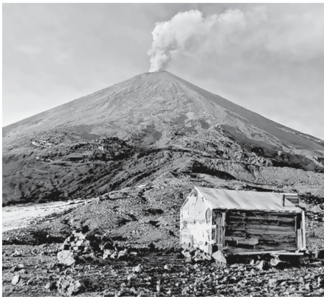
Ключевская Сопка. Действующий вулкан.