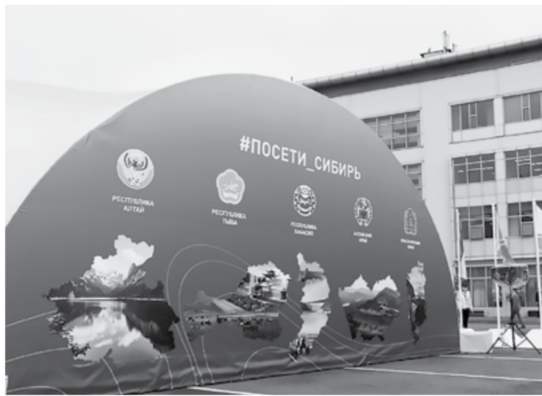
Форум дает возможность заключить соглашения о реализации целого ряда инвестпроектов в регионах Сибири.

На сегодняшний день среди компаний, являющихся резидентами фонда «Сколково» от Алтайского края, – ООО «Сиб-ФОРС» (выпускает оборудование для моделирования цифрового двойника клиента, помогает найти именно нужного клиента, узнать его и сформировать ценностное предложение).