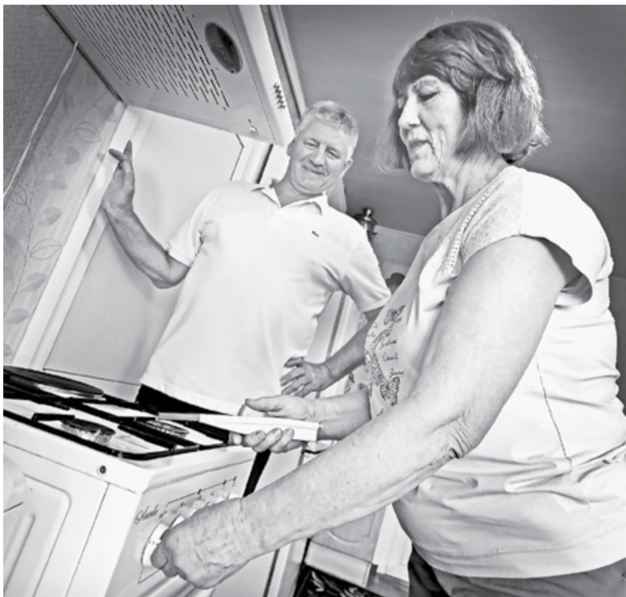
Семья Тюниных осваивает новую плиту.