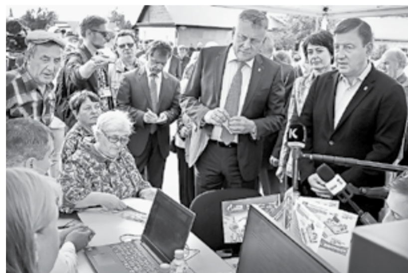
В мобильном офисе Газпрома.