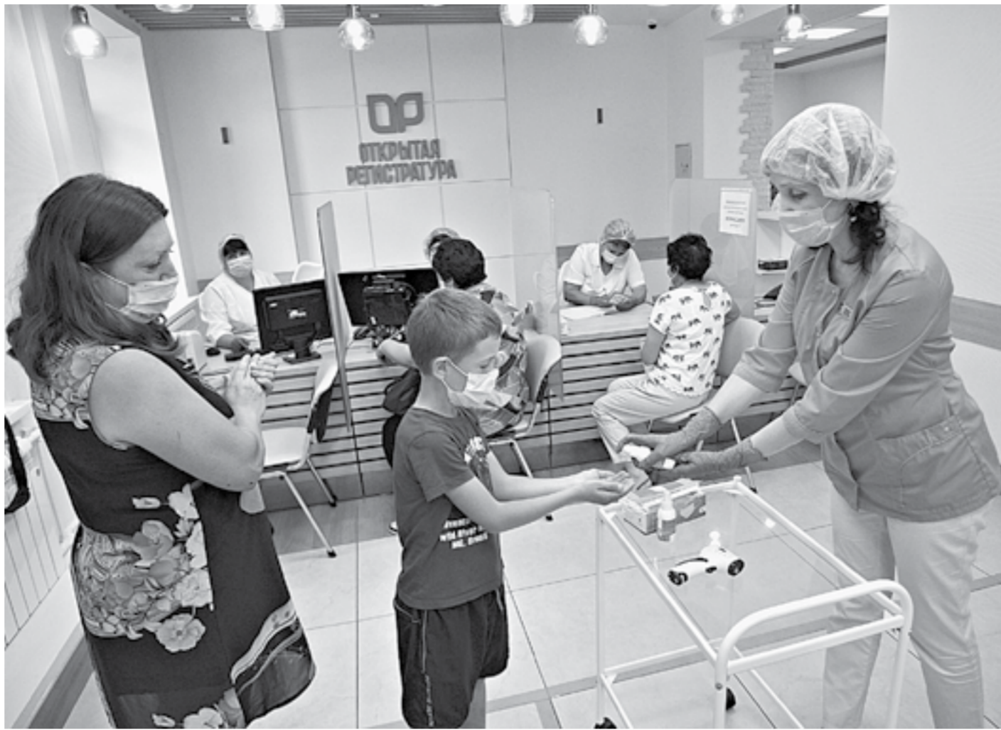
В поликлиниках пациентов стало заметно больше.

В Алтайском крае наблюдается рост заболеваемости ковидом. За прошедшую неделю в регионе зафиксировано более 4000 случаев, что на 67% больше, чем за предыдущие семь дней.