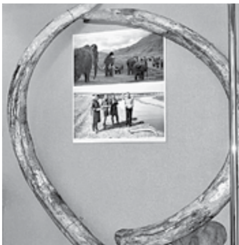
В музее хранятся бивни мамонта.