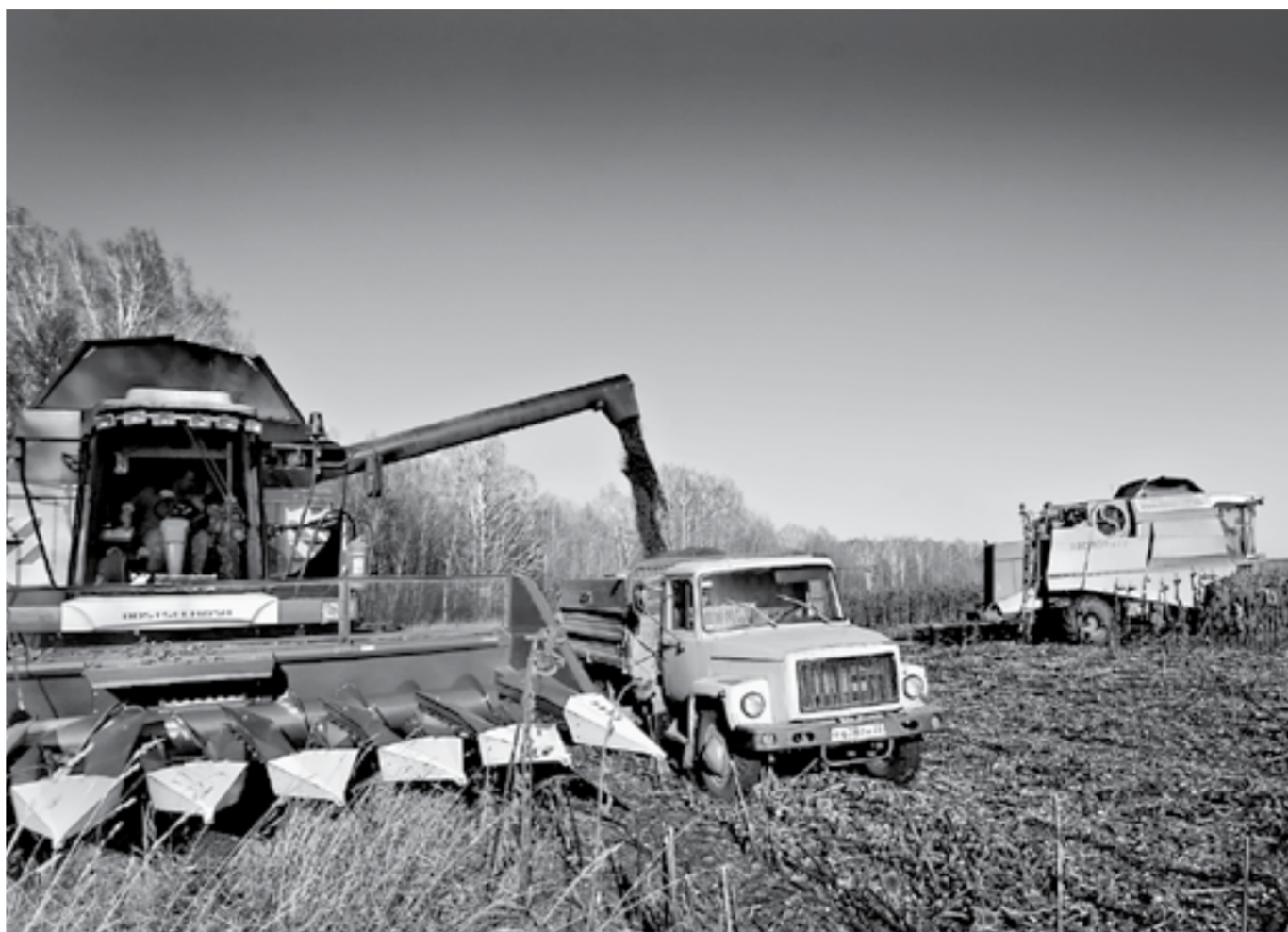
У российского масла есть шанс занять одно из ведущих мест на мировом рынке.