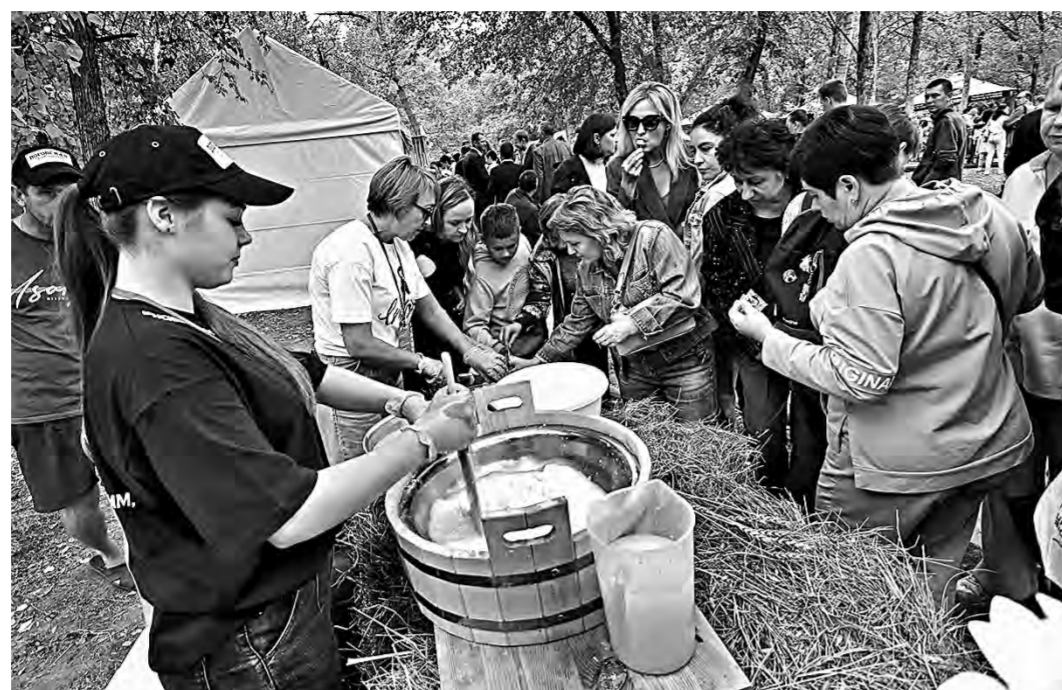
Посетителей угощали моцареллой.

– Алтайская продукция давно стала синонимом здорового питания. На фестивале мы создали такой формат, чтобы свои идеи и продукцию смогли представить и крупные предприятия, и небольшие компании. Особенность Алтайского края заключается в том, что здесь успешно работает агропромышленный комплекс, развивается производство сельхозпродукции и ее переработка. Мы можем гордиться тем, что наш регион обеспечивает натуральной продукцией не только себя, но и часть других регионов,