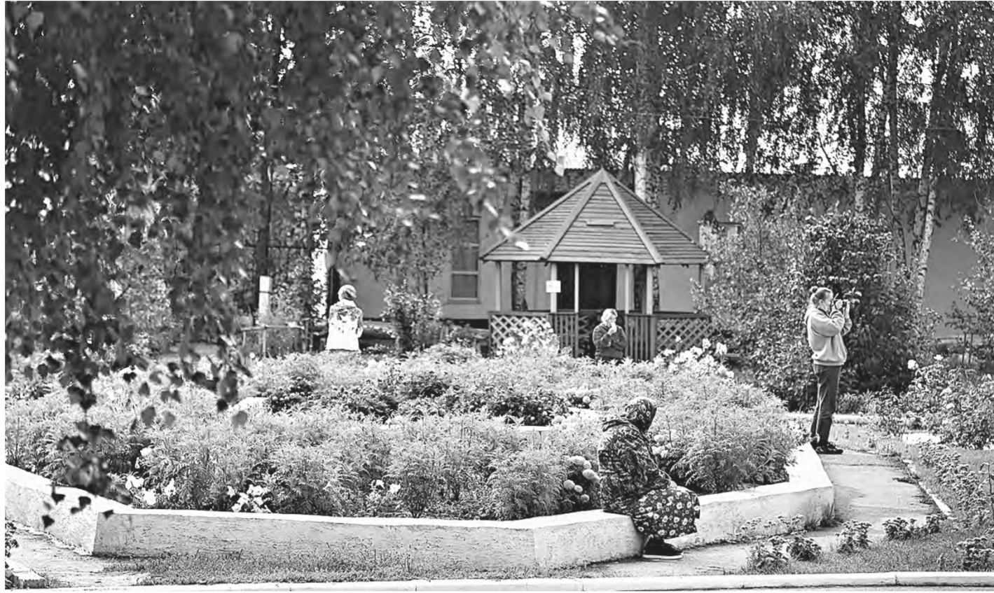
В тиши аллеи.

«Мы дружная семья. Соскучившись по миру за время эпидемии, за последний год с нашими ребятами ездили по экскурсиям, побывали в Барнаульском зоопарке и в