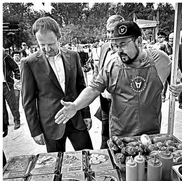
Губернатору показывают мясные деликатесы.

Для журналистов фестиваль – повод пообщаться с руководителями предприятий и узнать, как местные производители сыра, молока и прочих необходимых всем продуктов приспособились работать в условиях все новых и новых западных санкций. – В целом процесс производства сыров не изменился. А вот на условия доставки санкции повлияли, мы подписываем договоры с поставщиками необходимых ингредиентов и этикетки заранее,