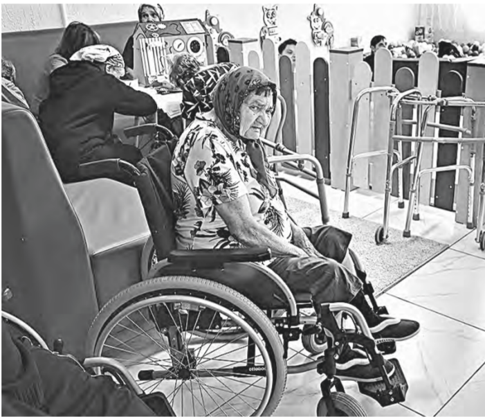
Занятия есть у каждого.