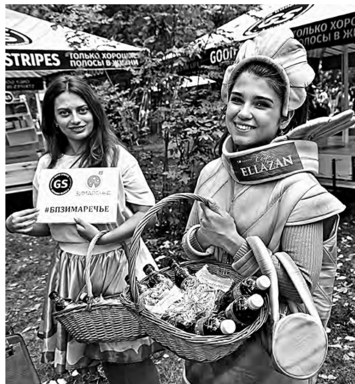
Попробуете сырную носкирку?