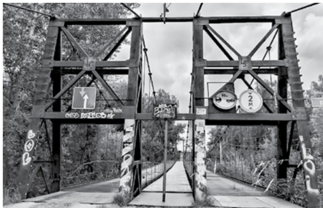
Действующей осталась одна часть моста.

— Я так полагаю: если мост находится на балансе муниципалитета, то должен быть и ответственный сотрудник,