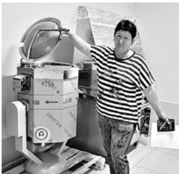
Новое оборудование столовой.