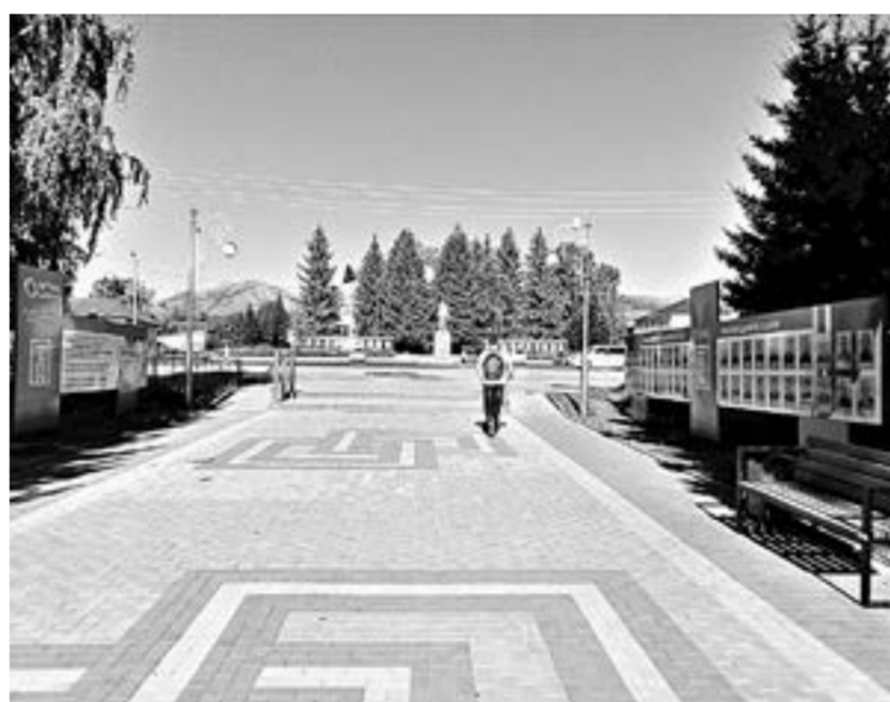
В Змеиногорске появилась Аллея Шахтёров.

главных среди других видов растениеводства АПК «Колос». Более того, агропредприятие семечко не только выращивает, но и перерабатывает, уточняют местные журналисты. «Семечки Покровские» отгружают во все регионы России от Калининграда до Камчатки.