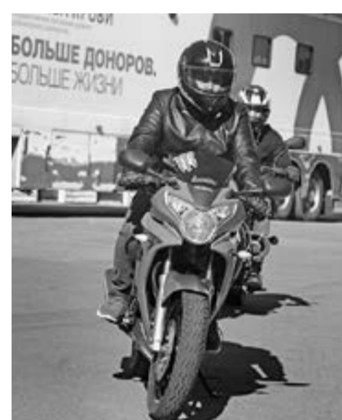
Снова в путь!