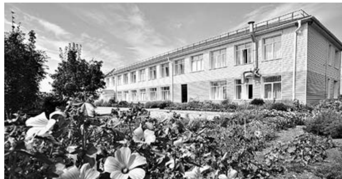
В Нижнеозернинской СОШ учится около 70 человек.

В декабре прошлого года в «Точку роста» пришло несколько коробок – конструктор для занятий робототехникой.