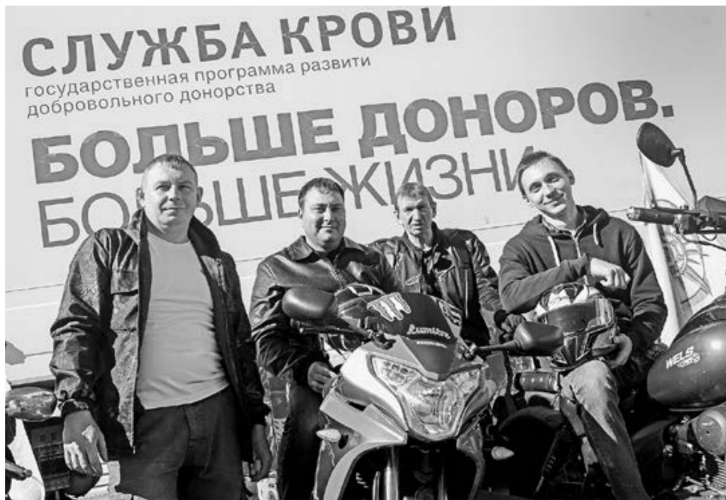
Акция собрала более 100 байкеров.