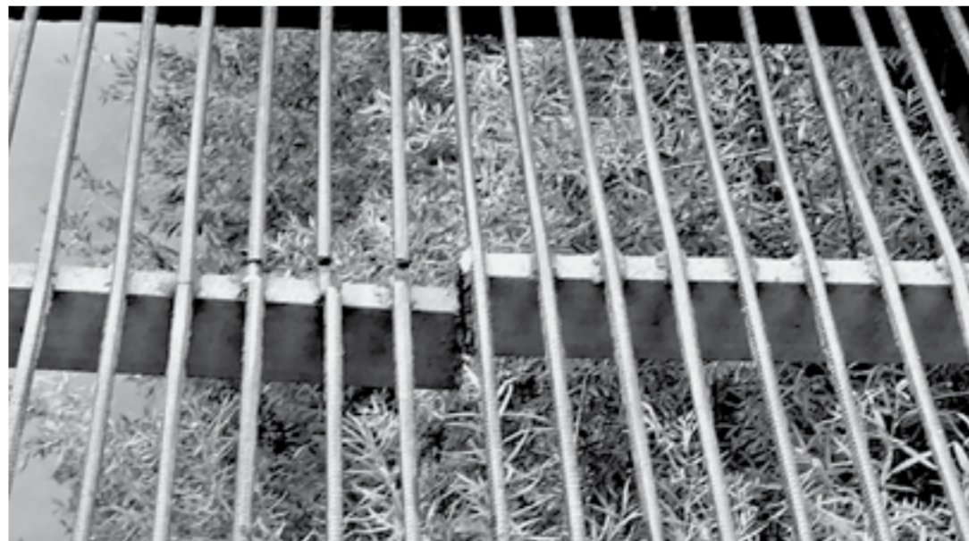
Лопнувшая балка представляет опасность для автотранспорта.

следящий за его состоянием, — рассуждает пенсионер. — Ну разве трудно проехать по нему раз в неделю, осмотреть как следует, убедиться, что все в порядке? Это ведь никаких денег не требует.