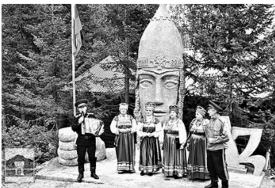
Гостей Белокурихи теперь встречает богатырь.

В 2022 году «Золотой подсолнух» стал победителем конкурса на грант Губернатора Алтайского края в сфере культуры в номинации «Народное творчество». Местом проведения праздника неспроста выбрано село Покровка. Огромные пространства занимают там ярко-желтые поля подсолнечника. Эта культура является одной из