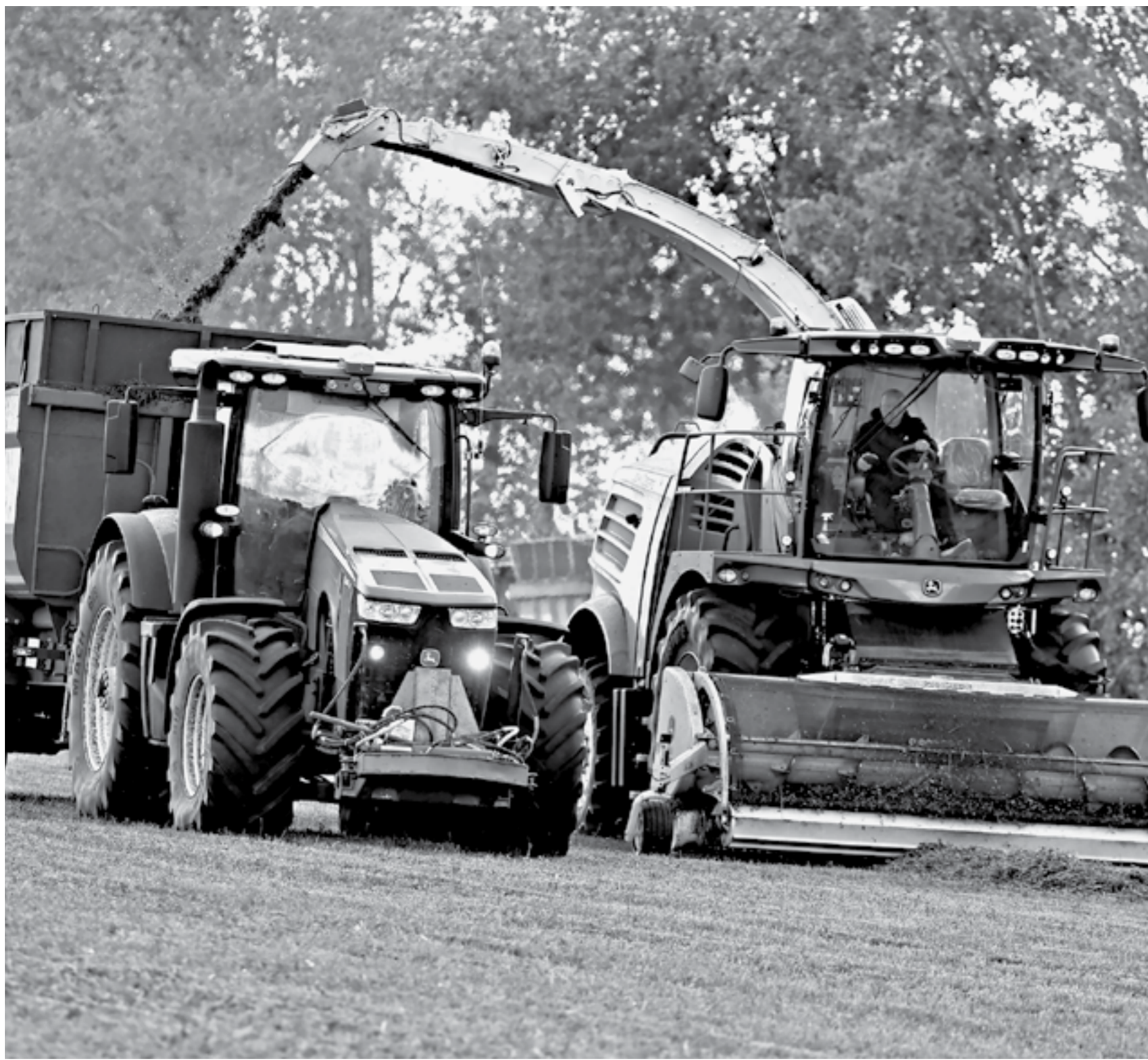
Темпы работ на полях — на уровне среднеевропейских показателей.