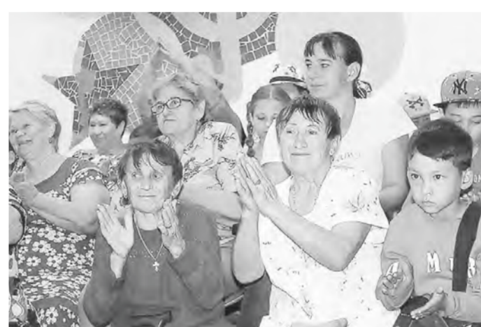
Жители поселка Зерно аплодируют веселоярцам.

– Есть такой автобус «бабочка». Он раскрывается, появляется площадка для выступлений. Там находится звуковая аппаратура, генера-