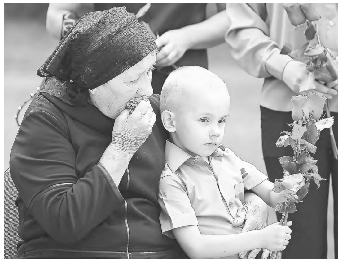
Для матери потеря сына – огромное горе.