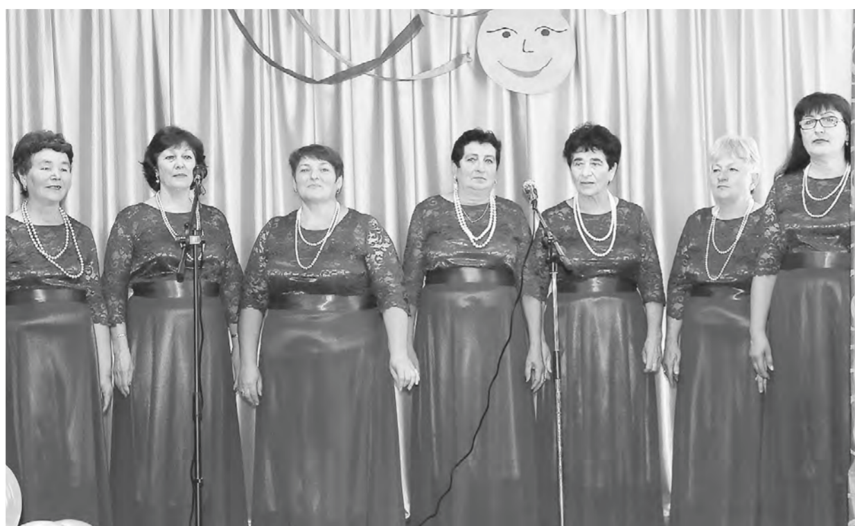
Выступает женская вокальная группа «Грустиночка».

Основа бригады – 11 самодеятельных артистов из Веселоярска, по большей части пенсионеры. С собой частенько приглашают коллег из других сельских домов культуры. И репертуар получается разнообразнее, и артистам в радость