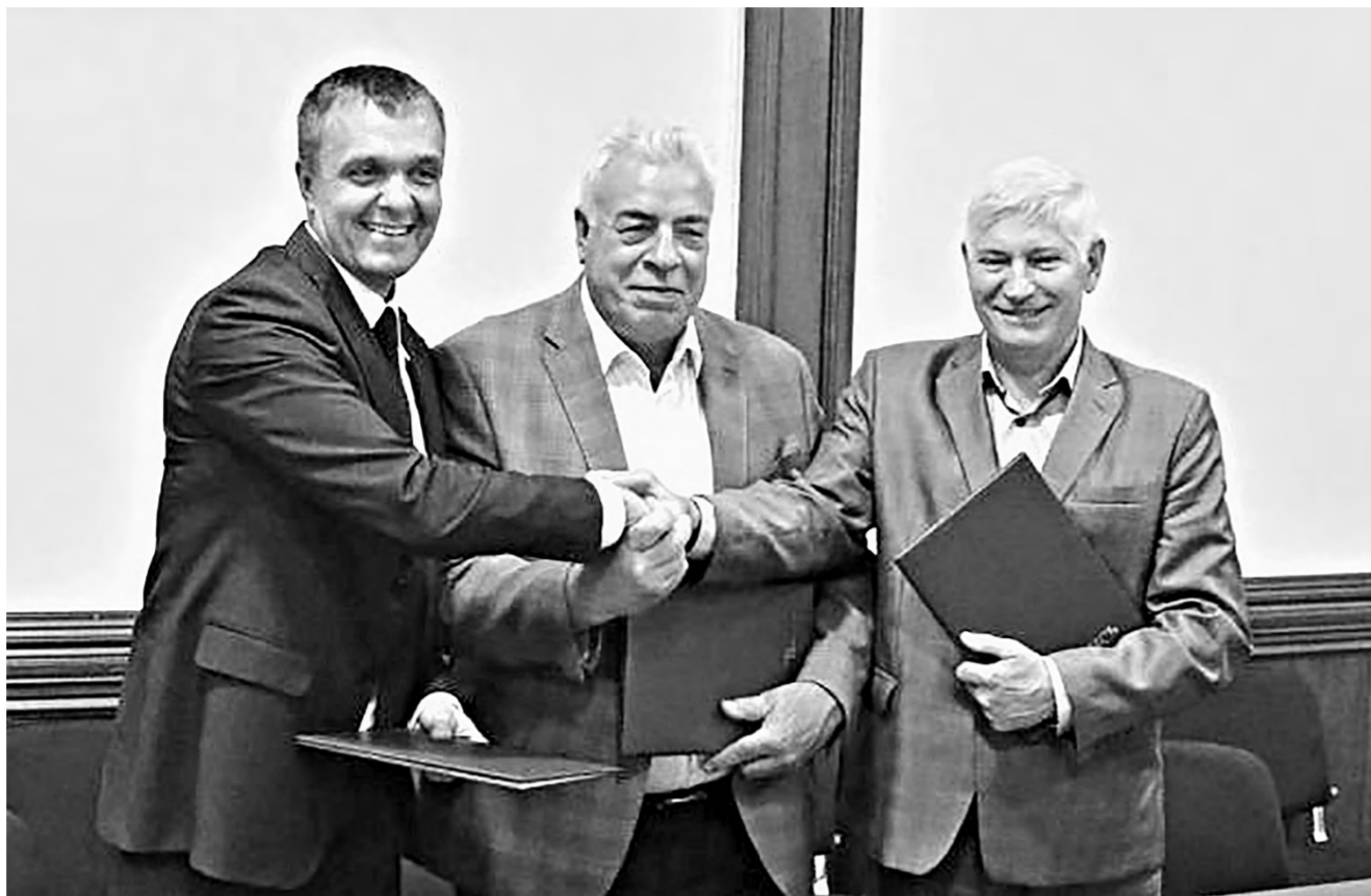
Подписание трехстороннего соглашения выведет корпоративный спорт в крае на новый уровень и будет касаться всего трудящегося населения, кроме профессиональных спортсменов.