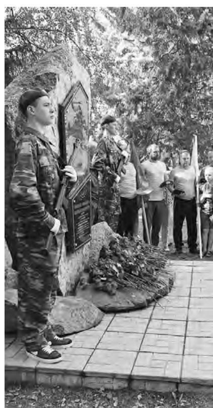
(Начало на 1 стр.)

Теперь в торжественной церемонии передачи награды кроме жителей приняли участие губернатор и члены правительства региона, представители местной власти и силовых структур края. И конечно, родные и близкие героя. Мама не могла сдержать слез, скорая помощь дежурила рядом.