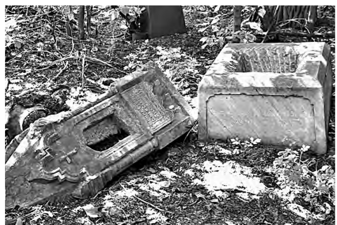
Большинство памятников выглядят удручающе.