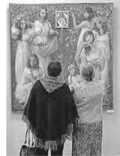
– зал № 3 – «Небо для всех»; – зал № 6 – «Барнаул XX – начала XXI в.».

Светлана ТИРСНАЯ (фото из архива автора) Стиль и орфография приведенных документов сохранены.