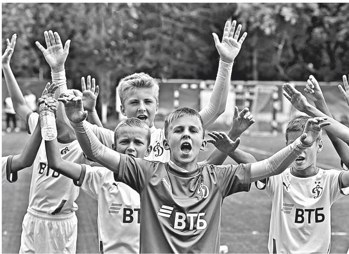
В споре за медали мемориального турнира лидировали команды из системы московской Академии «Динамо» имени Льва Яшина.