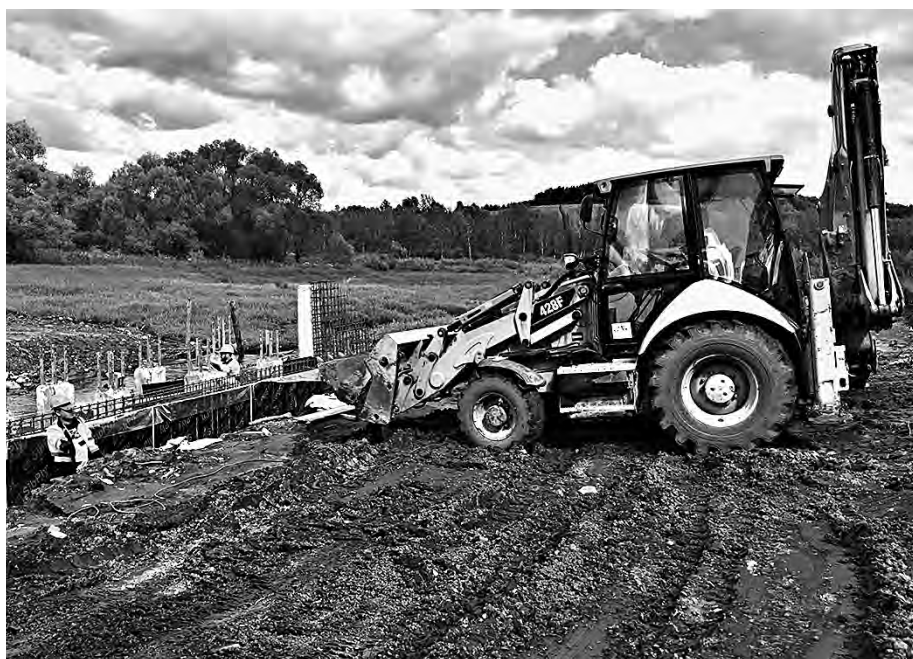
Разработка грунта перед строящимся мостом.

Во время паводка любая дорога может превратиться в дамбу. Поэтому вдоль улицы будут смонтированы 17 пандусов, предназначенных для водоотведения. К некоторым домам обустроят съезды. Также на объекте установят освещение, барьерные ограждения,