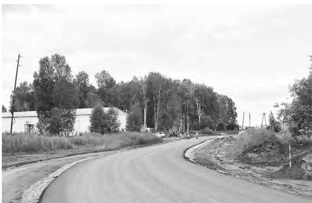
По этому участку уже гуляют местные жители.