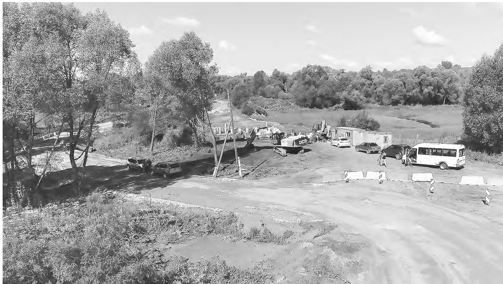
Через 3 месяца дорогу в селе Верх-Жилино будет не узнать.