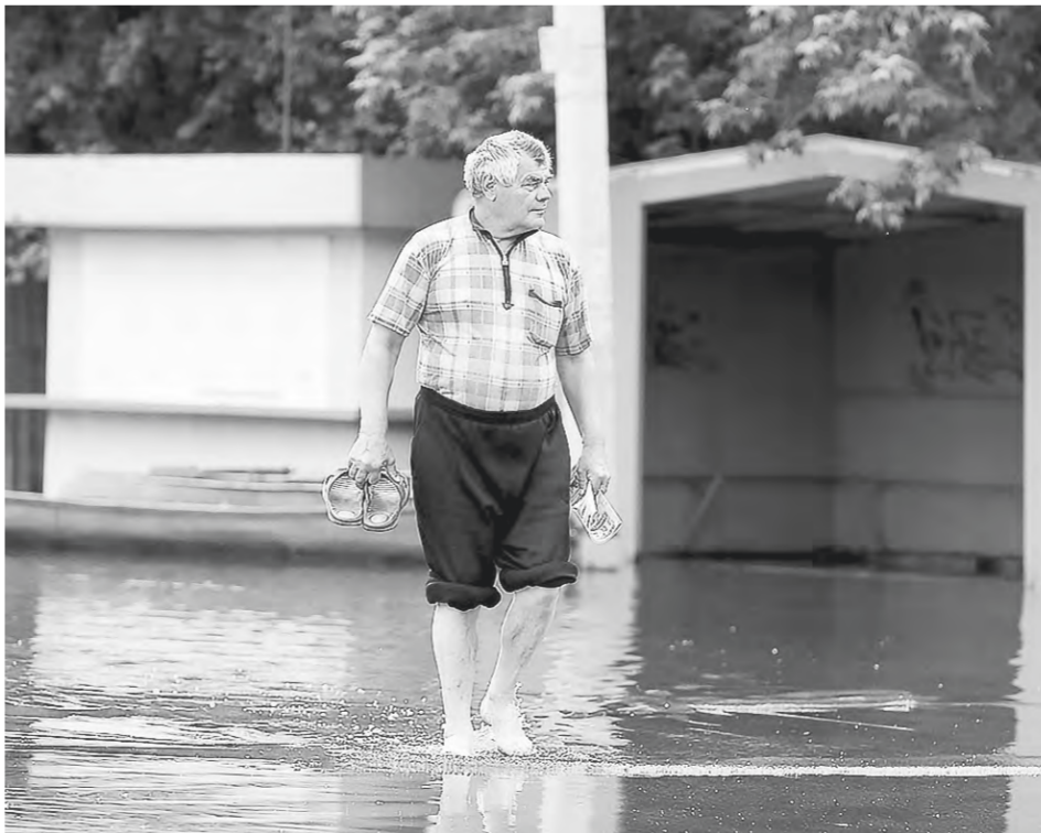
Уже в августе проблемные участки прочистят.

АО «Алтайкоммунпроект» в течение месяца подготовит предварительный проект расположения сетей городской ливневой канализации. А комитет экономического развития и инвестиционной деятельности рассмо-