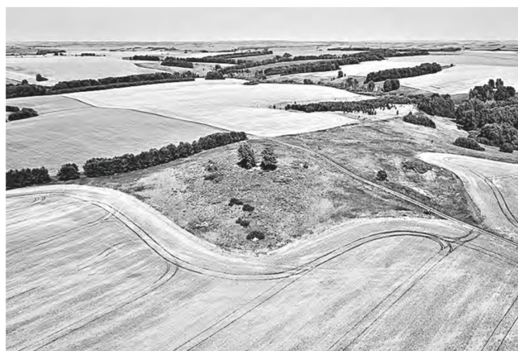
С высоты полета квадрокоптера.

Именно в Целинном районе находится самая южная и самая высокая его часть с самой высокой вершиной – горой Кивда. Мало того, эта часть Салаира необычна. Все привыкли к тому, что Салаир – таежный край, где господствует черневая тайга. Но для края, что проходит в Целинном районе, предлагаю термин – «степной Салаир». Тайги здесь нет, но зато на