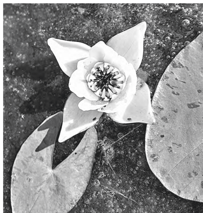
Цветочек не аленький – уникальный.