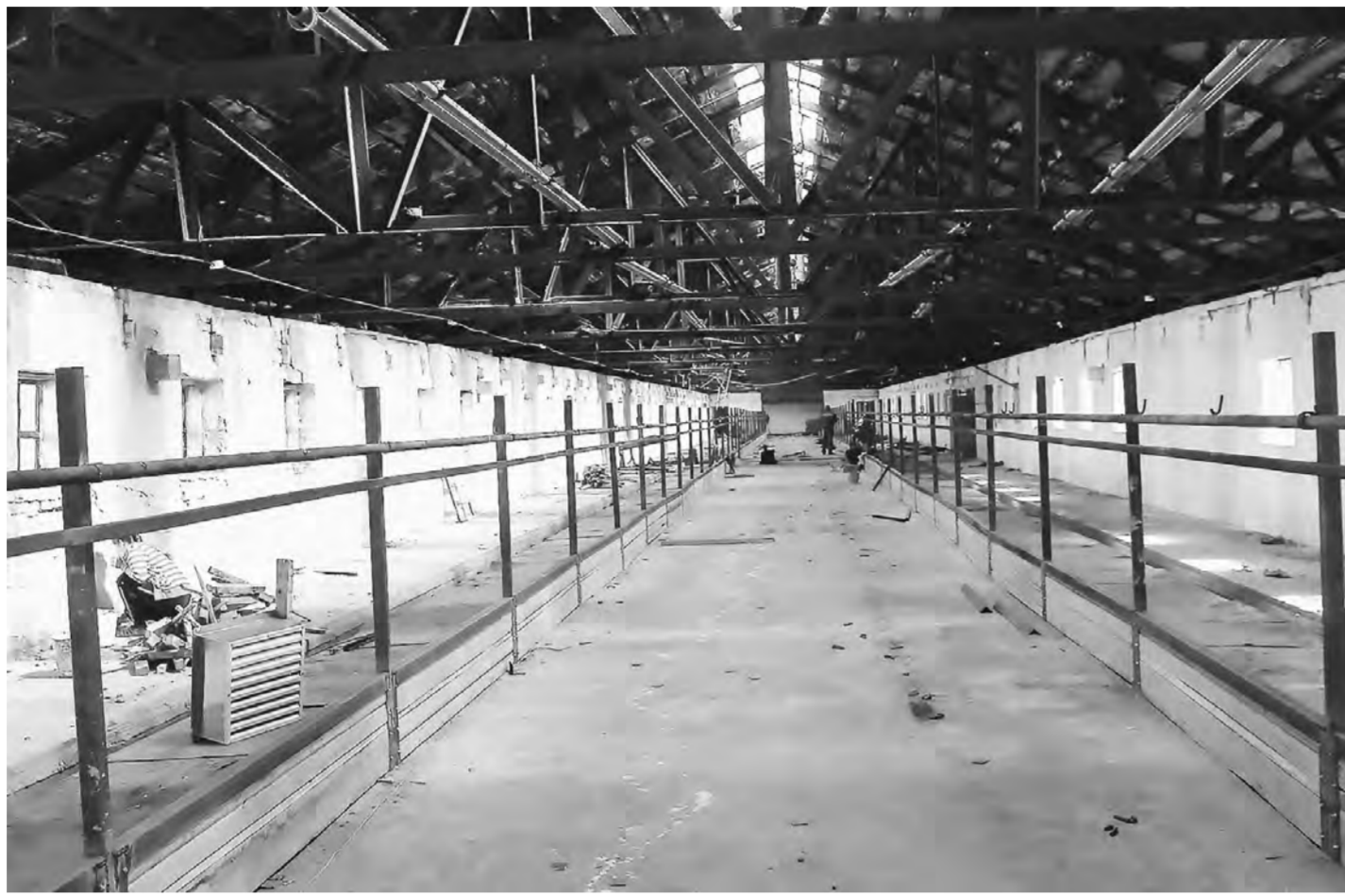
Ферма в Буграх будет модернизирована.

В обновленном помещении животные останутся без привычной подстилки. Изготовлен специальный пол спрессованными ковриками и решеткой. Навоз уйдет по транспортеру, и корова будет стоять чистенькая.