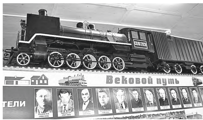
На таких тепловозах работали до 1958 года.

—И кстати, кидал его в топку вовсе не чочегар, как принято считать, а помощник машиниста. Чочегар лишь был на подхвате, – замечает Евгений Михайлович.