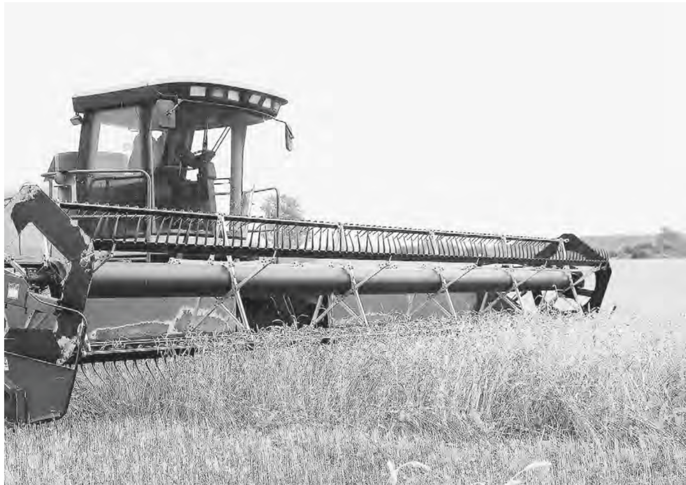
Носовица озимых началась.

На уникальном для Алтайского края предприятии ООО «Степной» началась уборка озимой пшеницы. Да не просто пшеницы, а выращенной по всем правилам органического земледелия, то есть без «химии».