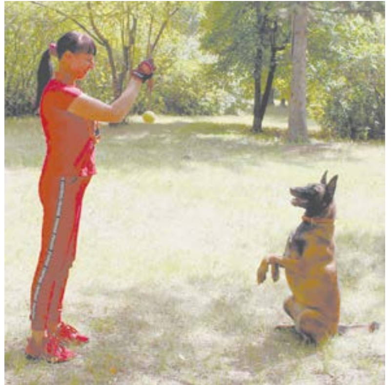
Собака должна беспрекословно выполнять команды.