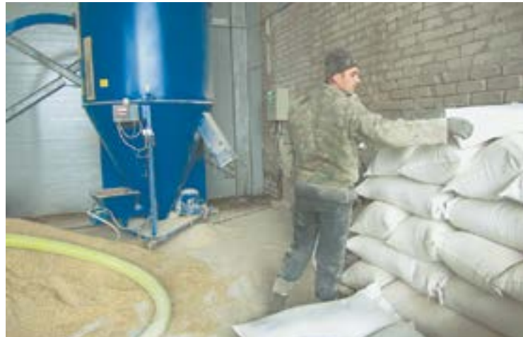
Продукция крупкоцеха фирмы «Алтайский стандарт» поступает в самые отдаленные уголки России.