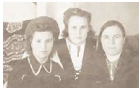
Фото из музейной экспозиции.