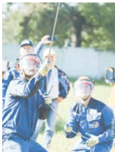
Бригады электромонтеров работали слаженно.

– Ежегодно в состязаниях соперничают новые команды – лидеры отборочных этапов, которые проходят в филиалах. Обмен опытом, внесение рационализаторских предложений, получение новых знаний и совершенствование практических навыков – ради этого и проводятся соревнования. Команда организаторов под руководством заместителя генерального директора – главного