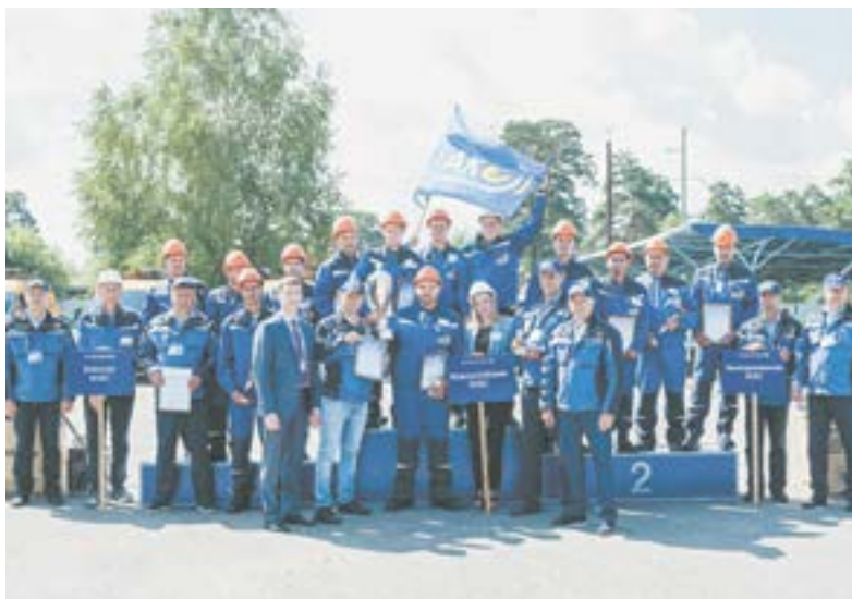
Победила бригада Тальменского участка Новоалтайских МЭС.