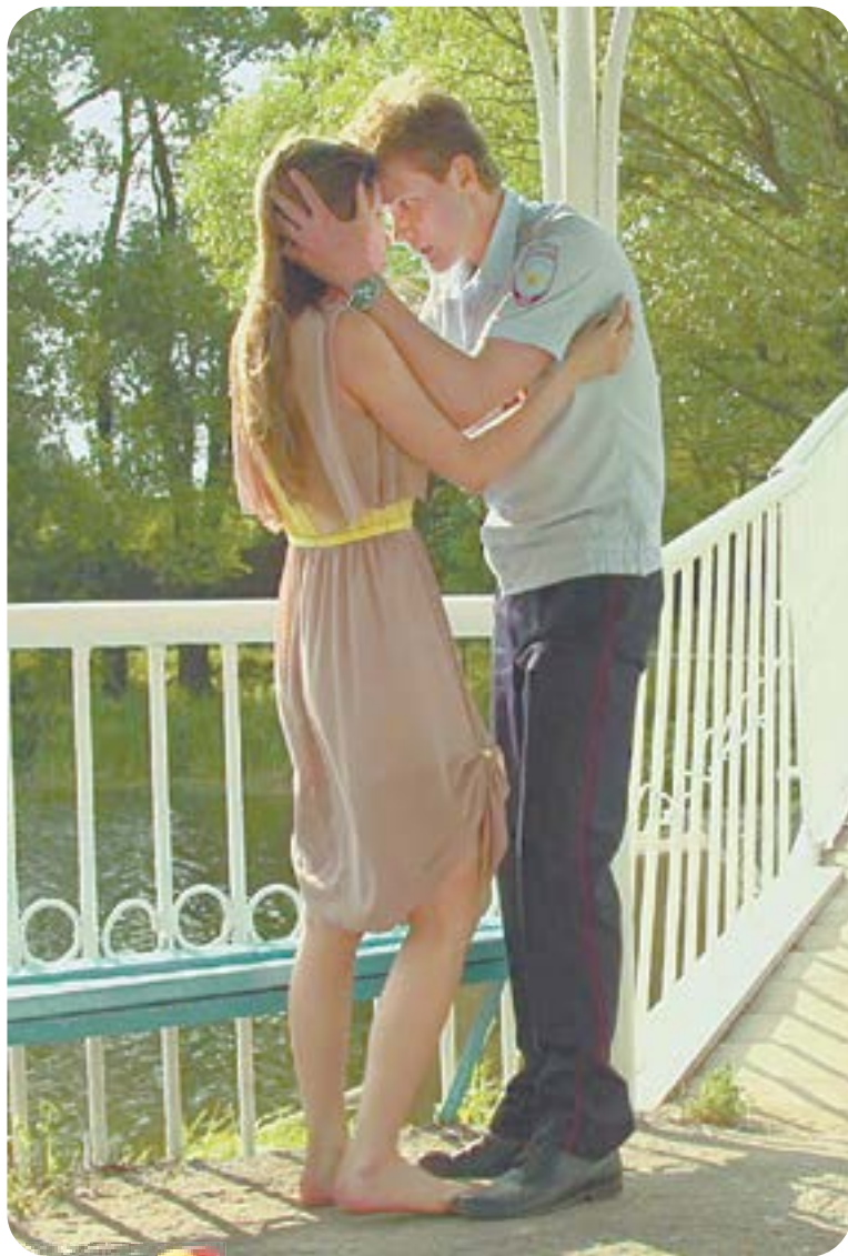
19.00 Х.ф. «Из Сибири с любовью» (16+)

04.50 Т/с «Улицы разбитых фонарей» (16+) 06.30 «Утро. Самое лучшее» (16+) 08.00 «Сегодня» 08.25 Т/с «Морские дьяволы» (16+) 10.00 «Сегодня» 10.35 Т/с «Морские дьяволы» (16+) 13.00 «Сегодня» 13.30 «Чрезвычайное происшествие» 14.00 Т/с «Береговая охрана» (16+) 16.00 «Сегодня» 16.50 «За гранью» (16+) 17.55 «ДНК» (16+) 19.00 «Сегодня» 19.50 Т/с «Десант есть десант» (16+) 21.40 Т/с «Под напряжением» (16+) 23.35 «Сегодня» 00.00 Т/с «Пес» (16+) 02.00 Т/с «Братаны» (16+)