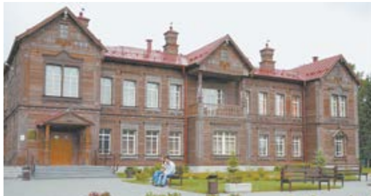
Мемориальный музей оружейника сегодня посещают гости из разных уголков страны и из-за рубежа.