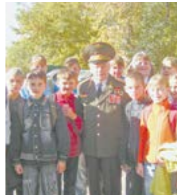
Михаил Калашников на улицах Курьи.

Люди всегда были и остаются главным богатством курьин-