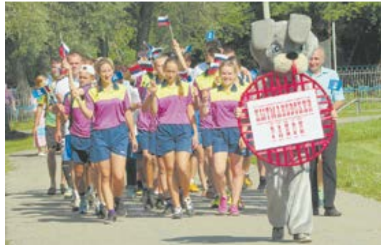
Район силен спортивными традициями.