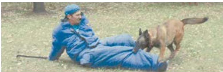
От острых зубов спасает специальный костюм.

снаряды: трамплин, качели, бум, еще одна горка и высокий полуметровый барьер – находится дома, потому что индивидуальные занятия проводятся там.