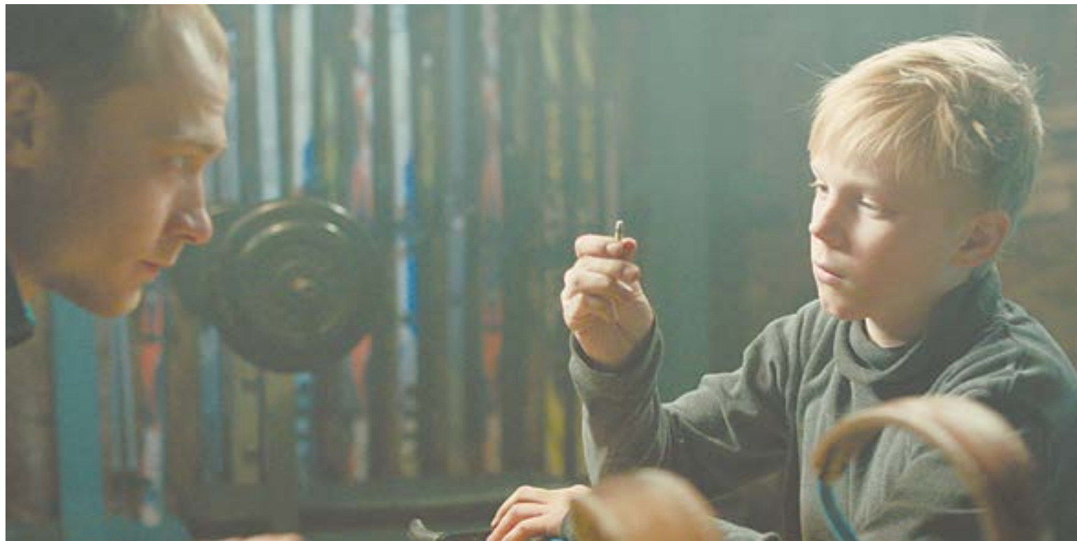
Кадр из фильма «Подельники».

События – это в основном скупые разговоры, в которых оба, как позже выяснится, не до конца честны. Василий учит дочь чистить картошку и переводить стрелку на железной дороге, она расспрашивает о войне. Он вспоминает, как однажды, спасая свою жизнь, убил человека. В тумбочке она находит лекарства, которые он почему-то не пьет и потому страдает от жестоких припадков. Как будущий медик Алёна со всей серьезностью убеждает его лечиться, как новообращенная дочь, пытается как-то наладить его странную одинокую жизнь на отшибе цивилизации. Он же привык справляться «народными средствами» и, обезумев после очередной пьянки, гоняется за ней по лесу с топором, думая, что все еще на войне. Она вообще-то сама не промах – немного циничная, привыкшая в своей детдомовской юности руководствоваться правилом «либо ты, либо тебя». Но одна случайная находка в его доме буквально обру-