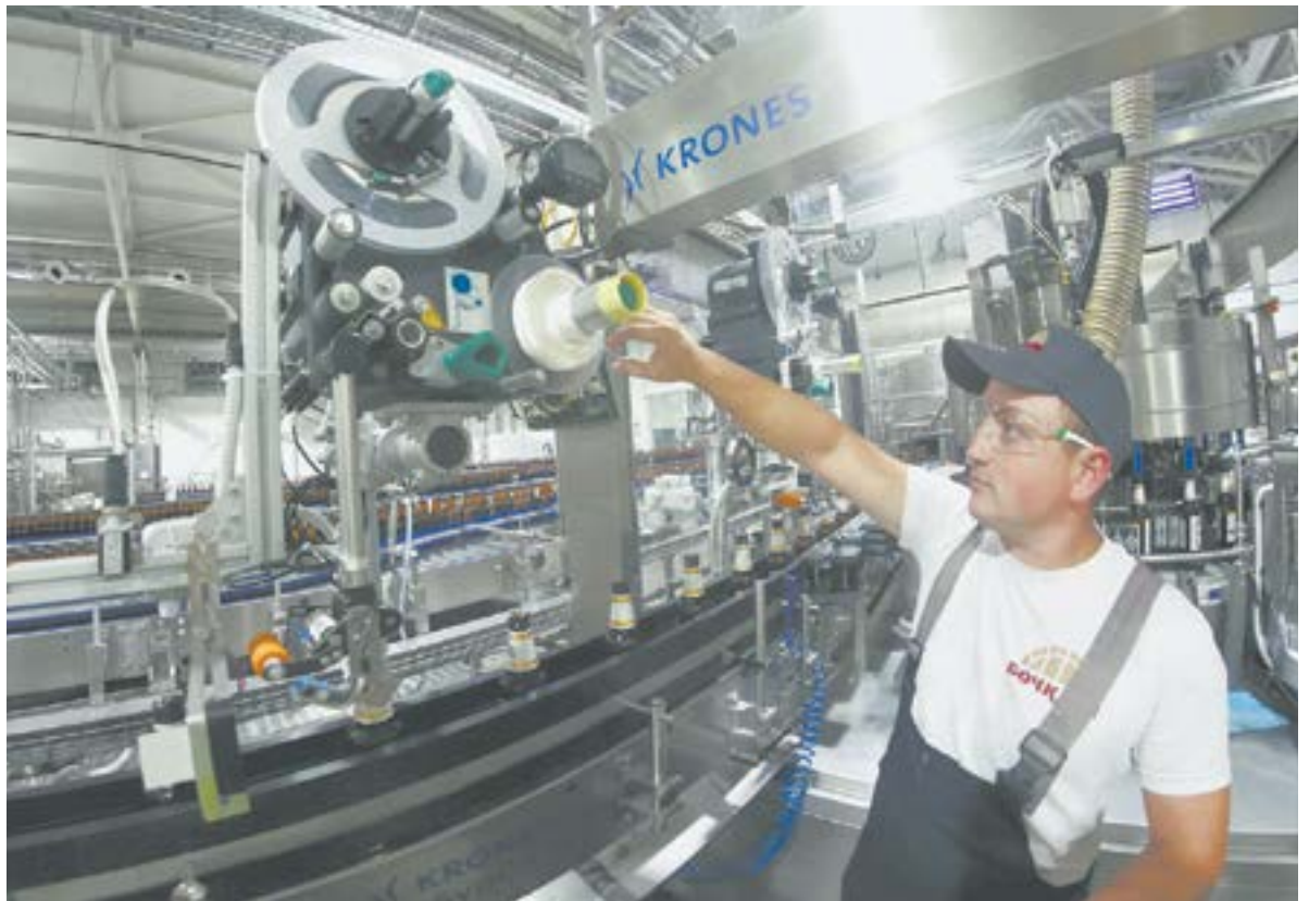
Устройство для маркировки продукции снижает производительность линии розлива.