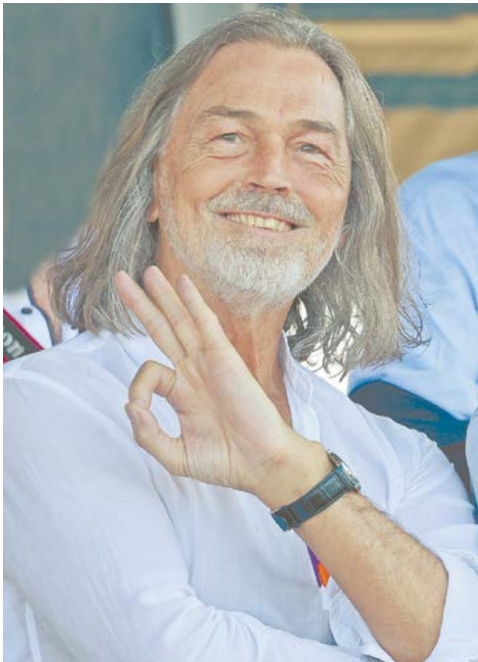
Никас Сафронов в восторге от жителей края и его природы.

– Мы все разные. Авторское кино совершенно не заточено на массовые показы в кинотеатрах.