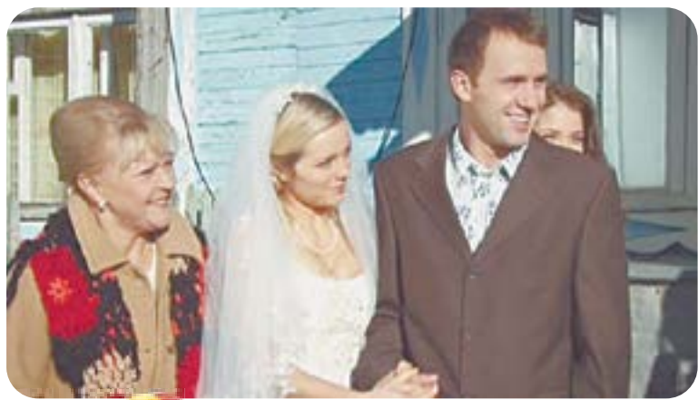
22.40 Х.ф. «БЕЛОЕ ПЛАТЬЕ» (16+)

06.30 «Библейский сюжет» 07.05 М.ф. «Мультфильмы» 08.05 Х.ф. «Второе дыхание» 10.15 Д.с. «Передвижники» 10.45 Х.ф. «Дорога к морю» 12.00 «Дом ученых» 12.30 Диалоги о животных 13.15 Д.ф. «Монолог балетмейстера». 85 лет Олегу Виноградову 14.00 Балет «Ревизор» 15.45 Д.с. «Энциклопедия загадок» 16.10 Д.с. «Мировая литература в зеркале Голливуда» 17.00 Х.ф. «Странная любовь Марты Айверс» 19.00 Д.ф. «Анастасия». 85 лет Виктору Лисаковичу 19.55 Цвет времени