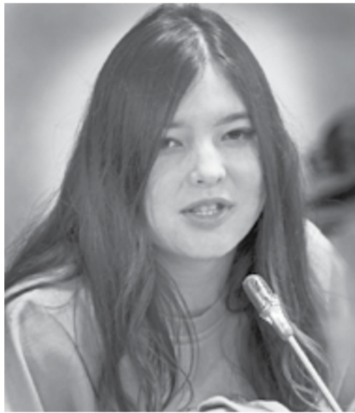
Журналистам из Казахстана понравилась на Алтае.

В первый день на алтайской земле гости приняли участие в знакомом мероприятии.