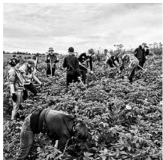
На картофельном поле работают школьники.

Уже в первые дни после проведения конкурса закипела работа. Стал возможен проезд без выезда на встречную полосу в начале ул. Советской, а в конце ул. Ленина теперь можно проехать без страха за подвеску автомобиля и свой позвоночник, с юмором передают мнение жителей журналисты газеты «Трибуна хлебороба». Сумма в 1 млн 65 тыс. рублей осваивается подрядчиком стремительно. Дорожникам даже не понадобилось 30 дней, отведенных для работ. Отремонтированы наиболее проблемные участки твердого покрытия на десятке улиц. На объектах работали три единицы техники – фреза на базе МТЗ-82, самосвал «КамАЗ», каток и шесть дорожников.