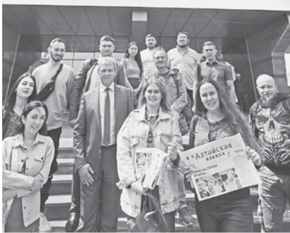
Фото на память у здания редакции.