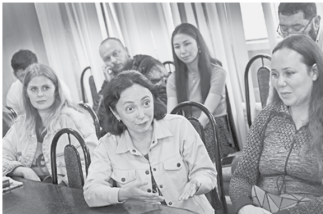
Встреча в «Алтайской правде».