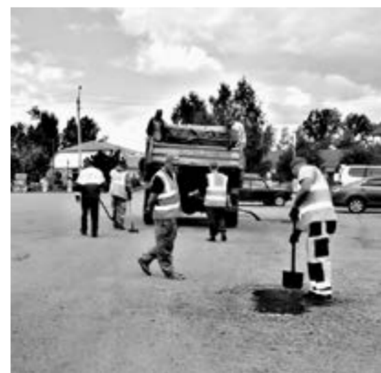
Ямочный ремонт в Панкрушинском районе.

По итогам 2021 года именно Ленковский сельсовет занял 1-е место на краевом этапе Всероссийского конкурса «Лучшая муниципальная практика». Село имеет современный, благоустроенный вид: только за последние годы на территории построена детская игровая площадка, обустроена центральная площадь, сделано освещение десяти улиц и переулков, реконструированы участки улично-дорожной сети.