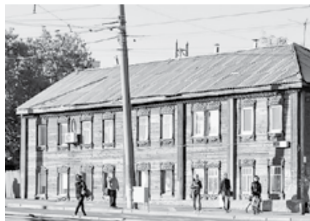
Тан выглядело здание раньше.

очисткой фасада от пыли и грязи, красил наличники на окнах, – вспоминает Глеб. – Работали пять дней в неделю, по три – пять часов со вторника по субботу.