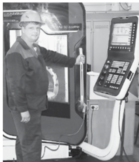
На заводе много импортного оборудования.