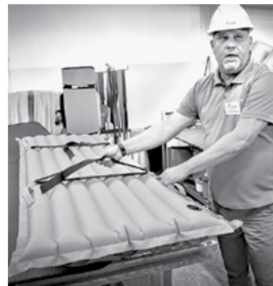
Надувные носилки – новое изделие «Тонара».

Так мы уже три шлифовальных станка обновили и сверлильный. И вместо опытного специалиста к модернизированному оборудованию можно поставить оператора, который следит за его работой.