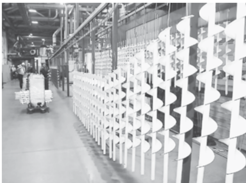
63% российского рынка ледобуров занимает продукция компании «Тонар».

«Алтайская компания «Тонар» – это один из наших лидеров в вопросах импортозамещения и модернизации оборудования», – заявил на днях министр промышленности и энергетики края Вячеслав Химочка. С этим мнением трудно не согласиться.