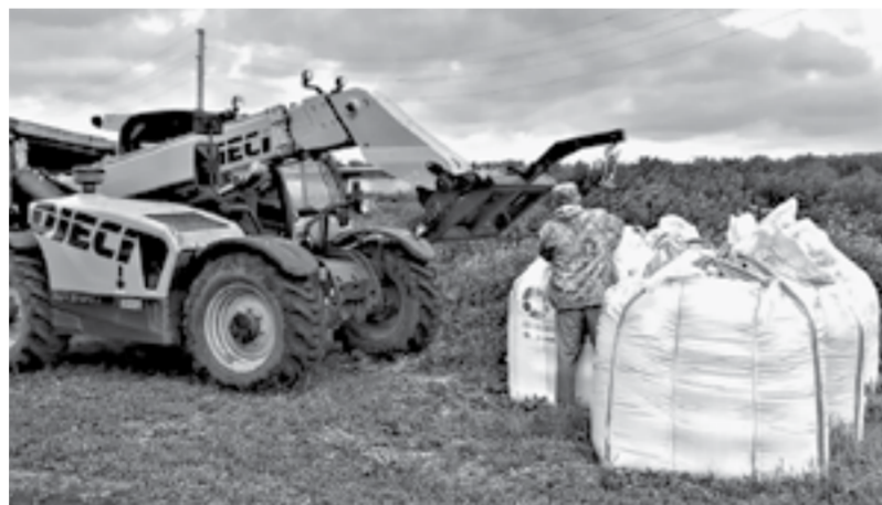
Без минеральных удобрений хорошего урожая не получишь.

Едем по полям, фермер охотно рассказывает, что и где у него растет. – Вот рожь просится на уборку, пошла желтеть. В конце июля уберем. А там вот дальше «влада» – хороший сорт озимой пшеницы, урожайность высокая. Вообще,