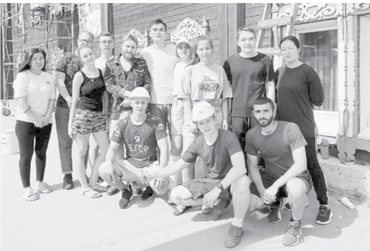
В рядах добровольцев – равнодушные горожане.

– Я принял участие в акции как представитель Молодежного правительства края. Занимался