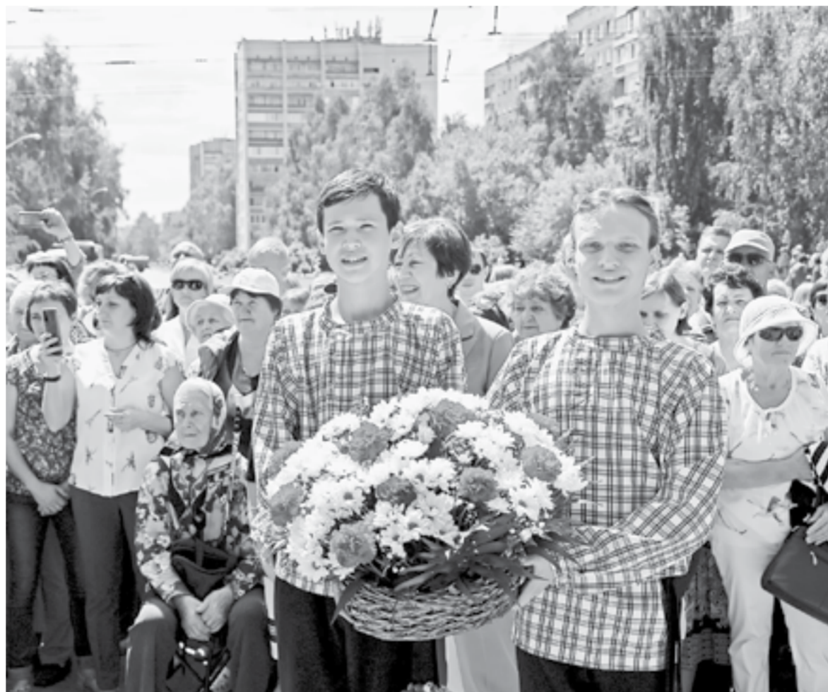
У памятника Василию Манаровичу Шукшину.