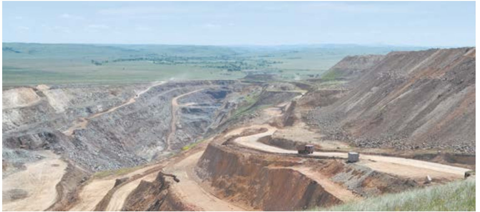
На Мурзинском месторождении.