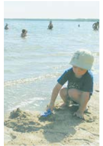
На берегу оживленно и днем, и вечером.

Несколько лет не была в Яровом как отдыхающий. Удивилась: туристический бизнес заметно развился. Идешь по улицам – и сплошь на заборах: «Сдается». Туристов завлекают свежеремонтными комнатками и квартирами, уютными беседками, баней, обустроенными зонами барбекю, небольшими бассейнами на подворье. «Люди готовы жить в гаражах и на дачах, а свое жилье сдавать туристам – надо ловить сезон, пока есть возможность заработать», – улыбается горничная гостевого дома, где мы остановились на несколько дней. Тут целый городок из двухэтажных бревенчатых строений, расположенных по периметру. В центре – зеленый дворик, мощный тротуарной плиткой, с красивыми фонарями и коваными скамеечками. Есть общая кухня с плитой, кастрюлями-сковородами и