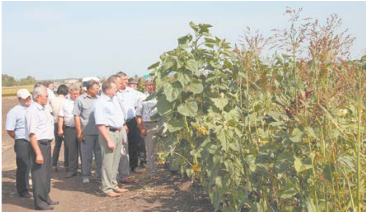
Успехи алтайских селекционеров.