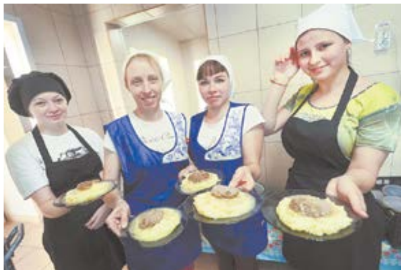
Учащиеся Ребрихинского профлиция проходят практику в столовой «Победы».

лись, что с их помощью можно контролировать все процессы производства.