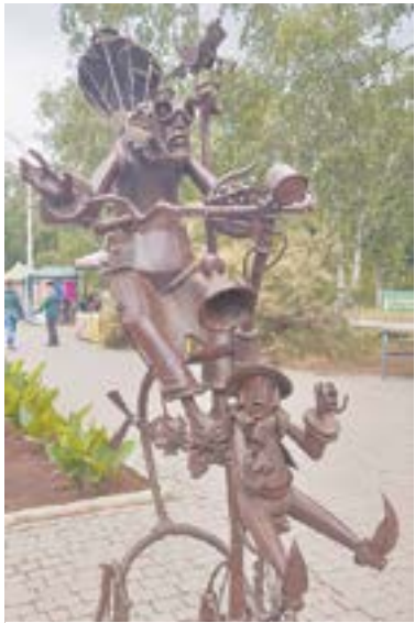
Металлические фигурки вызывают восторг.

«Слушай, да здесь как в Сочи, на море», – девушка в купальнике и шляпе восторженно позирует подруге у кромки соленой воды. Волны качают плавающих лицом вверх – иначе сложно, вода прямо выталкивает наверх поплавком. С мостика спасателей то и дело доносятся оберегающие советы, впрочем, вполне доброжелательно; в маленьком ярко-оранжевом песочке копошится детвора, тут и там по пляжу снуют продавцы вареной кукурузы и глазированных яблок. Ну, привет тебе, Большое Яровое!