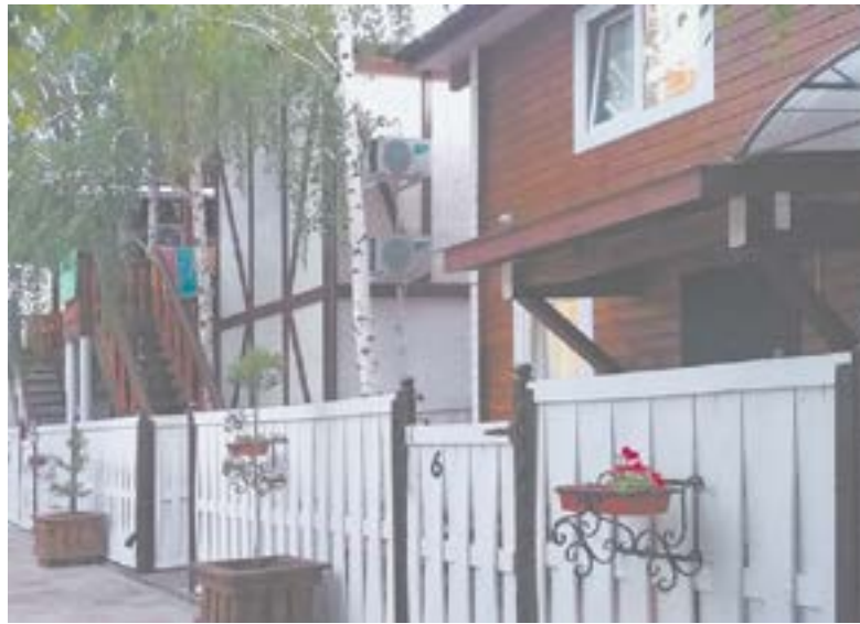
Гостевые домики на любой вкус.