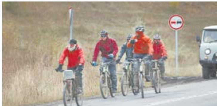
Туры на велосипедах набирают популярность.

Для бесплатной рыбалки рекомендуют бассейны рек Оби, Бии, Катуня и Чарыш, озеро Хвощевое (Усть-Пристанский район), озеро Уткуль (Зональный район), Гилёвское водо-