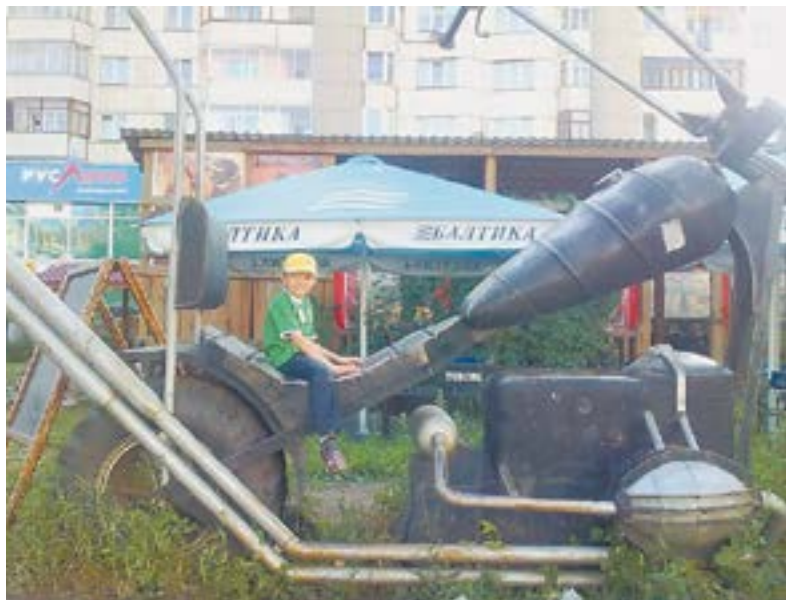
Долгие годы это было популярное место для фотографий.