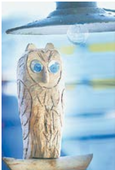
Совунья, добрый дух усадьбы.

представляете, как сложно было решиться на возвращение в родную деревню. Я много раз писал заявление об увольнении с автопредприятия, где работал, потом передумывал, рвал его, и снова