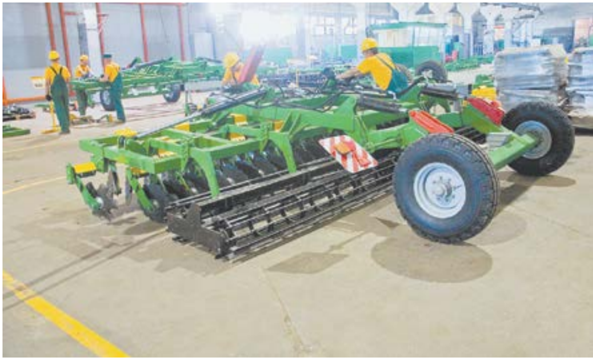
Продукция алтайских сельхозмашиностроителей под торговой маркой Veles пользуется спросом в некоторых странах.

Эмираты позиционируют себя как хаб для международ-