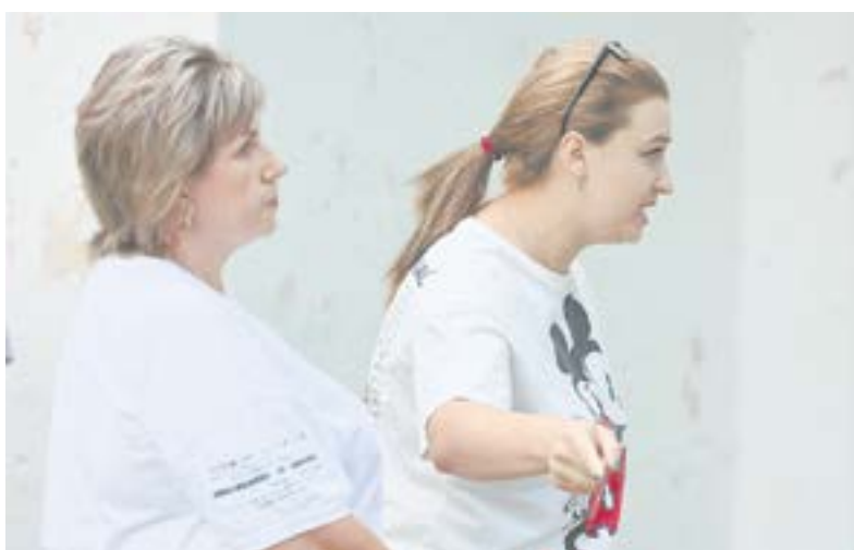
Не все в селе считают его героем.