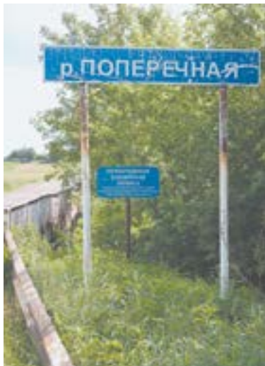
В этом месте едва не случилась трагедия.