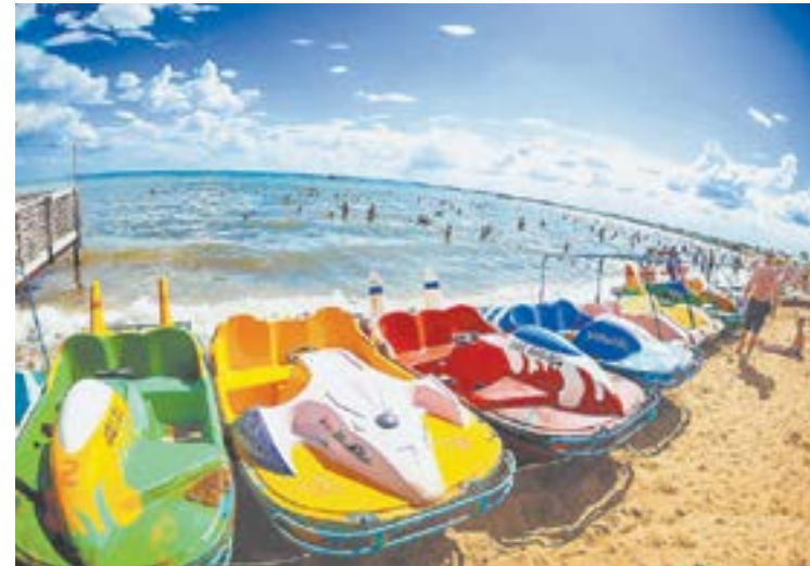
Большое Яровое: и красиво, и полезно.

Степной Алтай, а именно курорт Яровое, издавна славится своей целебной атмосферой. Люди сюда приезжают на протяжении всего года, чтобы поправить здоровье, отдохнуть душой и телом, получить самые яркие и незабываемые впечатления.