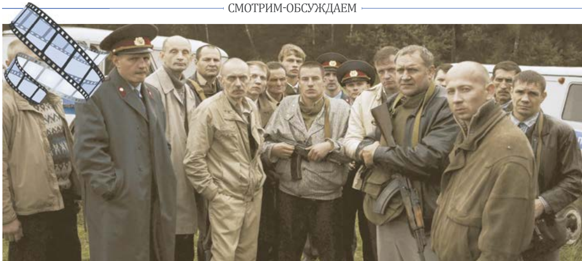
Кадр из фильма «Казнь».