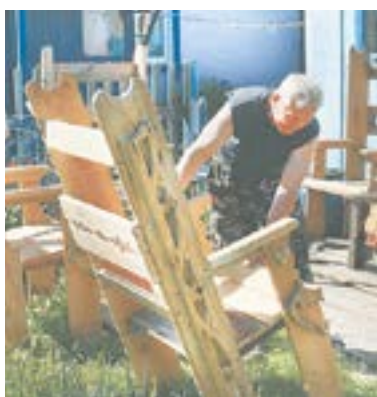
Троны для принцесс семьи Анисимовых.