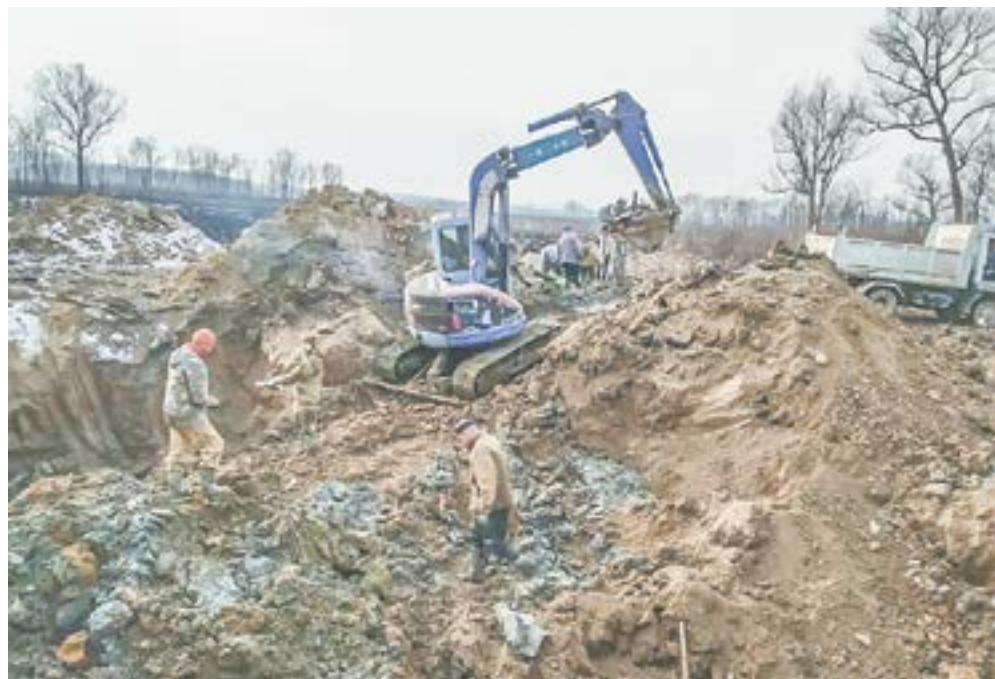
Экскаватор на месте подъема самолета.

В отвесном пикировании, с воющими двигателями Ту-4 врезался в болото. Удар был таким сильным, что хвост самолета отбросило на 70 метров от места падения, а один из моторов ушел на глубину свыше 6 метров. Кстати, он и позволил много лет спустя расшифровать судьбу самолета: номер двигателя – как паспорт для человека, сразу дает всю информацию о воздушном судне. Два дня горели обломки бомбардировщика... Представители части прибыли на место катастрофы, забрали оставшихся в живых летчиков и... уехали.