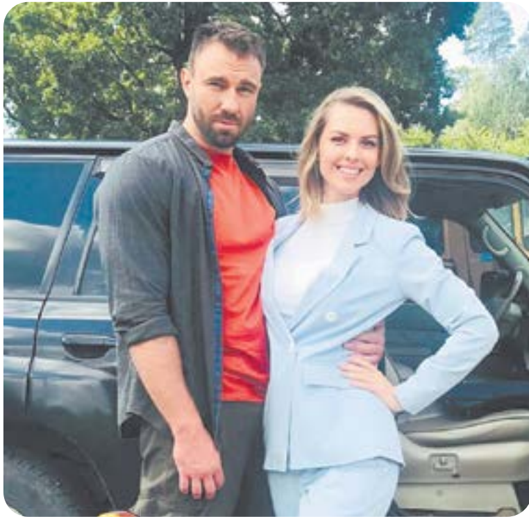
19.00 Х.ф. «О ЧЕМ НЕ РАССКАЖЕТ РЕКА» (16+)

04.55 Т.с. «Улицы разбитых фонарей» (16+) 06.30 «Утро. Самое лучшее» (16+) 08.00 «Сегодня» 08.25 «Научные расследования Сергея Малоземова» (12+) 09.25 Т.с. «Морские дьяволы. Смерч. Судьбы» (16+) 10.00 «Сегодня» 10.35 Т.с. «Морские дьяволы. Смерч. Судьбы» (16+) 13.00 «Сегодня» 13.25 «Чрезвычайное происшествие» 14.00 «Место встречи» (16+) 16.00 «Сегодня» 16.50 «За гранью» (16+) 17.50 «ДНК» (16+) 19.00 «Сегодня»