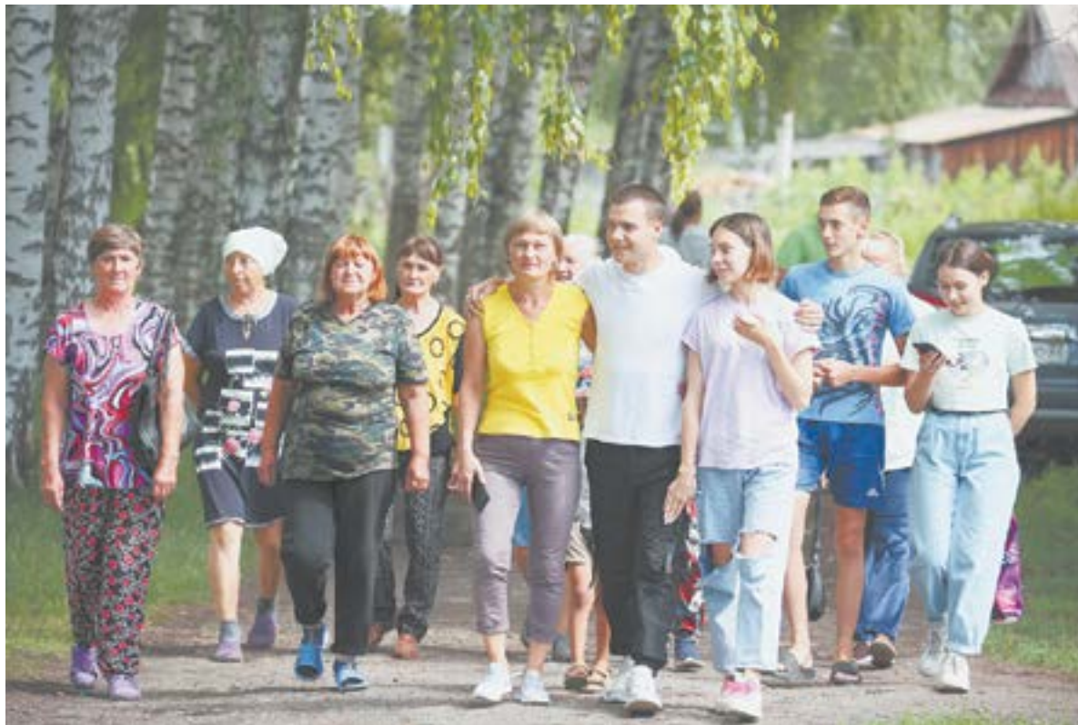
... и его группа поддержки.