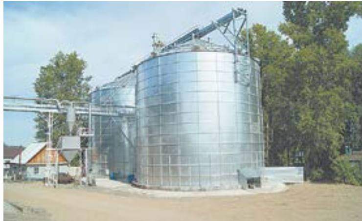
Зернохранилище «Мис, С».