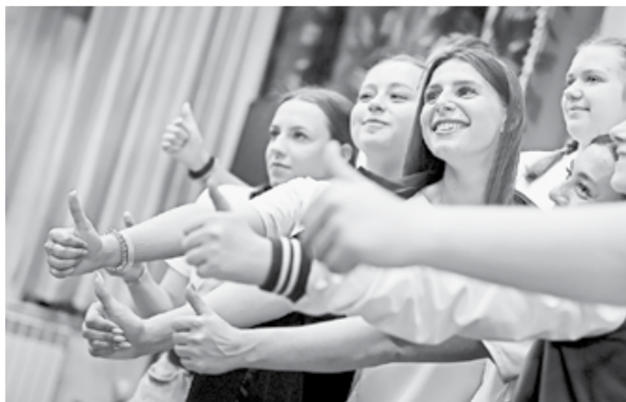
Подобный обмен опытом прошел в регионе впервые.