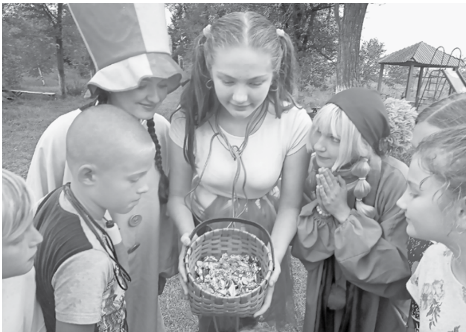
У тех, кто снимался в «Печках-лавочках», подрастают талантливые внуки.

Иное дело – деревенское приволье. Пусть и приходится детям потрудиться на сельском подворье, но и отдохнуть им есть где. Вот пираты большой командой проходят препятствия и находят клад... Девочки собираются, чтобы научиться плести венки из полевых цветов... На дискотеку приглашают самых маленьких – от 3 до 9 лет! Девочки и мальчишки разучивают «Танец маленьких утят», «Летку-енку». Танцуют не только под современные хиты российской эстрады, но и знакомятся с мелодиями, под которые танцевали их бабушки. Причем и «волшебные» конфеты получают за участие в веселых танцевальных конкурсах все без исключения! Вот как организуют досуг сельской ребятни в КДЦ села Шульгин Лог. Художественный руко-