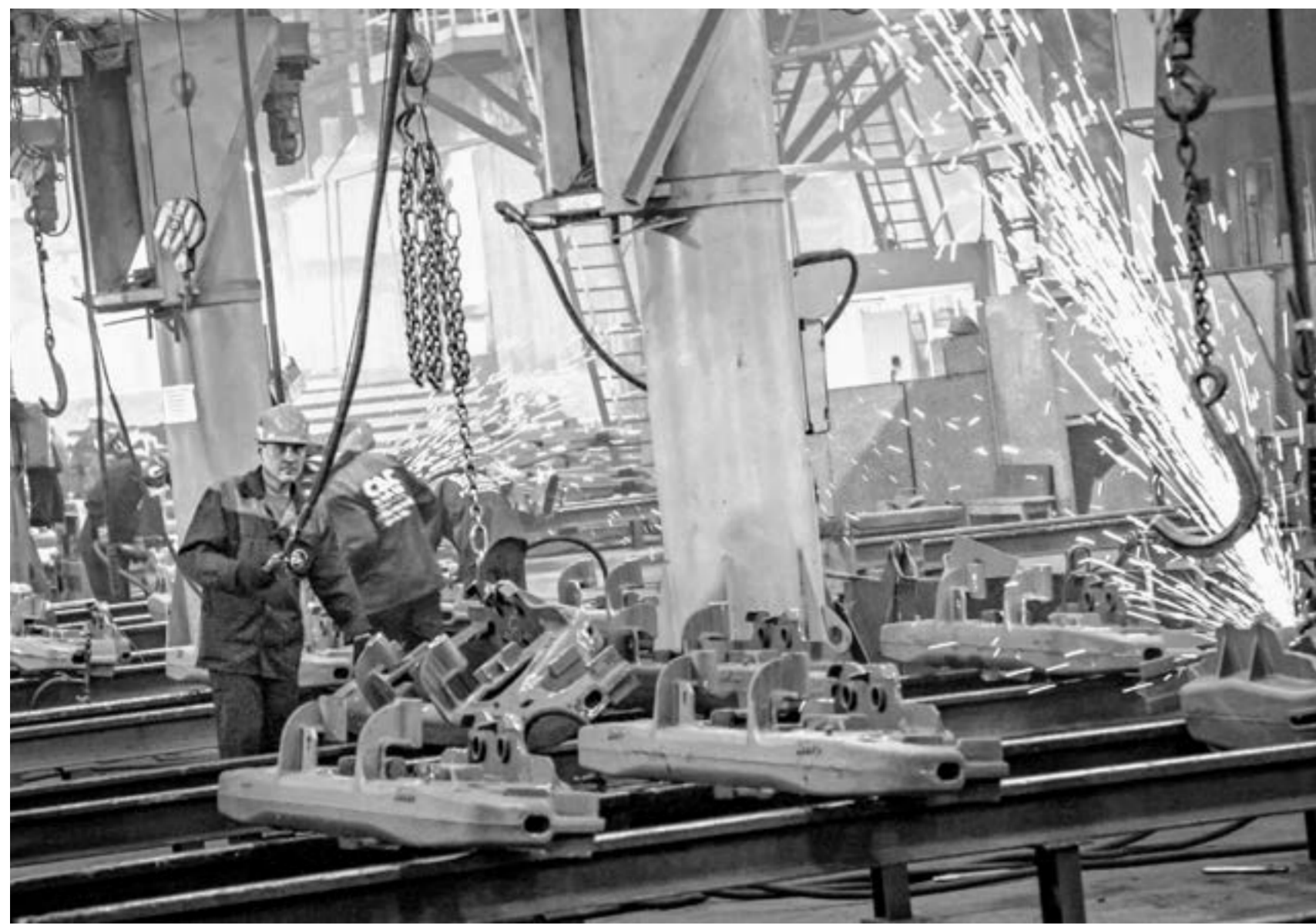
Алтайская промышленность сохраняет устойчивость.

Даже в условиях санкционного давления Запада алтайская промышленность наращивает объемы производства.