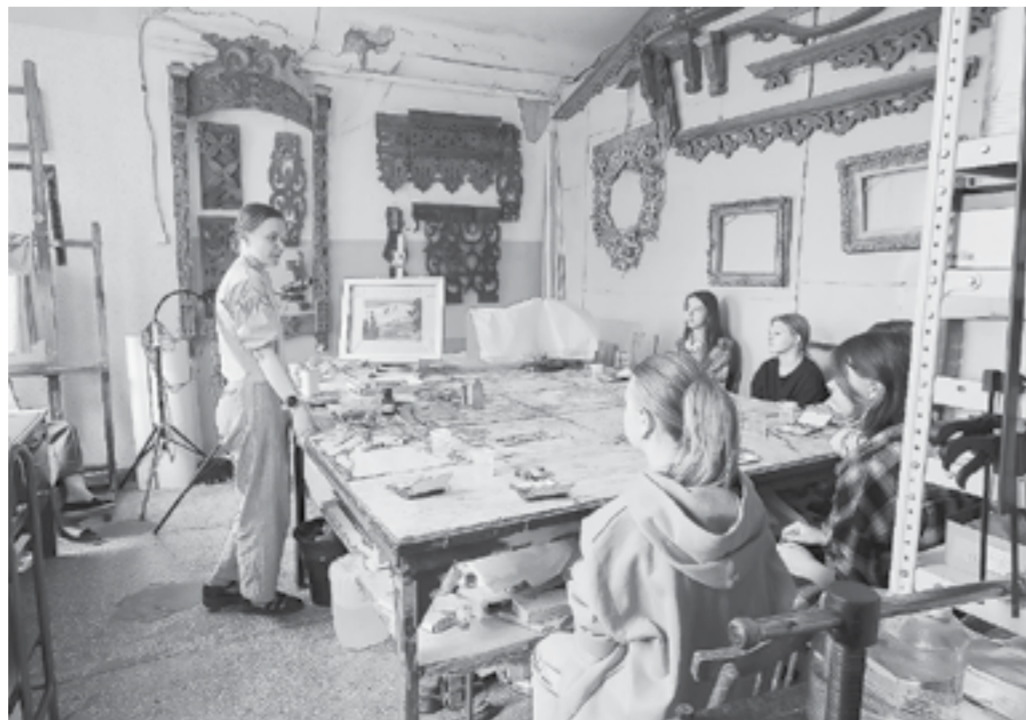
Знакомство с профессией реставратора.