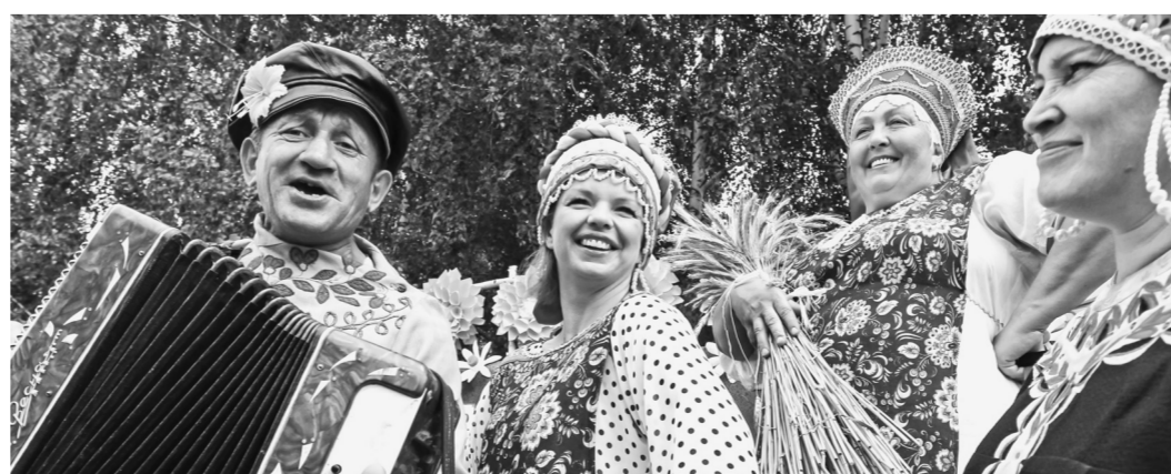
Гостей ждут веселые гулянья.