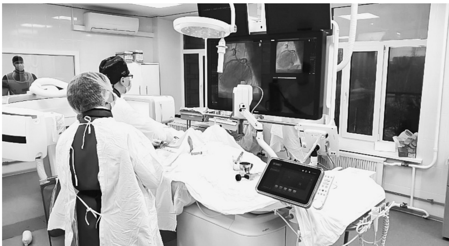
В кардиодиспансере есть все необходимое для проведения сложных операций.

Для повышения качества хирургических вмешательств в кардиологическом диспансере есть все необходимое: специалисты высокого класса и современное оборудование.