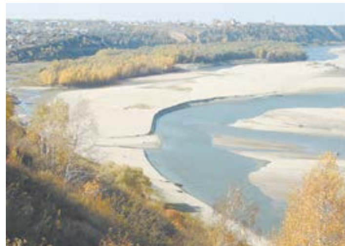
Обские просторы райцентра напоминают гигантскую чайку.

Рыба в Оби есть. Хорошо клюет чебак и подлещик, реже – щука и судак. Так что точите крючки!