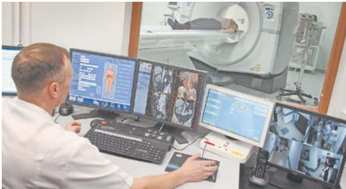
Госструктуры уже не зависят от иностранного ПО.

– Сейчас эта ситуация стабилизировалась и начался процесс возврата. Да, уехало немало специалистов, но отношение, которое они встретили в других странах, не всех устроило. Айтишник с зарплатой 300–400 тысяч может жить поч-