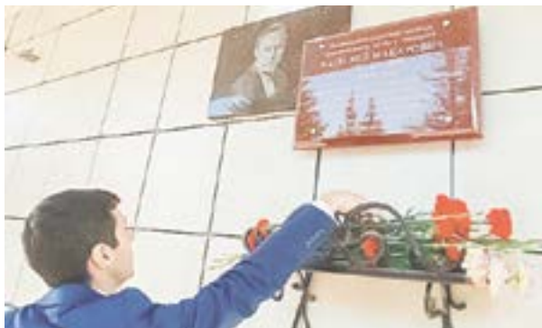
Мемориальная доска на проходной КТЗ.