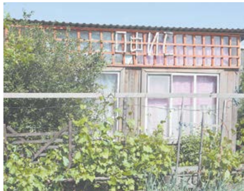
Когда живешь и работаешь дома.