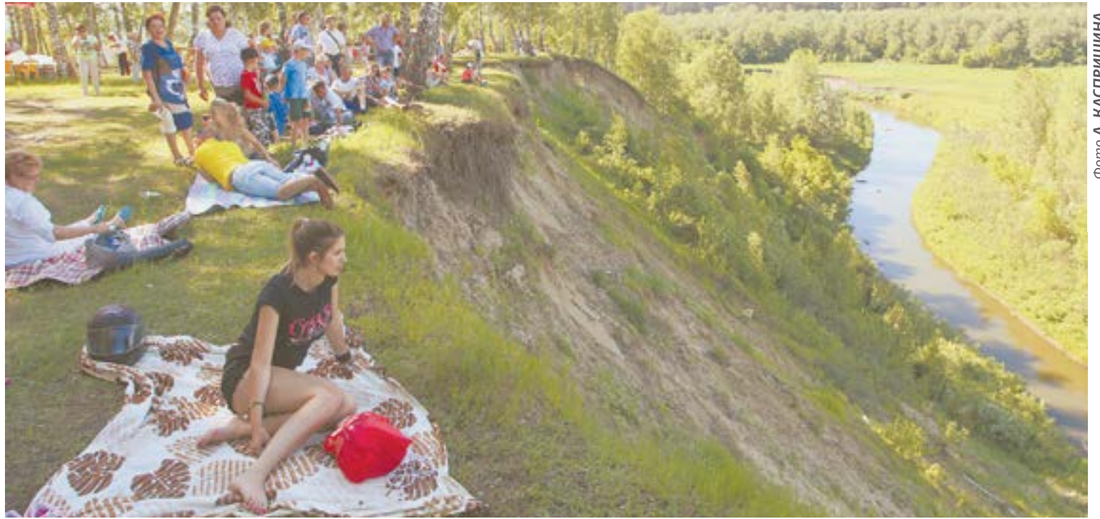
Фестиваль памяти Роберта Рождественского в Косихе по традиции собирает много гостей.