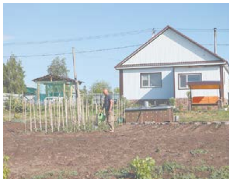
Свой новый дом на улице Боровой семья поставила за 2 месяца.