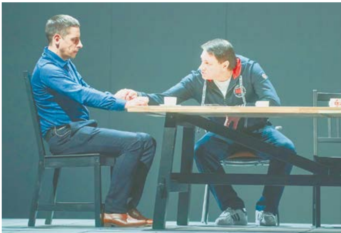
Спектакль «Дикая утка» театра «Красный факел».

Жанр спектакля «Генерал и его семья» в театре «Глобус» опреде-