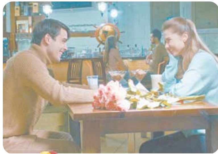
19.00 Х.ф. «Хрустальная мечта» (16+)

05.00 Т.с. «Улицы разбитых фонарей» (16+) 06.30 «Утро. Самое лучшее» (16+) 08.00 «Сегодня» 08.25 Д.с. «Мои университеты. Будущее за настоящим» (6+)