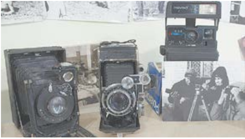
Фотоаппараты разных эпох.