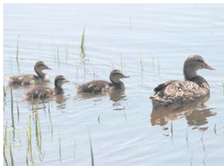
Осторожным уткам комфортно на тихом берегу, рядом с усадьбой.