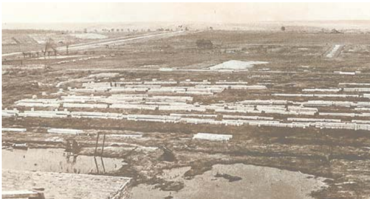
Строительство корпуса турбомеханизмов. 1947 год.