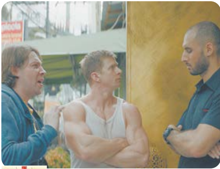
Х.ф. «Гуляй, Вася! Свидание на Бали» (16+)

04.55 Т.с. «Улицы разбитых фонарей» (16+) 06.30 «Утро. Самое лучшее» (16+) 08.00 «Сегодня» 08.25 Д.с. «Мои университеты. Будущее за настоящим» (6+) 09.25 Т.с. «Морские дьяволы. Смерч. Судьбы» (16+) 10.00 «Сегодня» 10.35 Т.с. «Морские дьяволы. Смерч. Судьбы» (16+) 13.00 «Сегодня» 13.25 «Чрезвычайное происшествие» 14.00 «Место встречи» (16+) 16.00 «Сегодня» 16.45 «За гранью» (16+) 17.50 «ДНК» (16+) 19.00 «Сегодня» 20.00 Т.с. «Степные волки» (16+) 21.45 Т.с. «Пересуд» (16+)