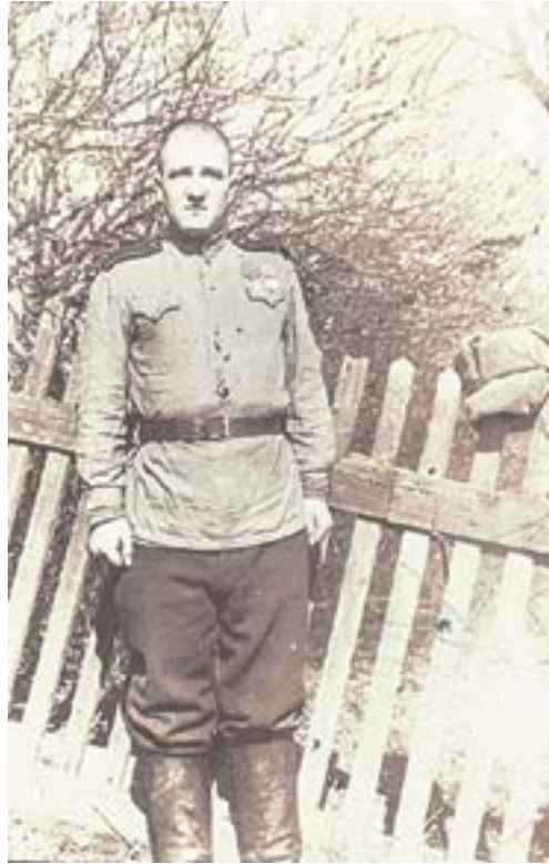
Весна 1945 года.