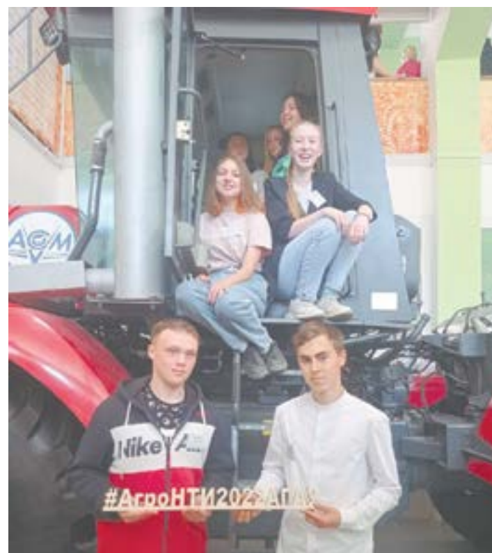
Интерес к сельским профессиям – с юности.