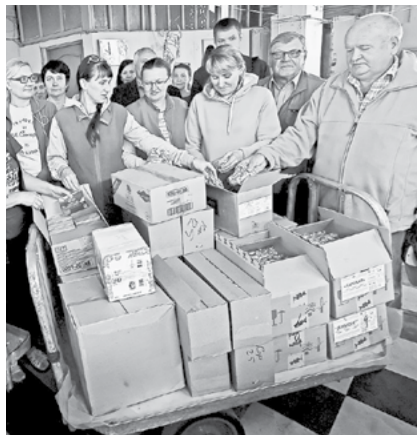
Гуманитарная помощь для военнослужащих.