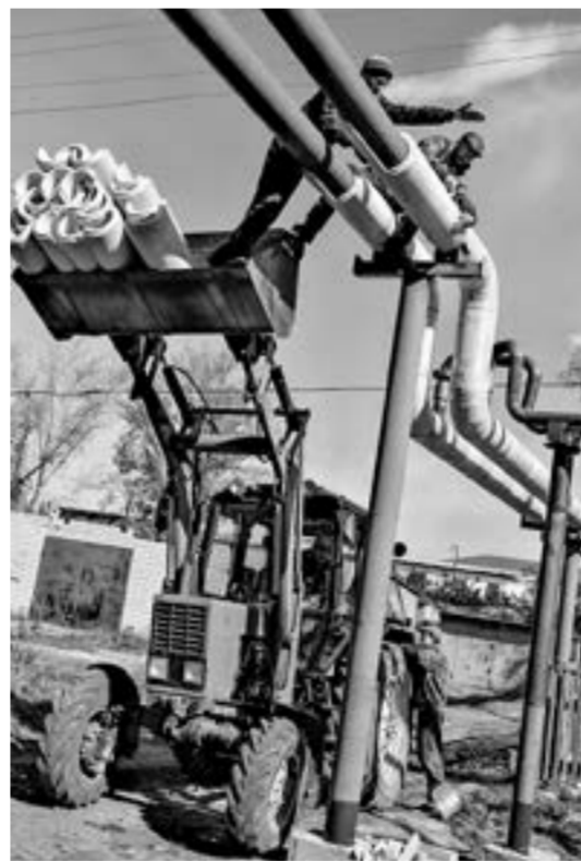
В Солтонском районе обновили половину теплосетей.

Также в этом году в райцентре Солтона капитально отремонтируют центральную водозаборную скважину. Все необходимые