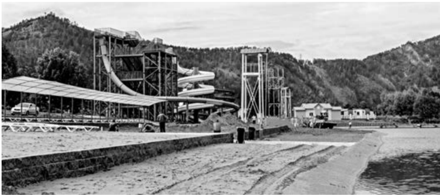
Рабочие спешили в срок закончить объект.

Показывая на обновленный пляж, гендиректор туристско-рекреационной зоны говорит, что песок привезли из русла реки Обь. В нем очень мало глины, по нему приятно ходить. Докупили шезлонгов. Теперь на лежаках могут загорать сразу 900 человек. Сделали прозрачные навесы от солнца на протяжении 160 метров берега. Дополнительно разместили восемь кабин для переодевания и душевые, сформировали единую площадку для пляжных торгов. Предприниматели, работающие на территории зоны, приготовили для своих клиентов различные развлекательные и туристические программы.