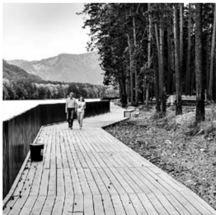
На «Бирюзовой Катунь» появилась набережная.

В настоящее время в разной степени реализации своих инвестпроектов находится с десяток резидентов, и к уже