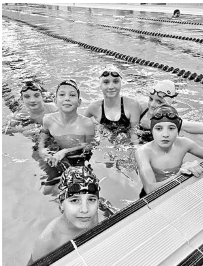
В бассейн – за уверенностью, здоровьем, интеллектом.

с ранних лет, у него и осанка хорошая, и память замечательная. Я заметила, что все наши плавающие дети хорошо учатся, несмотря на то, что им приходится пропускать уроки в связи с поездками на соревнования. Этот факт можно связать как с гармоничным развитием спортсменов, так и с тем, что постоянные тренировки принципе дисциплинируют человека.