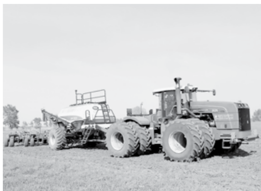
Посевные работы прошли в оптимальные сроки.