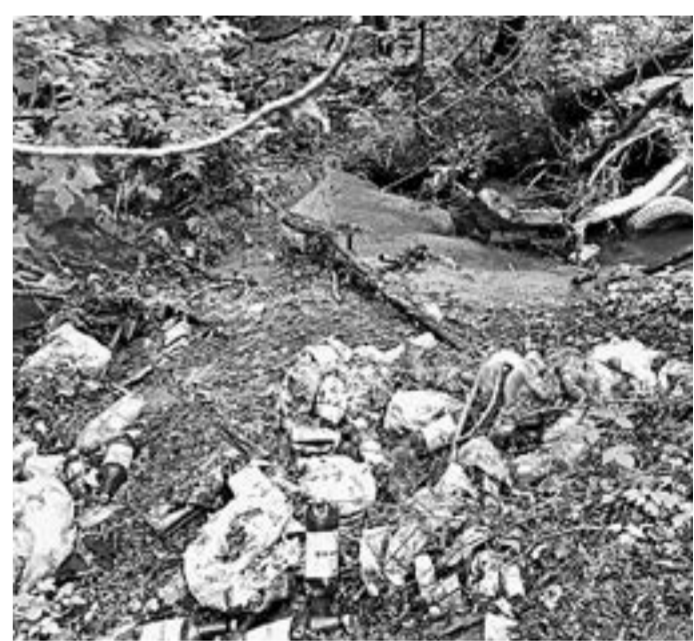
Горы бутылок, бытовых отходов и даже части автомобиля на берегу озера на Гуцина.

Активистка призвала участкового и других ответ-