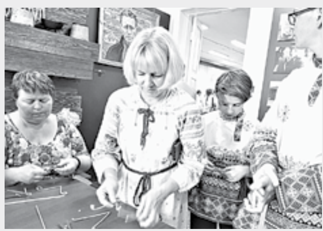
Под взглядом Шукшина.

Людмила КАЗАНЦЕВА.