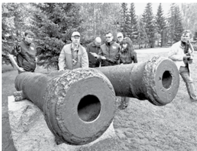
У памятного знака «Пушки Бийской крепости».