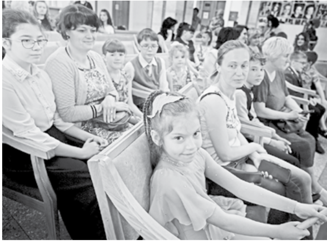
Юные лауреаты готовятся к выступлениям.