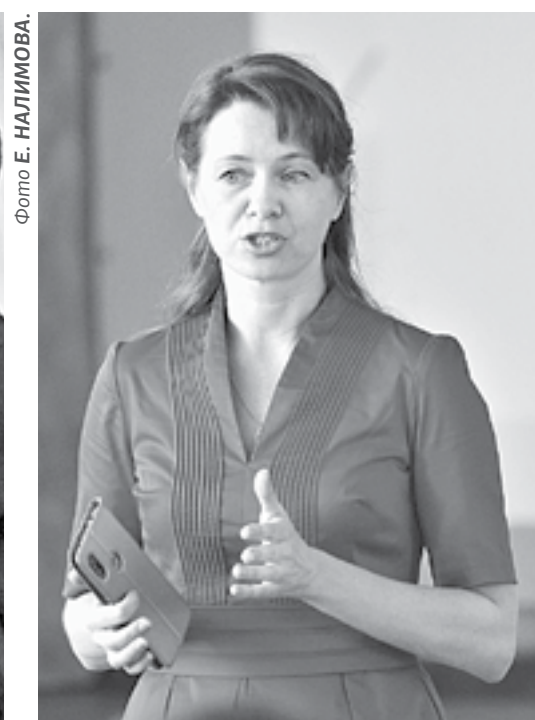
В открытом уроке приняли участие артисты ансамбля «Алтай».