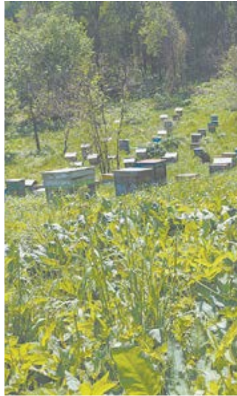
Пасека находится в 20 км от Солтона.