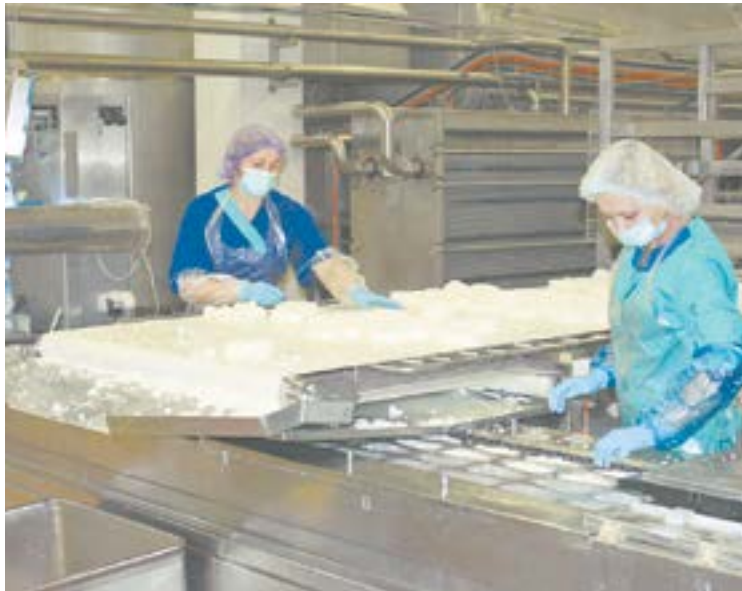
На предприятии «Алтайская бурёнка».