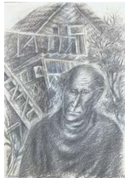
«Хозяин дома» (1976).