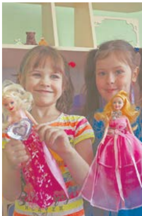
(Начало на 1 стр.)