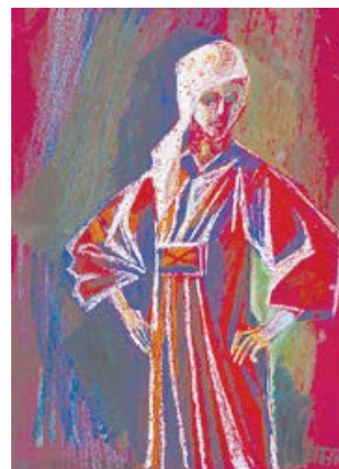
«Автопортрет в красном платье» (1977).