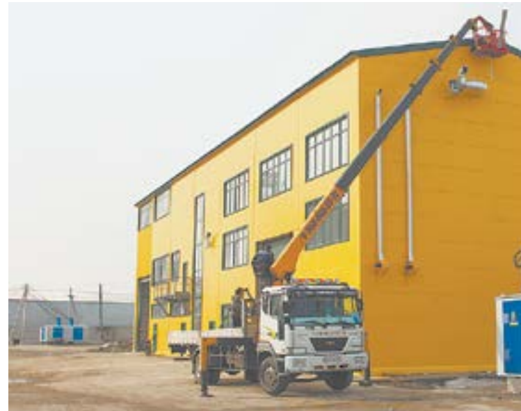
Новый зерноочистительный комплекс ООО «Октябрьское».