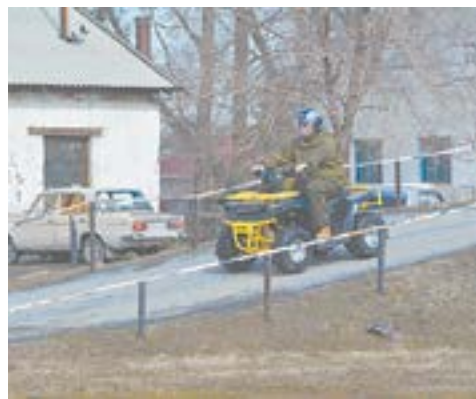
Вожделение на квадроцикле.