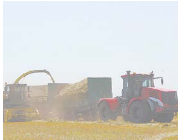
Коротоякский элеватор и сельхозпредприятия территории – основа экономики района.

Основное направление экономики района – сельское хозяйство. Здесь производят зерно, подсолнечник, молоко, мясо.