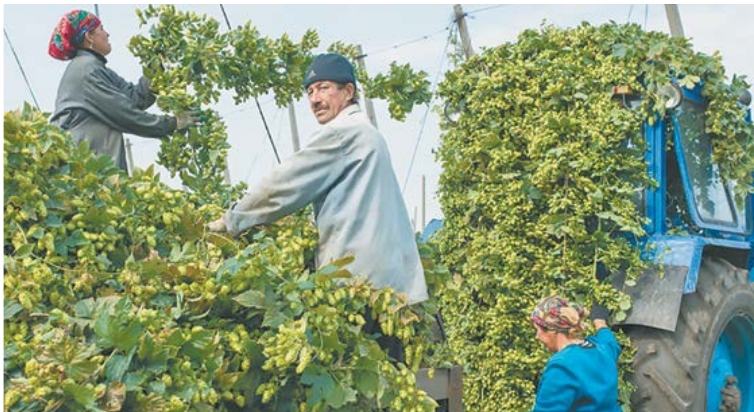
Сбор хмеля в Чувашии.

Ожидается, что в сентябре можно будет собрать первый, пока очень небольшой урожай шишек. Но в течение восьми лет он будет расти, а потом снижаться, так как к нему цепляются болезни. Так что хмель-