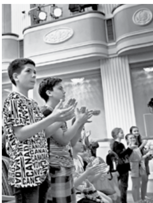
Первые зрители на генеральной репетиции.

На сей раз несколько архаичный сюжет Юрия Олеши Павлу Пронину пришлось адаптировать не только для современно-