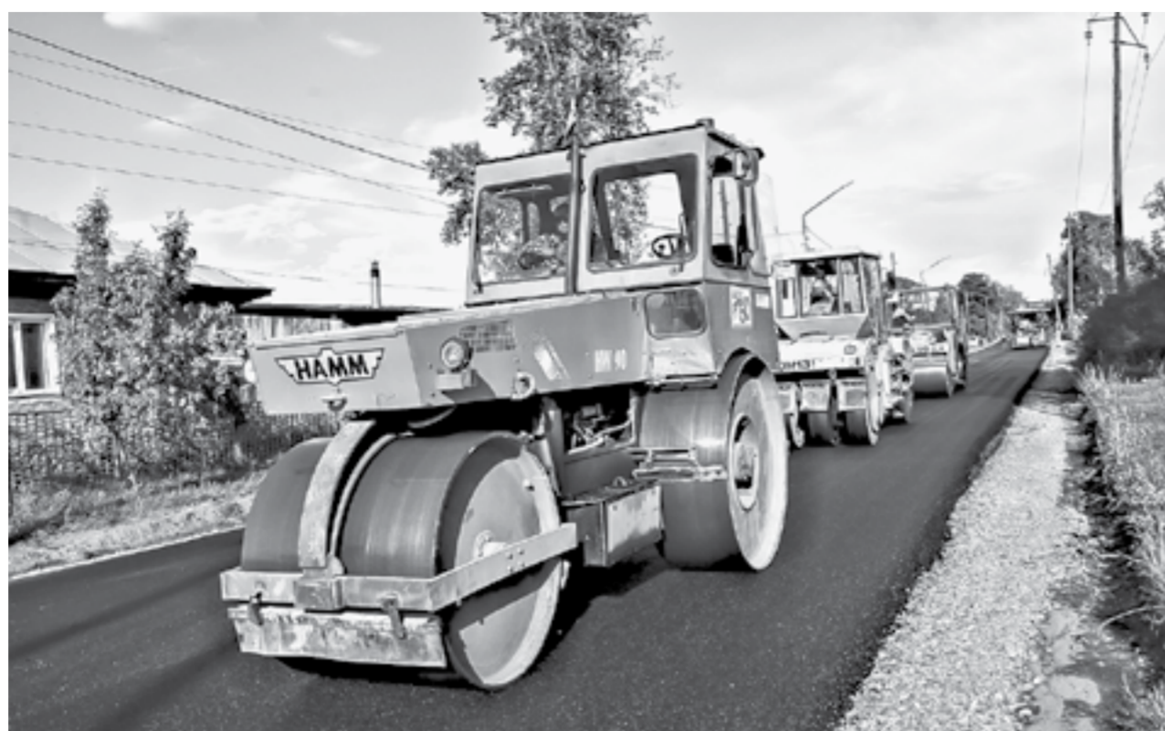
Большое внимание было уделено проверке использования средств муниципальных дорожных фондов.

Мы обратили внимание на то, что в Барнауле сложилась практика, когда жилье для переселяемых