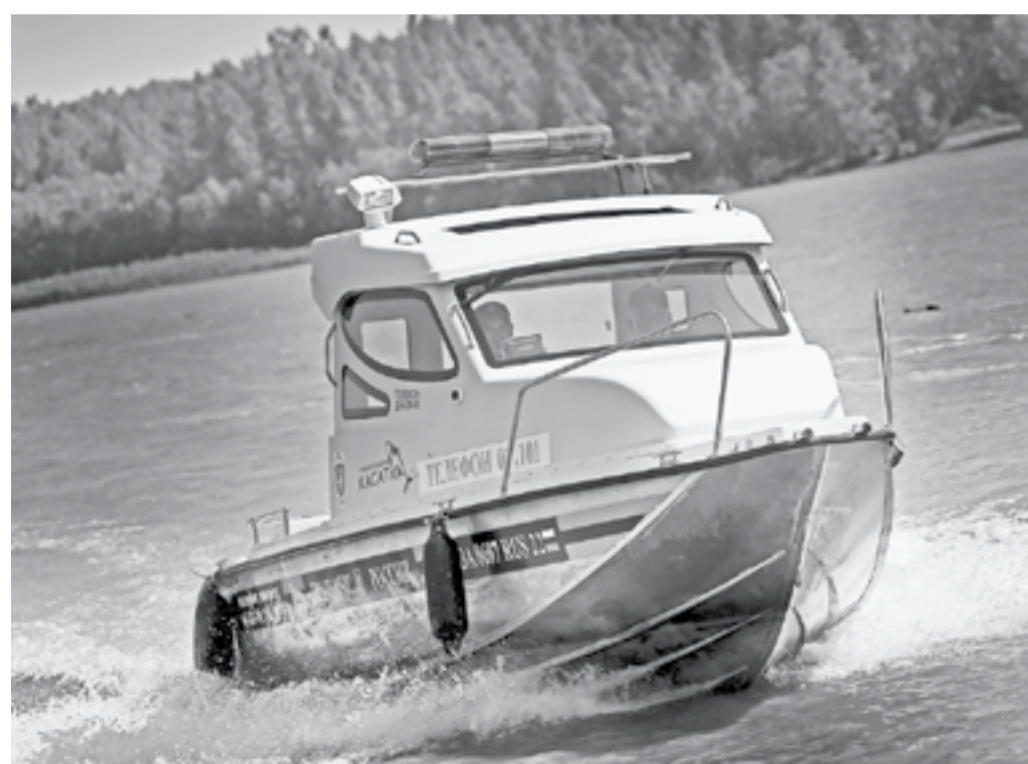
Катер ГИМС спешит к месту «крушения».