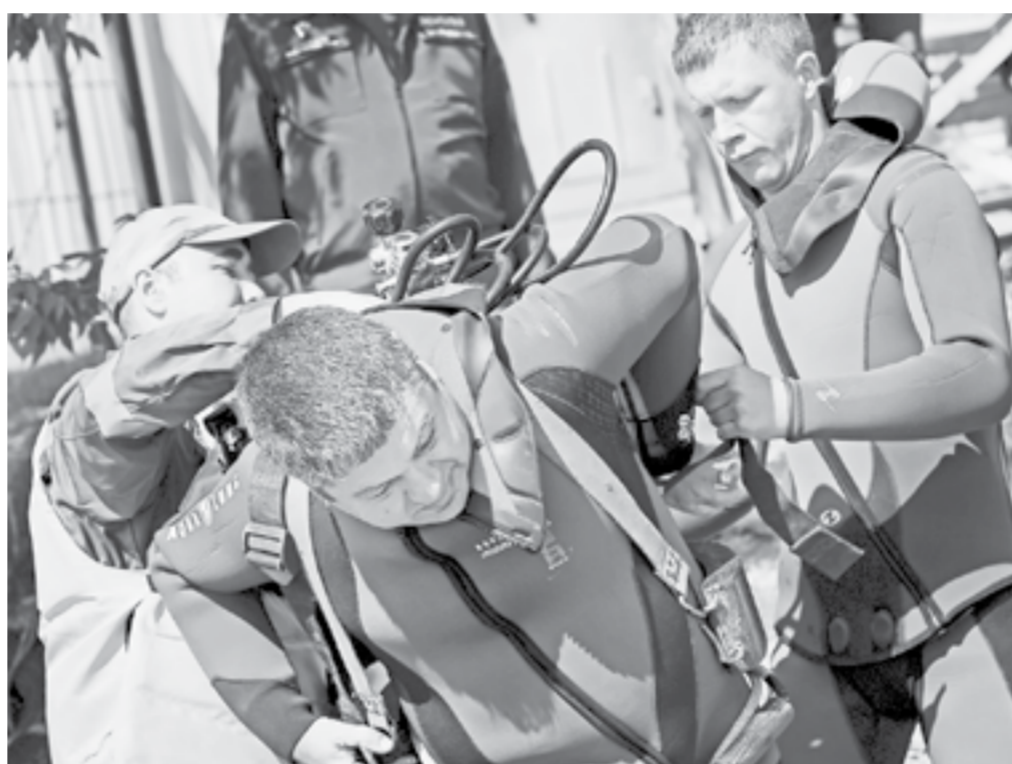
Водолазы готовятся к погружению.