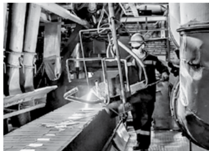
В цехах «Литкома» кипит работа.

Не оставляют без внимания и сувенирную продукцию. Особой прибылью от нее не ждут, но это своего рода визитная карточка предприятия. Сувениры от «Литкома» неоднократно завоевывали медали.