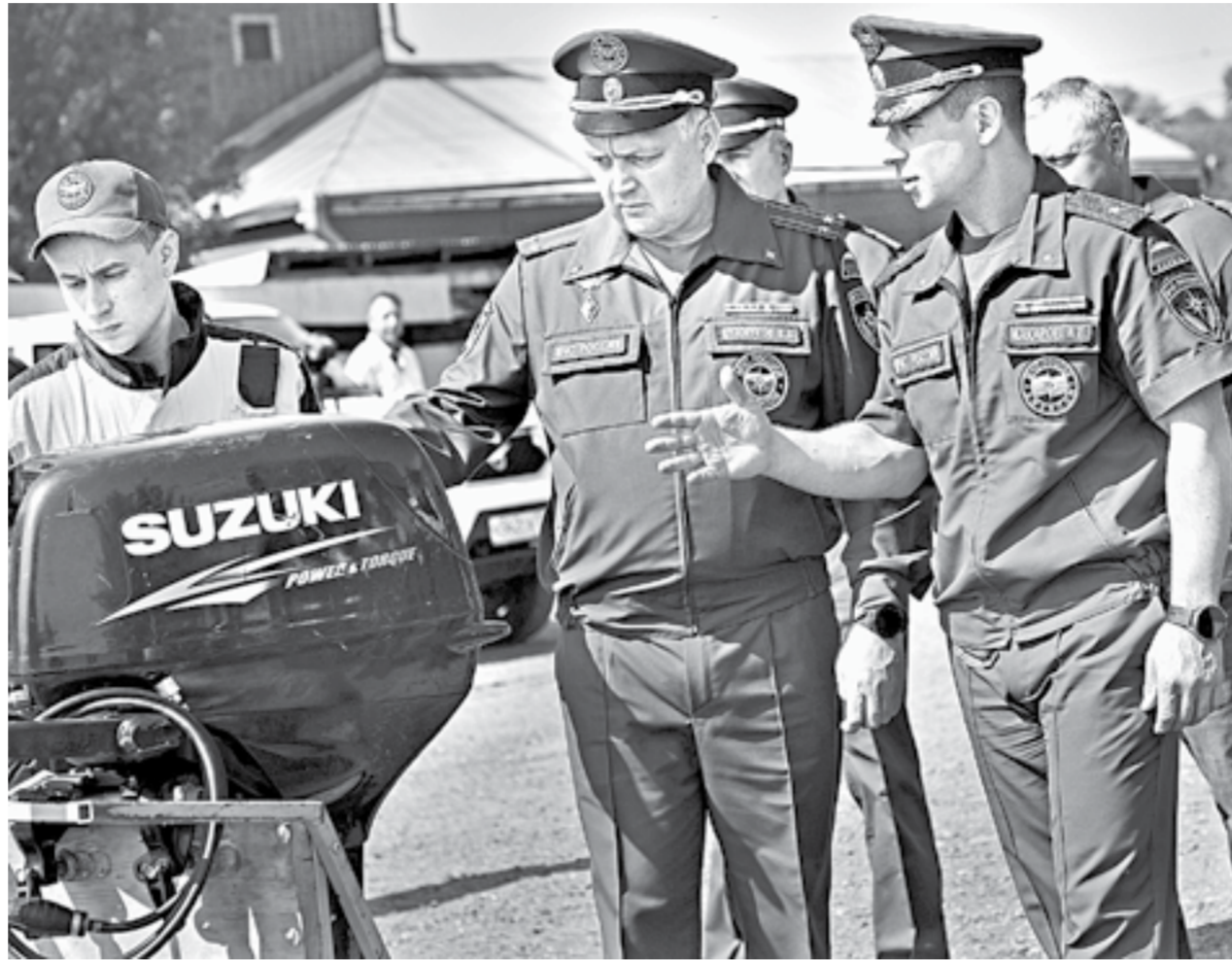
Начальник ГУ МЧС России по краю Александр Макаров: «Учения прошли успешно».