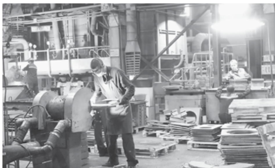
В цехах «Литкома» кипит работа.