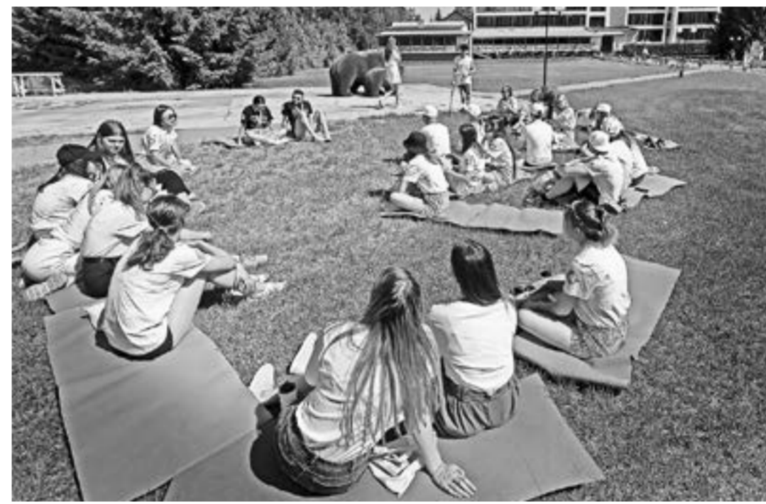
Работа на одной из площадок.

максимальный охват активных и заинтересованных молодых людей. В том числе для достижения этих целей создана платформа «Россия – страна возможностей» с ее многообразными проектами.