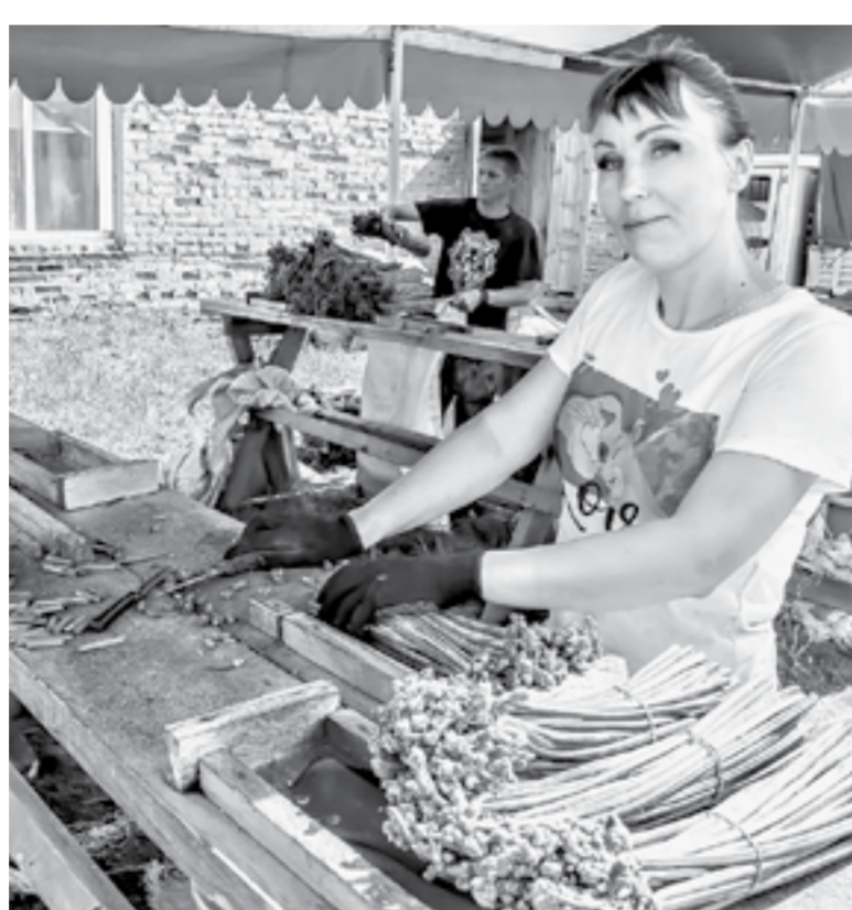
Побег необходимо засолить в течение трех часов после среза.