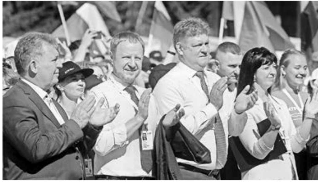
Гости молодежного форума.