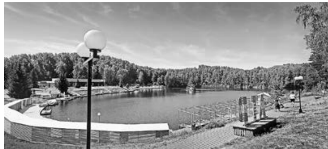
Прекрасные виды озера Ая вдохновляют.

По его оценке, реализуемые мероприятия нацелены на