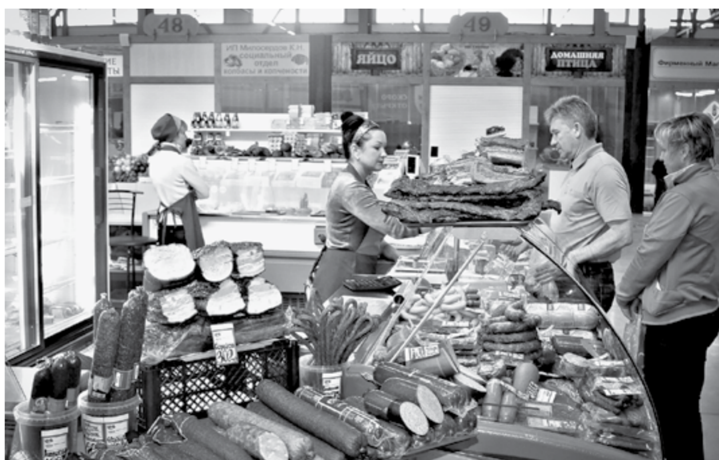
Почти половина алтайских предпринимателей работает в сфере торговли.