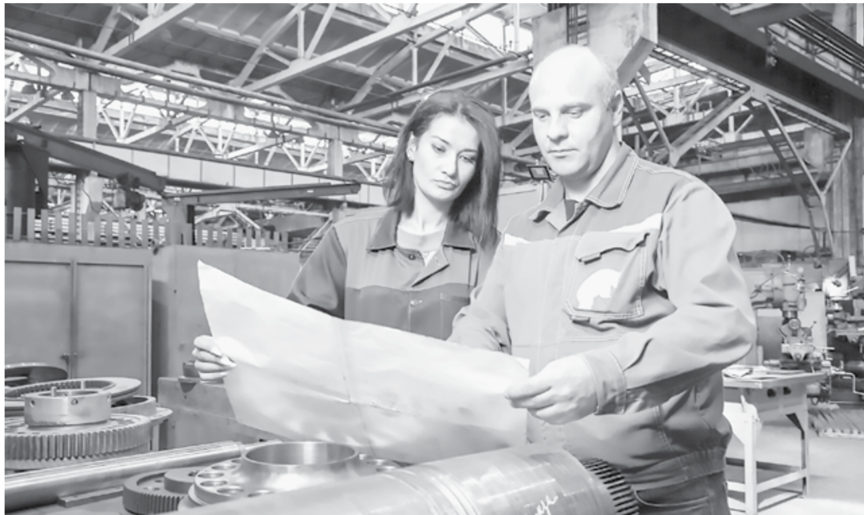
Промышленные предприятия края работают в штатном режиме.

По общей оценке участников заседания, ситуация в экономике региона характеризуется как стабильная. Аграрии края обеспечены всеми необходимыми ресурсами для проведения весенних полевых работ. Предприятия пищевой и перерабатывающей промышленности работают в штатном режиме. Остановки производства и сокраще-