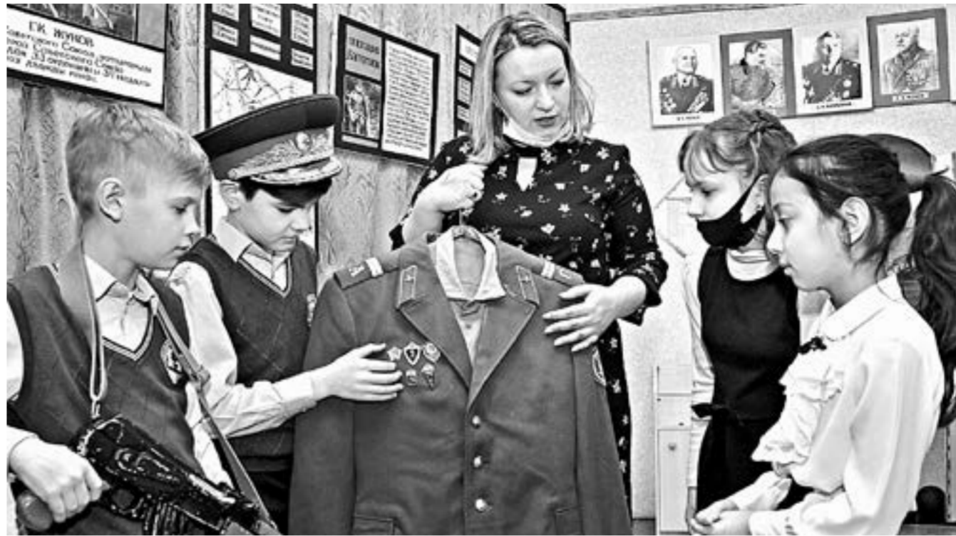
Воспитательная работа стала частью образовательной программы и должна быть системной.

— Эту работу учреждения культуры и образования вели всегда, она для них характерна. Но новый проект структурирован по возрастам, направлениям и включает три блока: «Культпоход», «Культурный клуб» и «Цифровая культура».