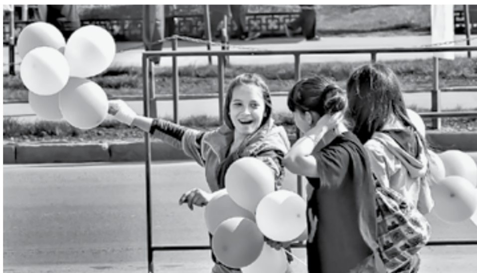
Настроение – весеннее!

Алтайский край и Барнаул готовятся к майским праздникам. Улицы украсили флаги, плакаты. Волонтеры раздают георгиевские ленточки. Люди изучают программы праздников, чтобы не пропустить самое важное и интересное. И делают свои города и села чище: в массовых субботниках участвовали тысячи земляков.