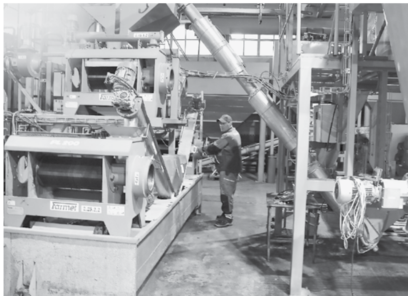
Цех по производству растительного масла.