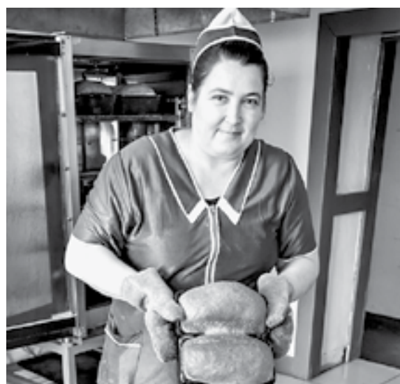
В райпо выпекают 3 тыс. булок хлеба в месяц.

Основная выручка райпо – мероприятия, которые проводятся в кафе. В основном это поминальные обеды. Если за год свадьбы устраиваются по пять-шесть раз, то столько же поминков проводится за месяц.