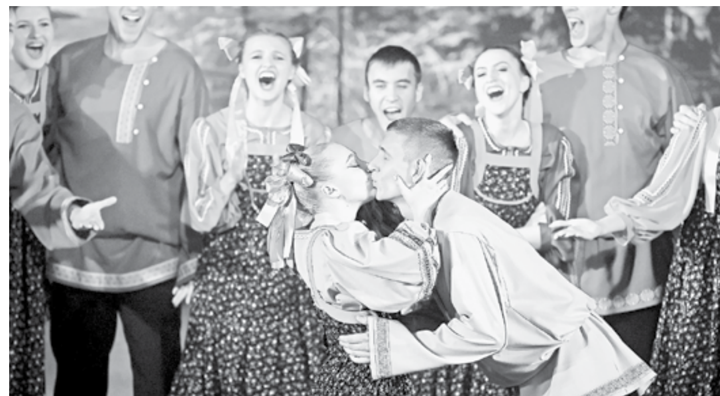
«Феста» завершилась гала-концертом. Участники показывали яркие номера.

Режиссерский замысел – показать противостояние Людмилы Гурченко и Ольги Бузовой. Ребята сыграли на элементе неожиданности: мужские роли исполнили девушки, а женские – парни. – Нам нужно было не просто вжиться в образы известных исполнителей, но и сделать их немного даже карикатурными, чтобы было