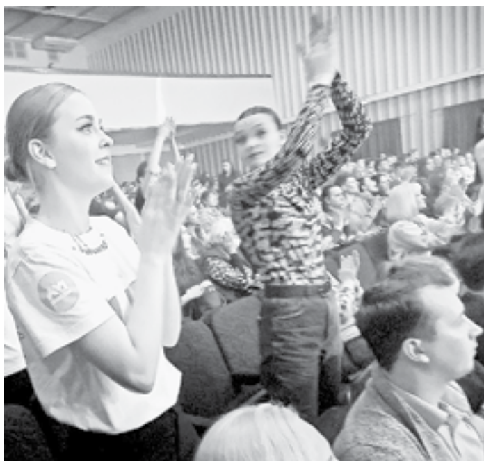
Зрители активно поддерживали конкурсантов.