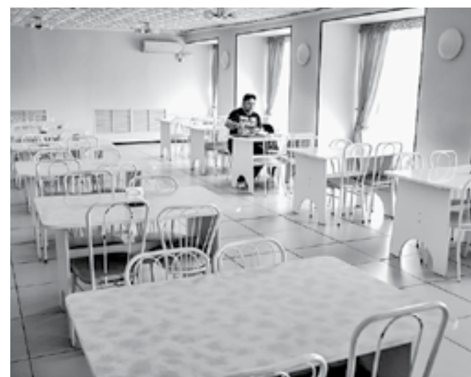
Пустой обеденный зал.