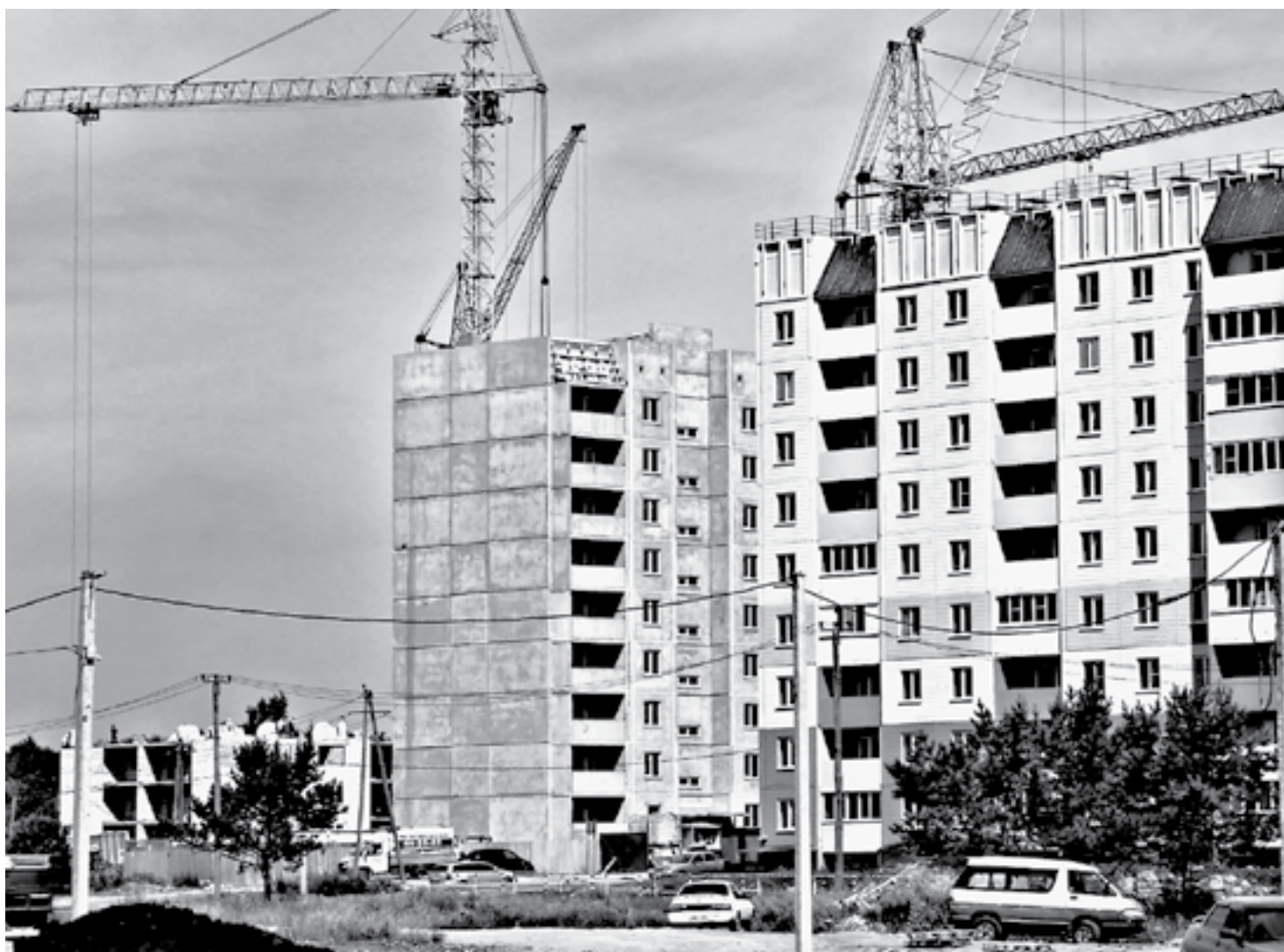
При высоких ставках ипотеки строительство жилья в Барнауле может затормозиться.