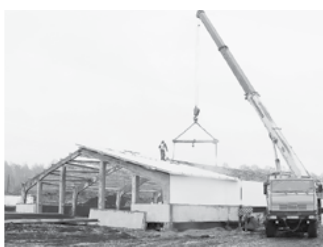
В подсобном хозяйстве ГК «Союз» в селе Малахово строят животноводческий комплекс.

Дни АКЗС в Косихинском районе выявили ряд проблем, которые краевые депутаты пообещали решить.