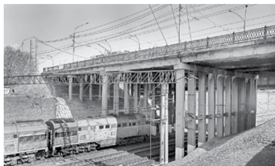
Работы подрядчику нужно будет согласовывать с РЖД.

Работы по реконструкции моста на проспекте Ленина в Барнауле стартуют 25 мая.