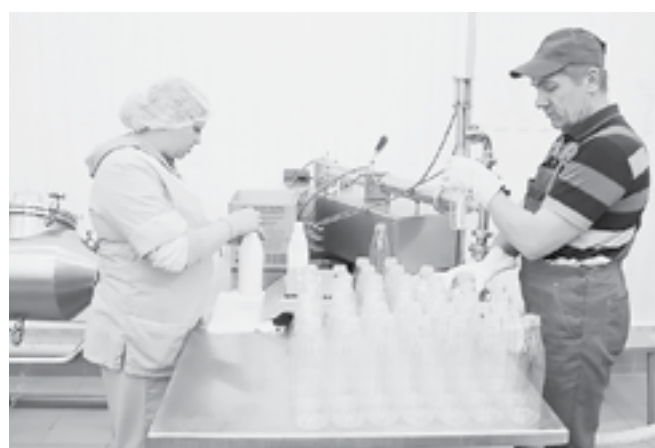
Молочный цех подсобного хозяйства.