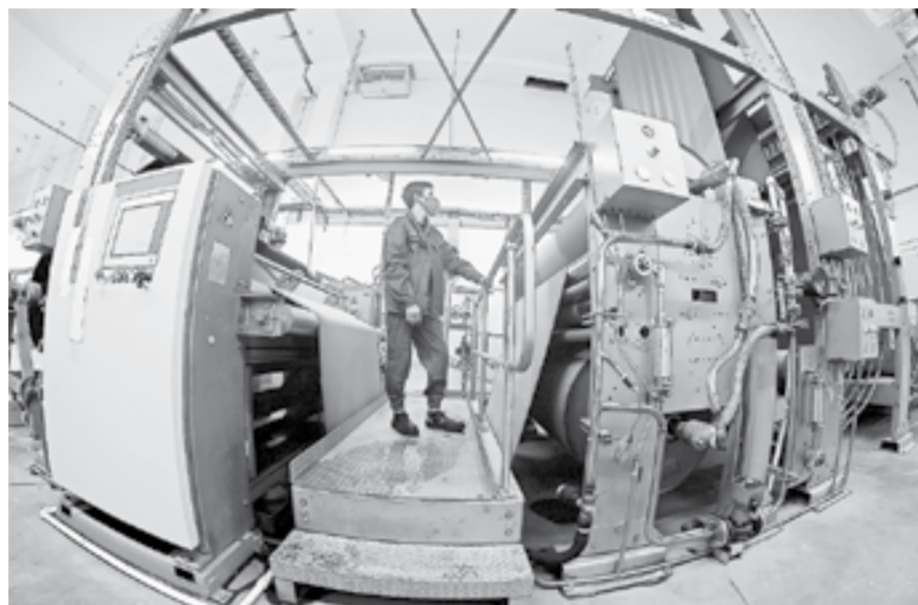
Красильная машина европейского производства.

отделочное производство, потребуется построить новую, более мощную прядильно-ткацкую фабрику. На сегодня законтрактовано 72 ткацких станка и приготовительное оборудование. Этот технологический парк