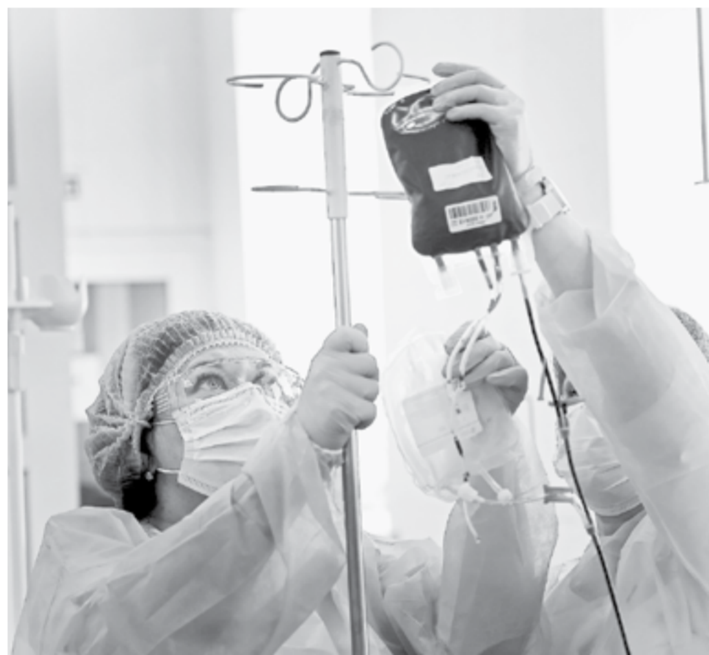
Переливание крови позволяет спасти миллионы жизней.

Вчера мир отметил День донора. За одну процедуру доброволец сдает около 450 миллилитров крови. Из этой дозы специалисты заготавливают отдельно эритроциты, тромбоциты и плазму. Так один донор может спасти жизнь сразу трем людям. В краевом центре крови освоена новая технология хранения тромбоцитов.