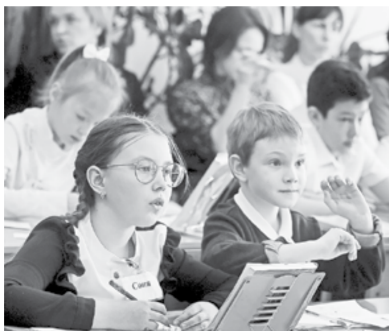
Конкурсные уроки прошли в гимназии № 42.