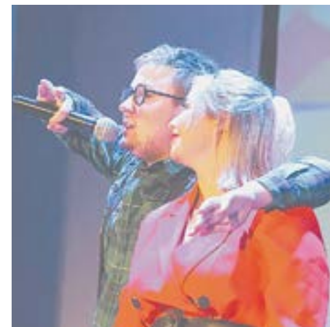
Удивлять зрителя – дело непростое.