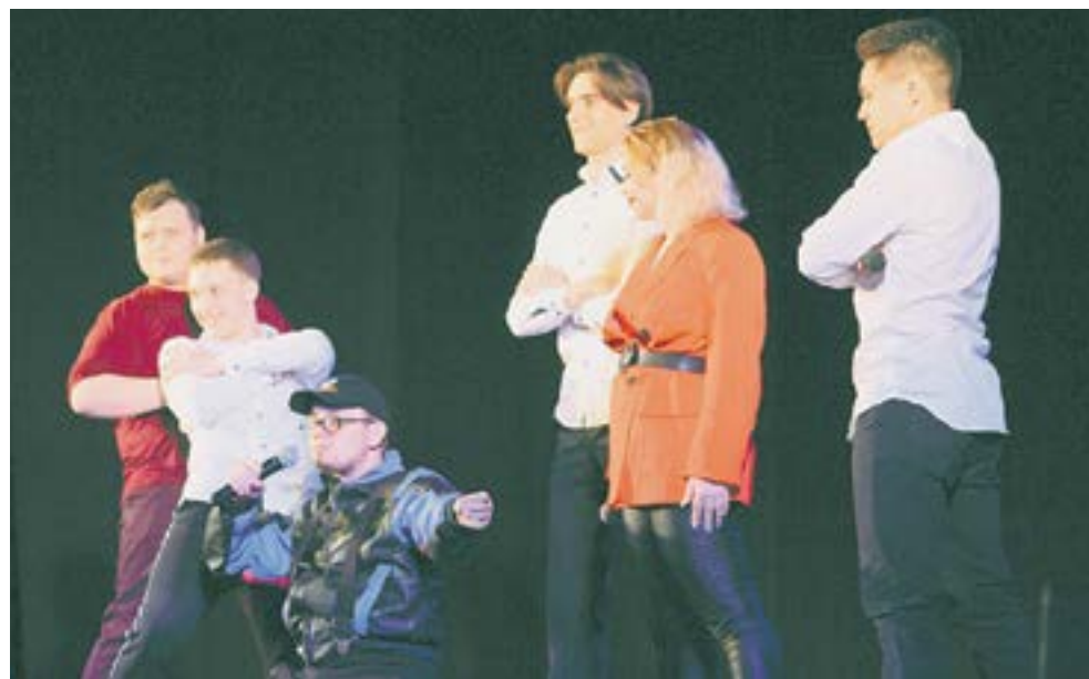
Выступление команды «Под каблуком».

– Сейчас все в этом мире убыстряется. В том числе и шутки. Раньше скорость шуток была с интервалом 1 минута, сейчас же надо удивлять зрителя каждые 15–30 секунд. Очень много на себя оття-