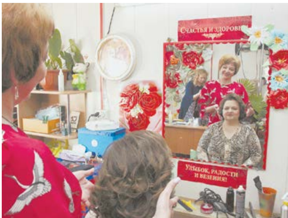
Многодетные мамы увидели, как они красивы.