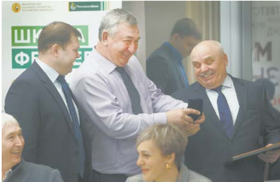
Несмотря на проблемы, алтайские фермеры полны оптимизма.

«Непонятно, как премьер правительства объявляет о том, что обеспеченность зерном в России составляет 150%, и запрещает вывозить излишки в страны ЕАЭС,