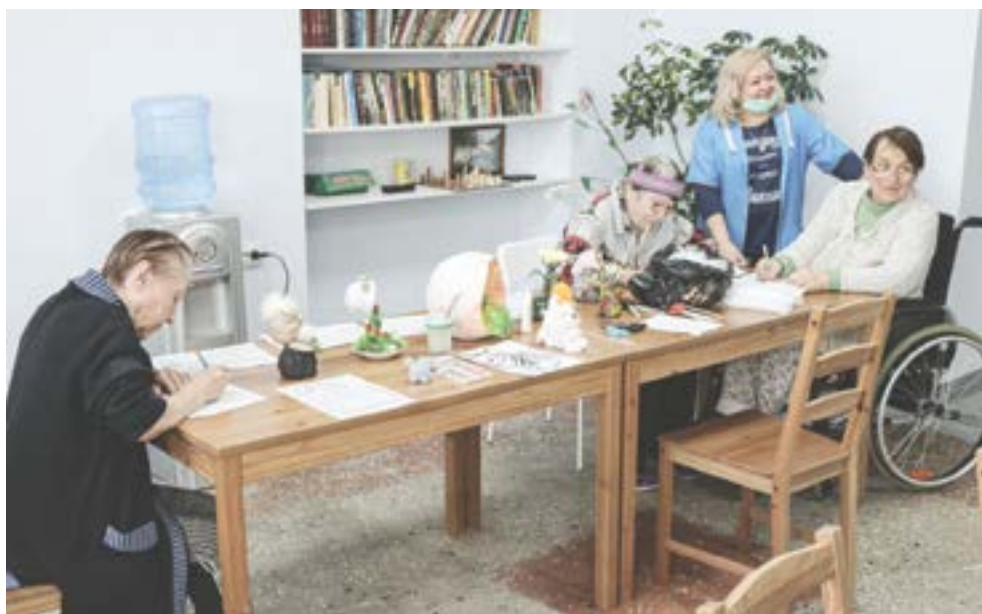
Женщины развивают мелкую моторику рук.

Государственная поддержка позволяет социальным предпринимателям быстрее и с большей выгодой реализовывать свои проекты. Расскажем об этом на примере компании «Уход и милосердие», сумевшей благодаря очередному гранту на треть расширить в этом году количество мест для проживания пенсионеров в своем медико-социальном пансионате.