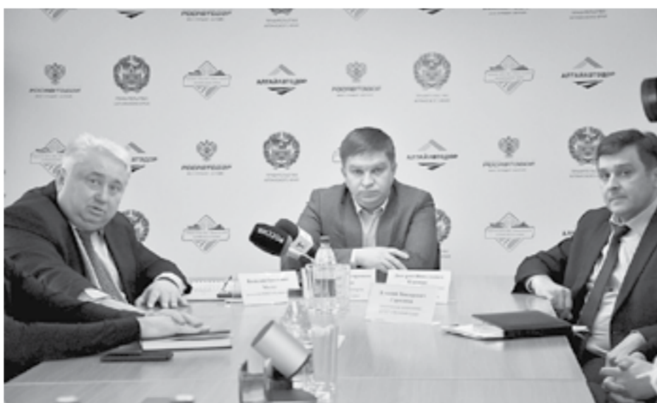
На строительство уйдет полтора года.

53 млн рублей потратили в Алтайском крае на техническое оснащение школ искусств