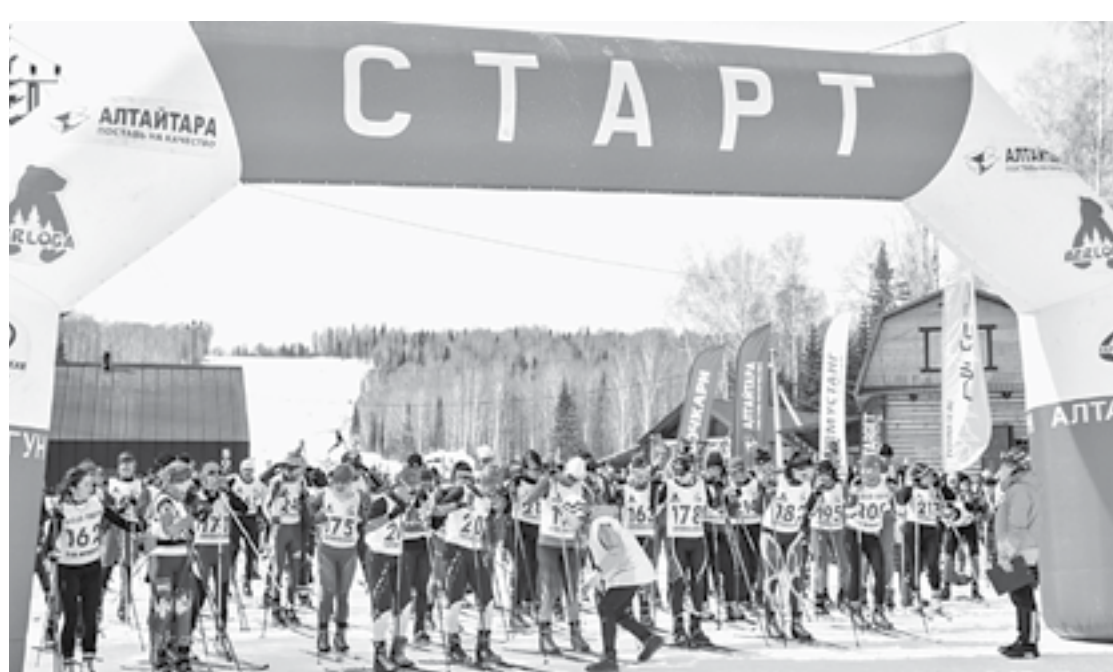
Последние старты сезона вышли массовыми.

Невозможно не отметить погоду, которая в день стартов была уже по-весеннему теплой и солнечной. Кроме того, за день до соревнований прошел обильный вечерний дождь. Все это поставило орга-