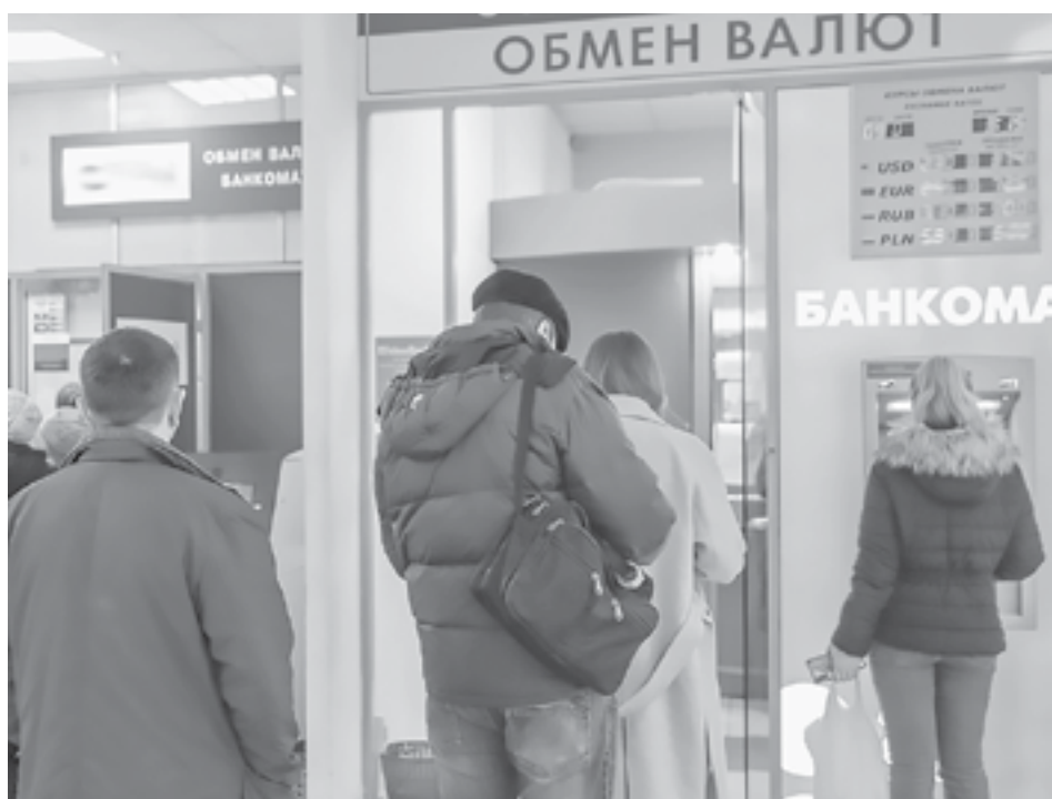
С 18 апреля можно вновь купить валюту.

В СМИ говорят, что коммерческие банки постараются заложить в стоимость наличных долларов и евро 12-процентную комиссию.