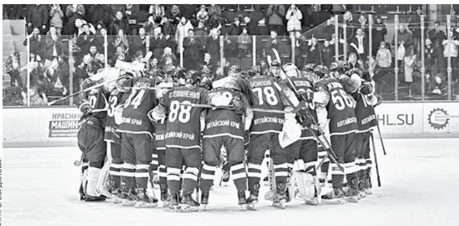
Команда и болельщики едины!

– Хотя это все еще туманно, но мне бы хотелось верить, что так