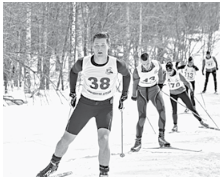
В такую погоду можно и в шортах побегать.