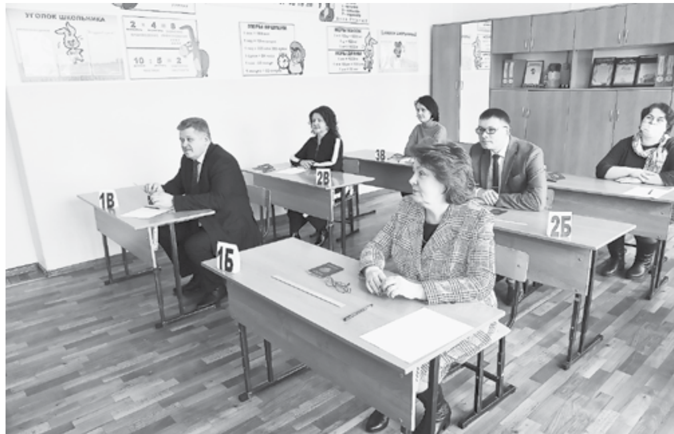
В этом году участники акции решали задачи по математике базового уровня.