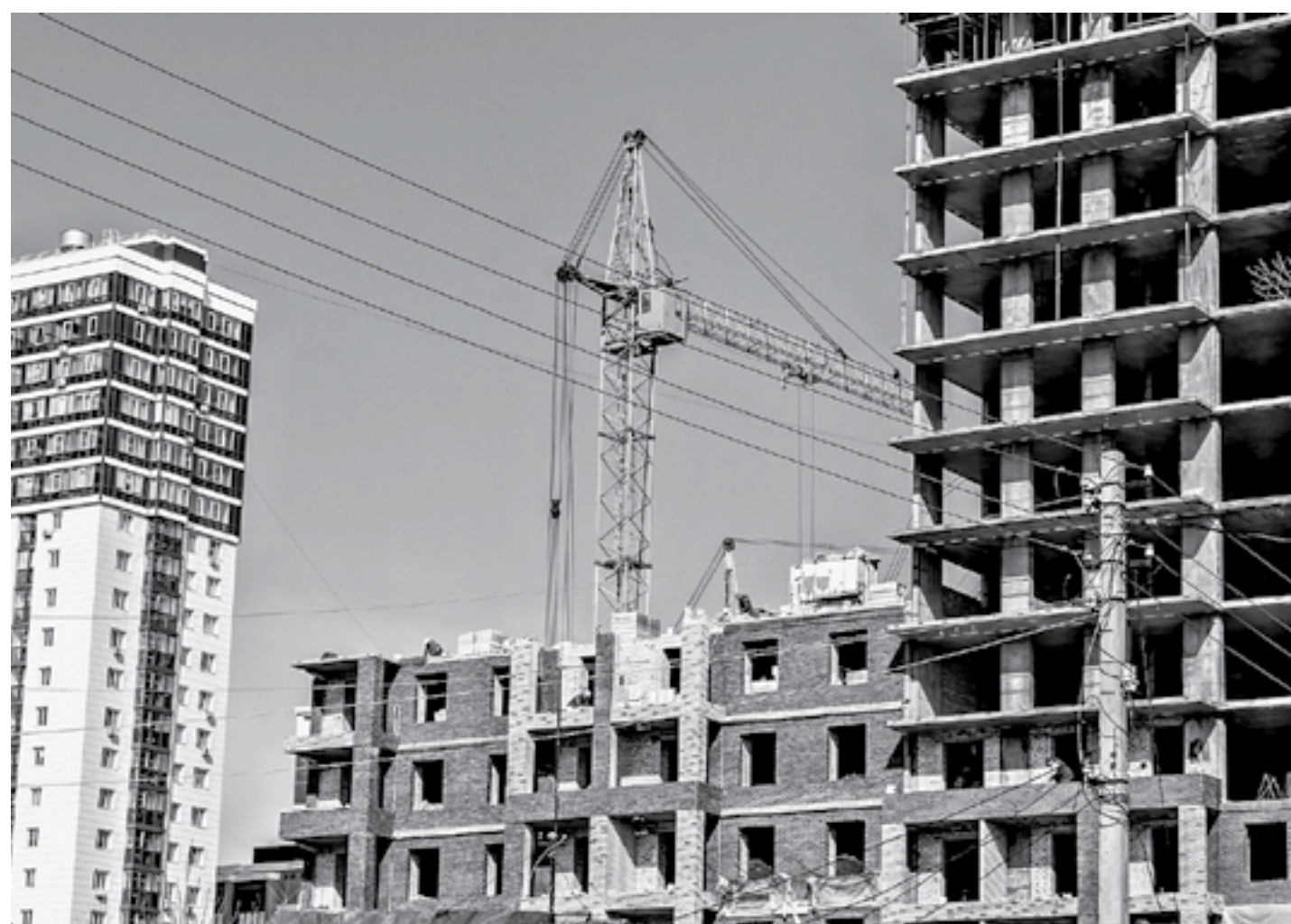
Темпы жилищного строительства в крае опережают прошлогодние.

«Последний месяц мы ищем замену, но поставщики не могут быстро восстановить логистику. Без вмешательства