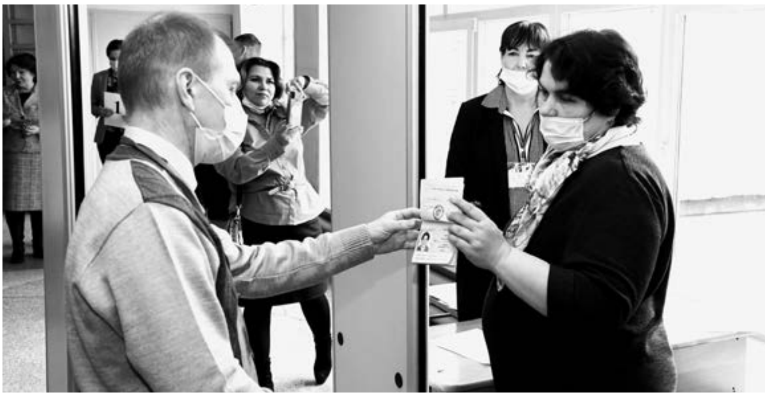
Металлодетекторы, видеонаблюдение – на экзамене у взрослых все по-настоящему.