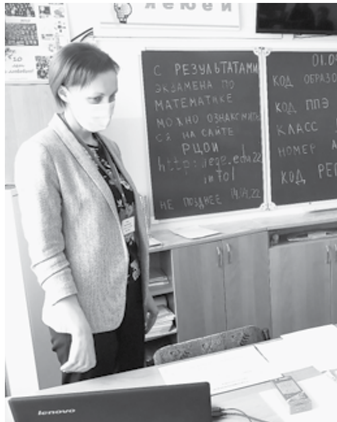
Последние напутствия перед началом экзамена.