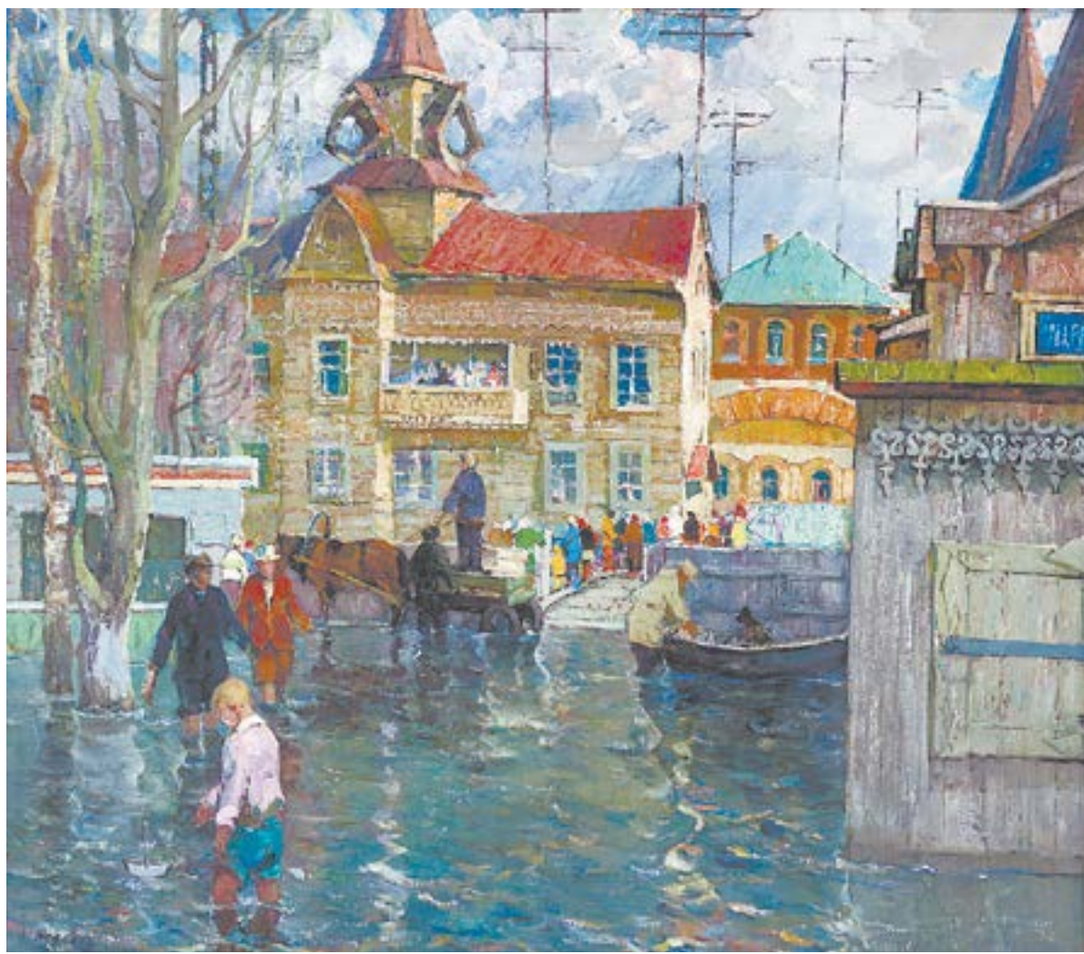
Одна из знаковых работ «Весной 1969 г. Большая вода» (1970).