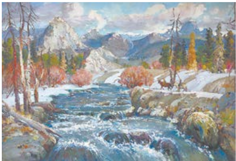
«Большой Яломан у Ак-Кая» (1998).