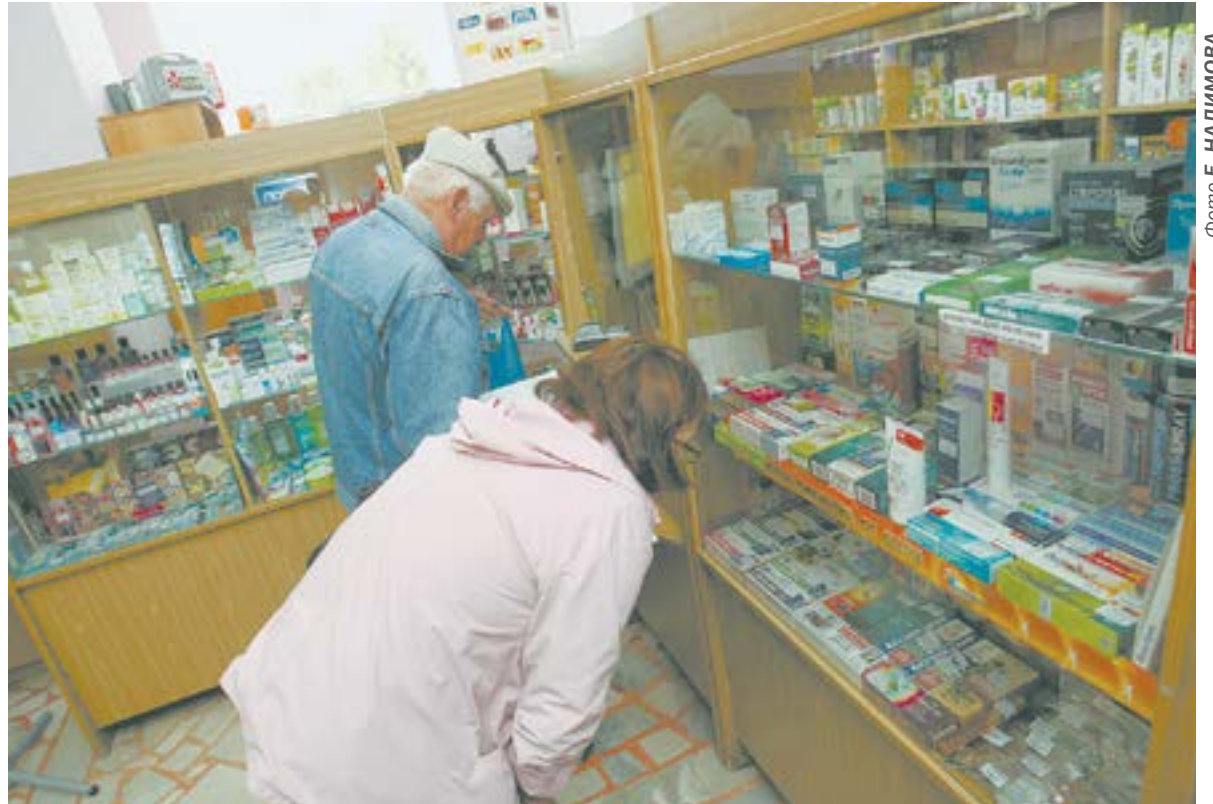
Почти треть от всех обращений поступила к уполномоченному от людей старшего возраста.

Органы местного самоуправления, являясь участниками программы Алтайского края «Форми-