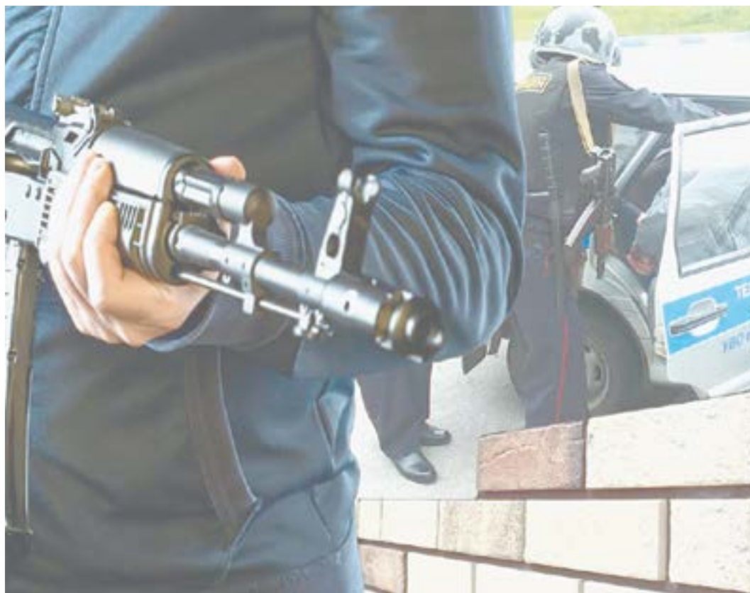
Коллаж О. ТАРАСОВОЙ.

Но дело уже приняло далеко не шуточный оборот. Автомат изъяла прибывшая следственно-оперативная группа, а самого «шутника» отвезли в районную больницу для медицинского освидетельствования. В отношении него в дальнейшем было возбуждено уголовное дело по признакам хулиганства.