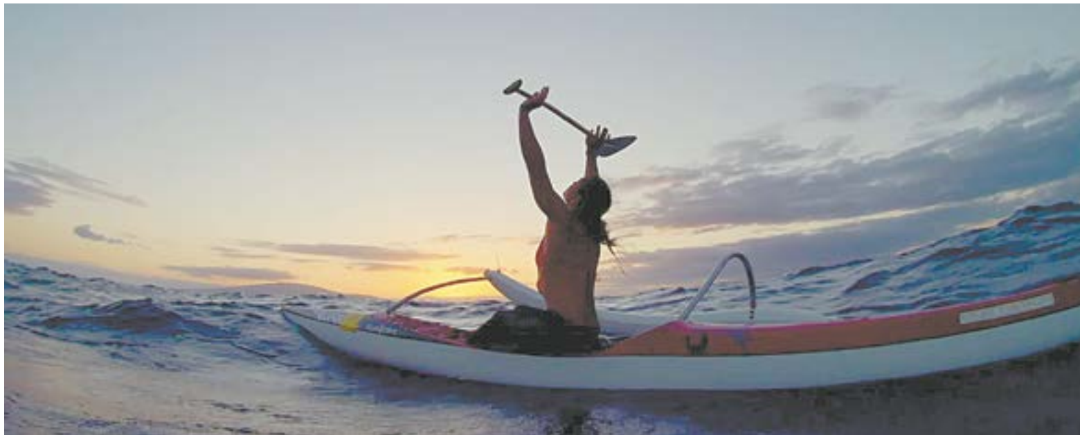
Документальный фильм о восьми замечательных женщинах планеты, посвятивших себя океану.

– Я хочу заботиться о них. Для меня они личности, и у каждой из