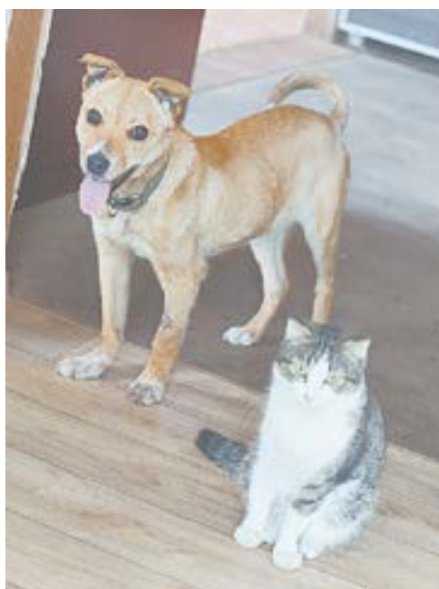
Наталья Часовникова и ее питомцы. На снимке – собака Берта, которую спасли от смерти.