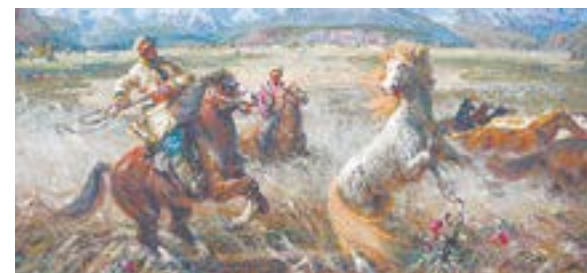
«Табунчики Курая» (2006).