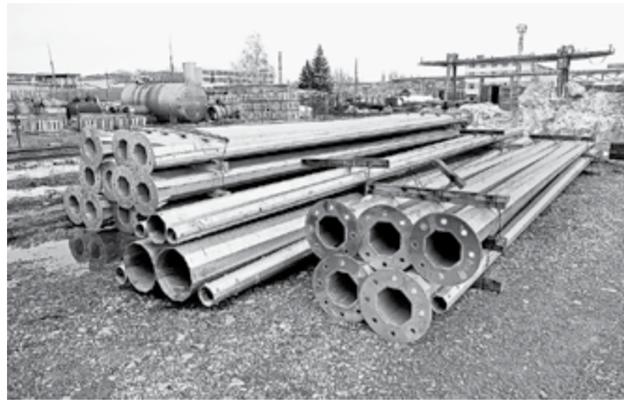
Оцинкованные опоры готовы к отгрузке.