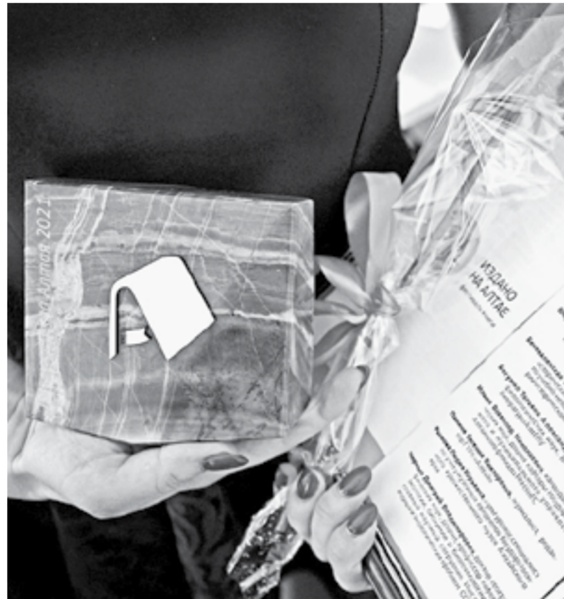
Символ фестиваля – в ревневской яшме.