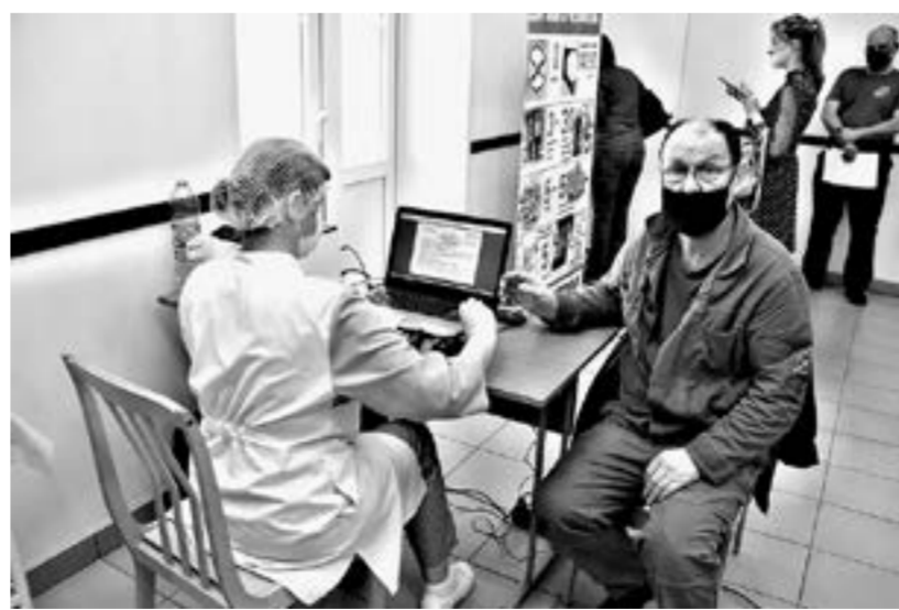
Проблемы со здоровьем выявляют у каждого пятого сотрудника.

– Мне нравится, что можно на рабочем месте пройти обследова-