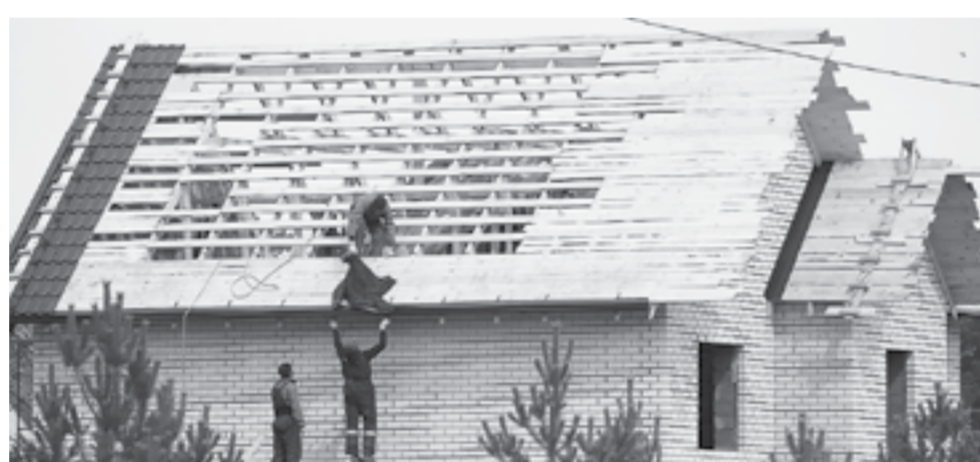
Зарегистрировать землю под самовольными постройками можно до 1 сентября.