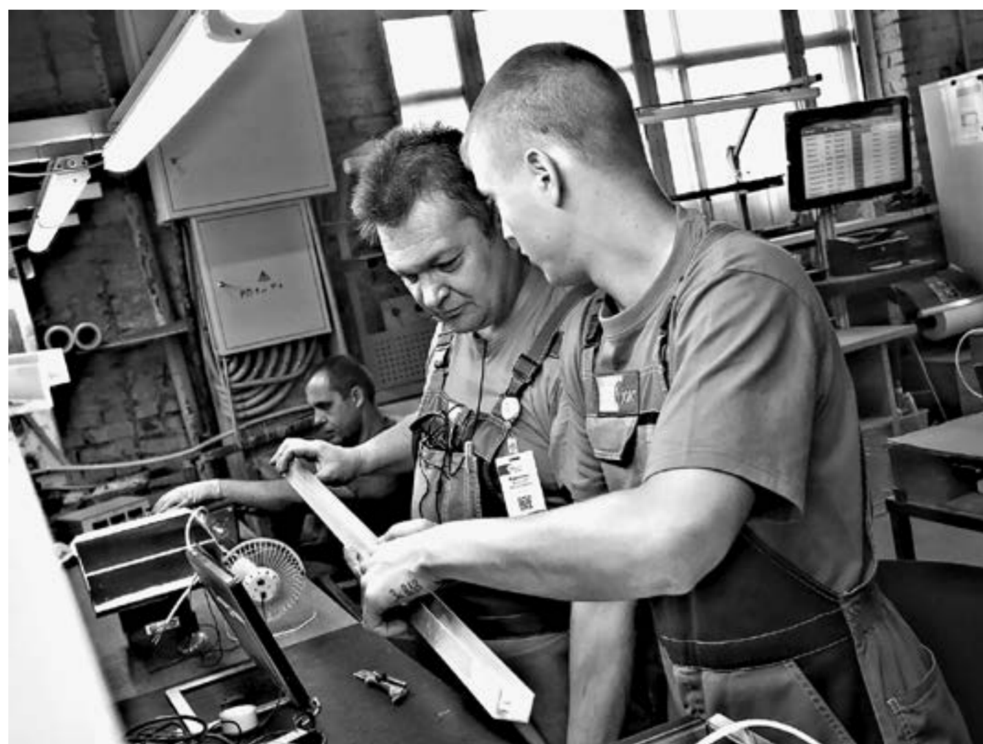
Молодым специалистам нужны теория и практика.

В нынешнем году на конкурс поступило около двухсот заявок от 31 промышленного предприятия и 11 предприятий энергетического комплекса. По итогам отборочных процедур конкурсной комиссией