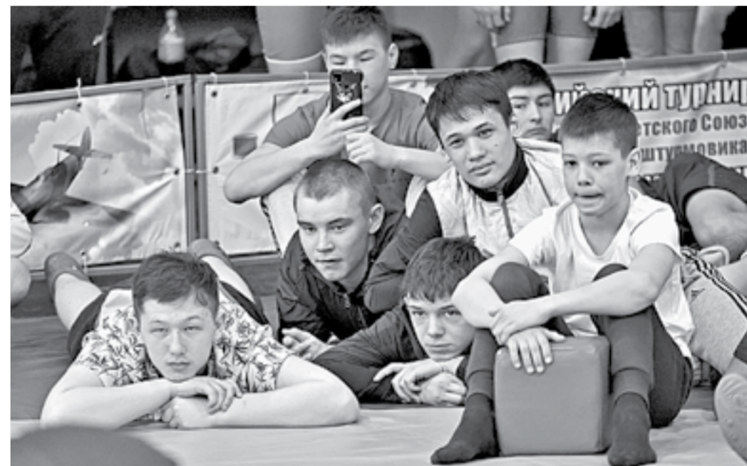
Лучшая подготовка – это наблюдение.