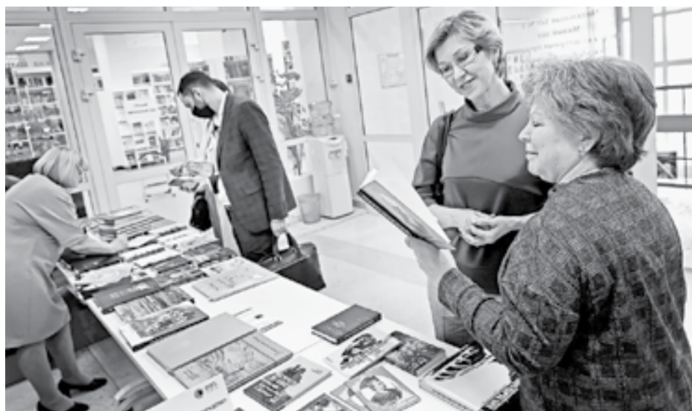
Каждый читатель найдет свою книгу.

Книг на выставке изданий в Шишковке – по понятным причинам – в этом году было гораздо меньше, чем прежде. Но все равно каждый из гостей фестиваля «Издано на Алтае» мог среди 563 найти свою, и даже не одну. А гостей тех