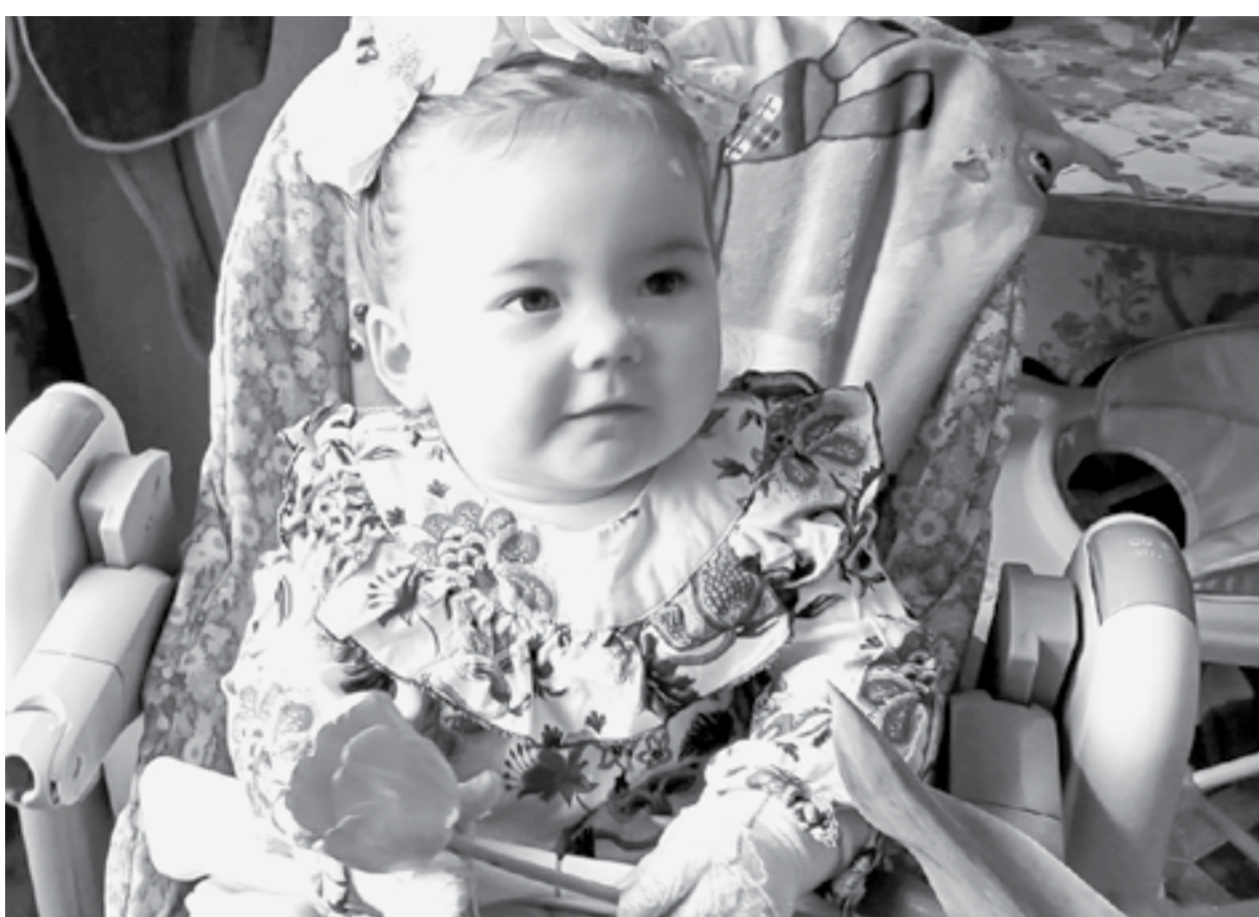
Для подопечных марафона «Поддержим ребенка» препараты закуплены на полгода.

На заседании попечительского совета марафона было решено приобрести