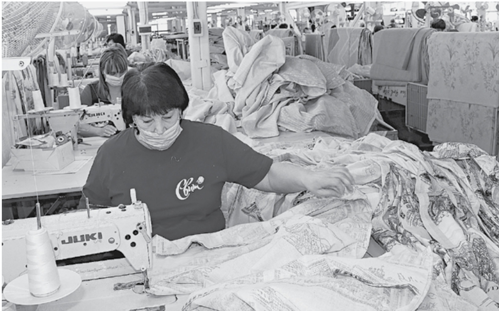
В швейном цехе нет свободных вакансий.