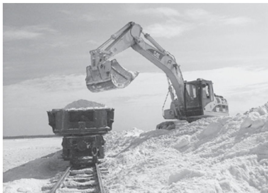
В 2021 году производство сульфата составило около 600 тонн.

Еще в октябре 2021 года Генеральная прокуратура обратилась в суд с требованием передать большую часть полного пакета акций ОАО «Кучуксульфат» Росимуществу. По мнению Генпрокуратуры, они являются государственной