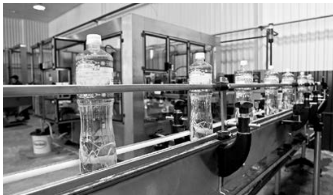
Действующие в крае мощности позволяют переработать около 700 тысяч тонн растительного масла.

Кроме того, сегодняшние мощности позволяют вырабатывать в год более 1 млн