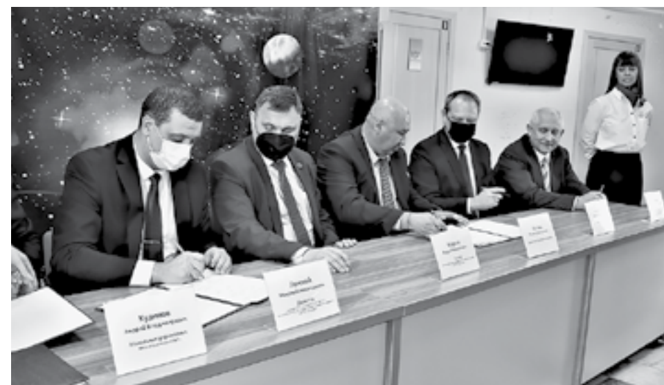
Подписание Соглашения о дальнейшем развитии технопарка.

нетарный аппарат фирмы «Карл Цейсс Йена». Его Бийску привезли в прошлом веке из Звёздного городка в подарок. Благодаря этому прибору бийчане изучали звезды многие-многие годы. Сейчас «старичок» отправился на покой, его заменил современный полнофункциональный проектор, позволяющий просто окунуться с головой в далекие галактики, но цейссовский можно включить в любое время – он в полном порядке и продолжает украшать зрительный зал.