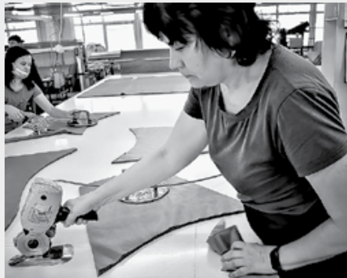
В швейном цехе.

ворно перемащается между изгибами полотна, спасая его от заминания.