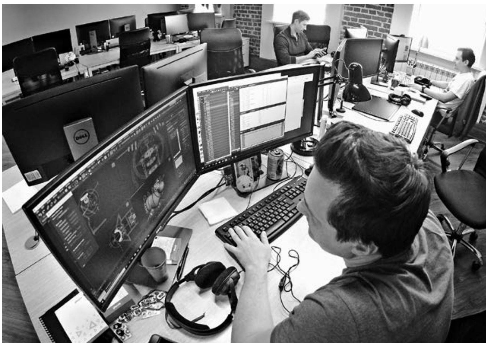
Некоторым алтайским IT-компаниям уже предлагают вывести бизнес за границу.

– Дополнительные затраты – не критично. Другой момент – ох-