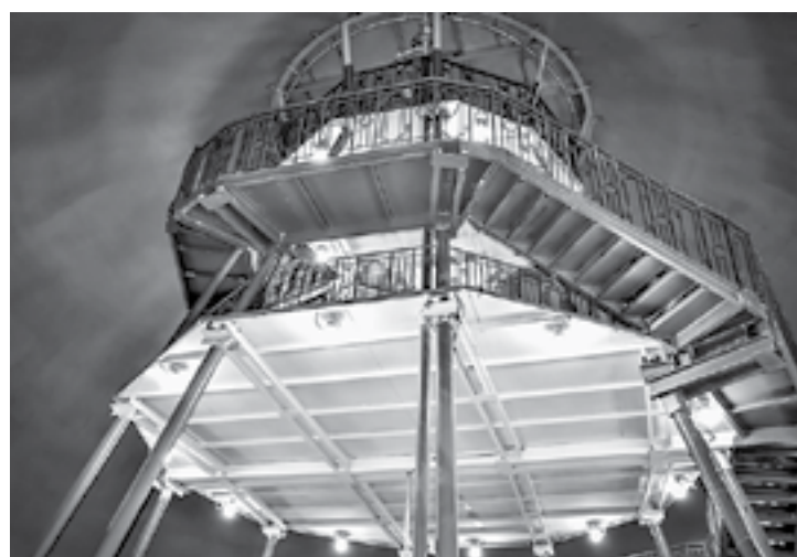
Выше, выше, и звёздам!

Миссия частного Фонда Андрея Мельниченко – создание среды для развития талантов в сфере естественных наук в российских регионах. Андрей Мельниченко – крупный российский промышленник и благотворитель, добившийся успеха своими собственными силами.