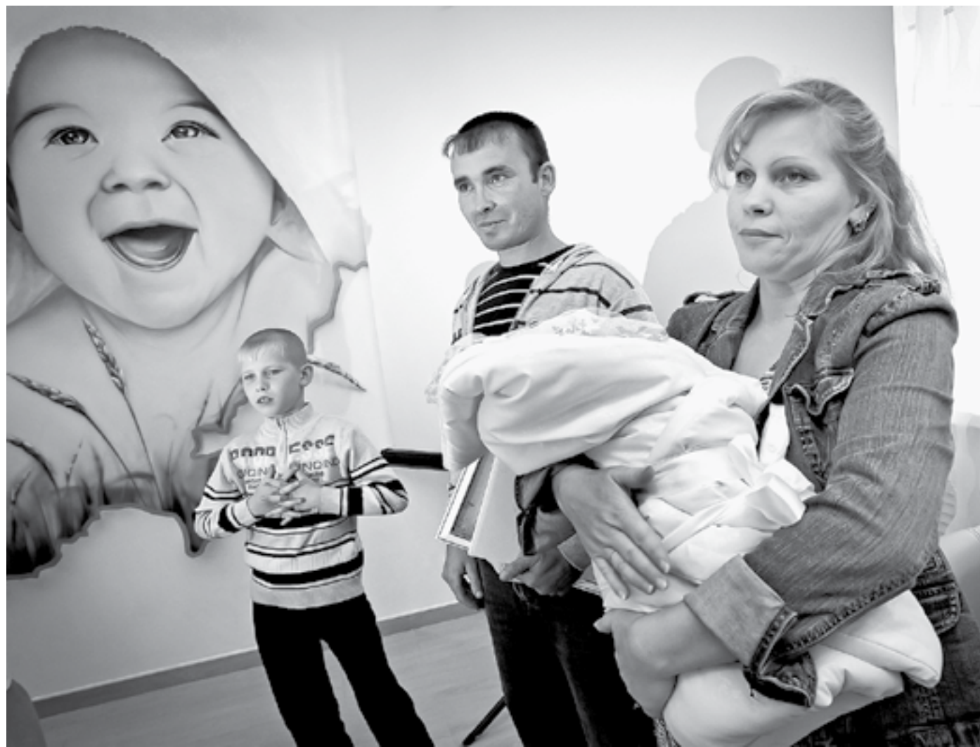
Малыши, родившиеся в «Даре», едут домой уже с первым документом.

Внедрение двух супер-сервисов, касающихся регистрации рождения ребенка, а также уплаты близкого человека идет в нашем регионе. Совсем скоро можно будет подать заявление о таких событиях через портал госуслуг.