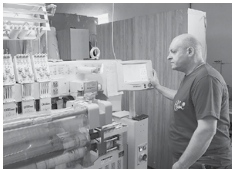
На фабрике много оборудования с ЧПУ.