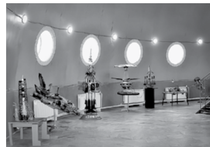
Музей космонавтики в куполе планетария создан руками детей.