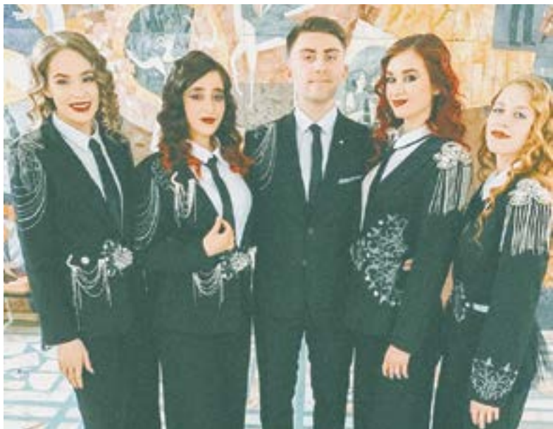
Вокальная группа Уюпа.

Вокальная группа Уюпа Алтайского госуниверситета стала лауреатом III степени VII Международного конкурса детского и молодёжного творчества «Звёздный проект». Коллектив участвовал в номинации «Вокальное исполнительство» (эстрадное пение).