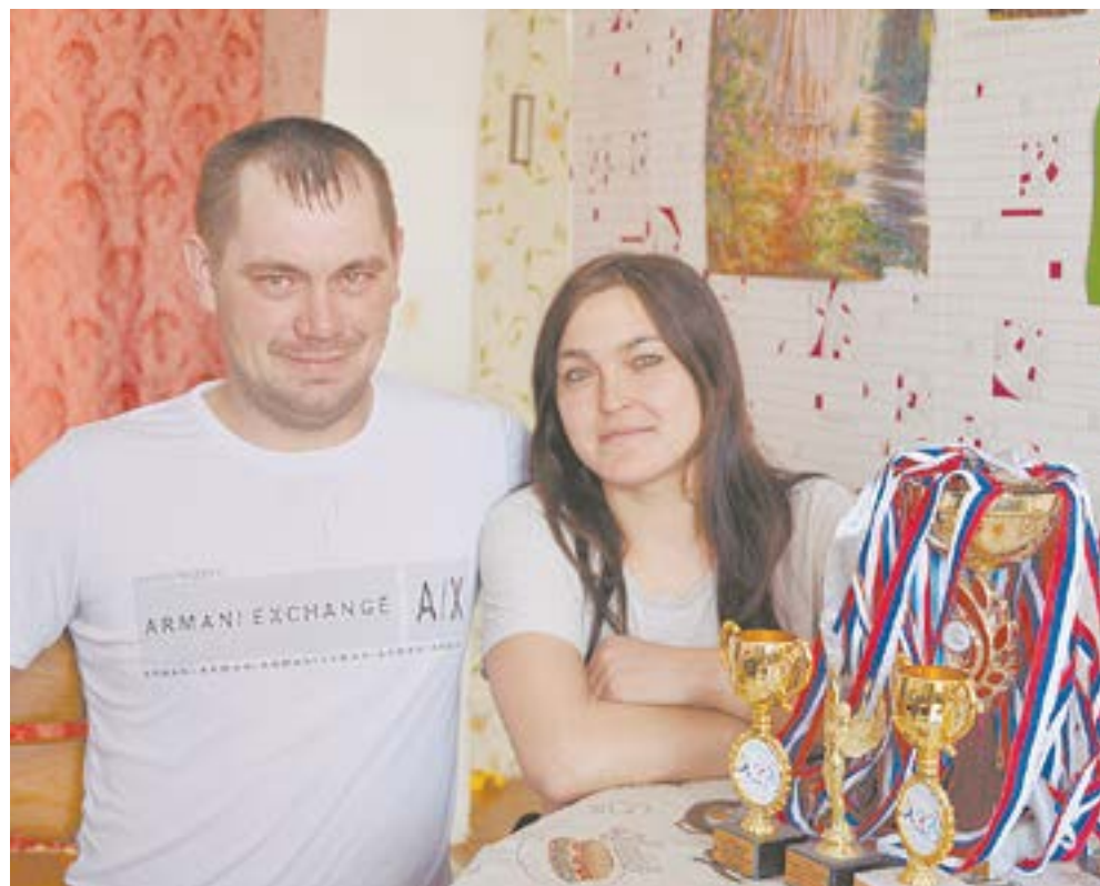
Семья Бендриковских занимается не только хозяйством, но и спортом.