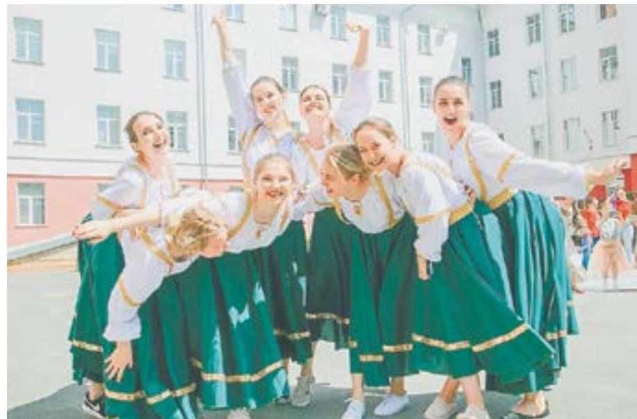
Танцевальный коллектив ENERGY.

– Танцы для меня – дело всей жизни! – признается девушка. – Язык тела, жестов, умение передать эмоции и чувства без слов – этому мы учимся из года в год и стараемся модернизировать уже полученные навыки. Здорово, когда есть место, приходя в которое ты мо-