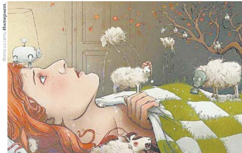
Науку засыпания осваивай вместе с сомнологом.