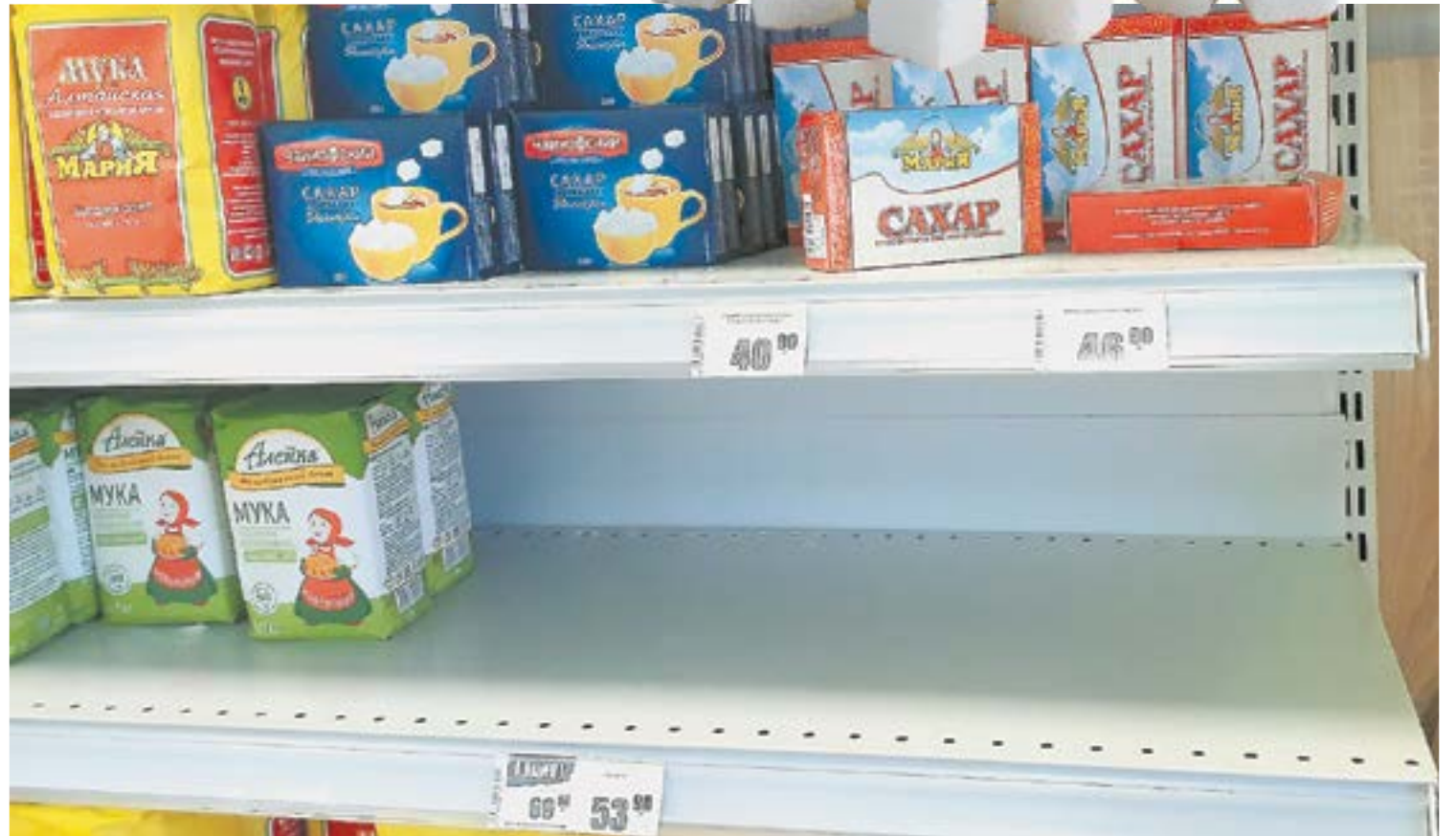
С полок сетевых магазинов исчезает дешевый сахар.