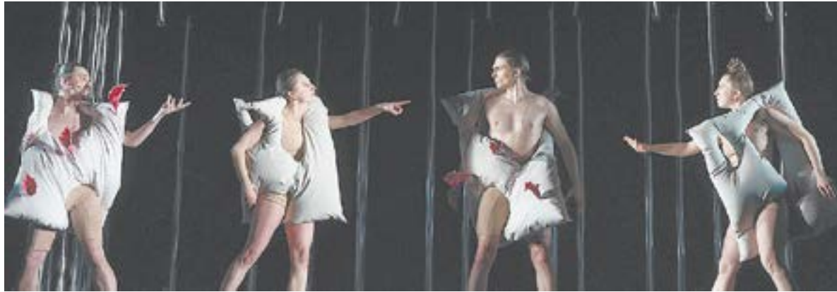
Зачарованные лесными духами влюбленные забудут, в кого же они влюблены.