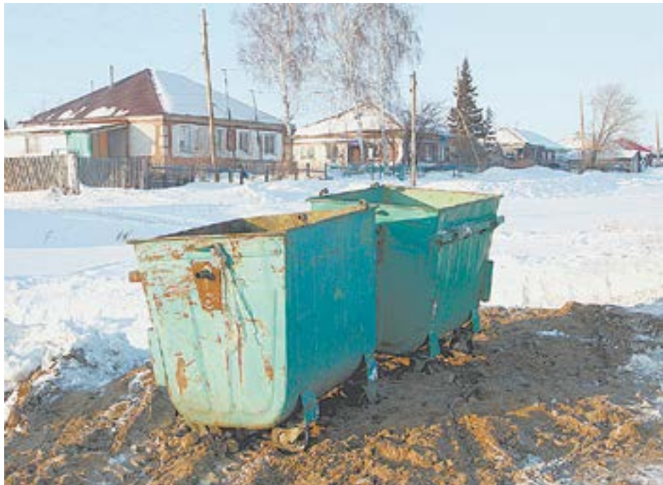
Не все сельчане согласны платить за контейнеры.

Почему тариф установили для города в 120 литров в месяц, а для дерев-