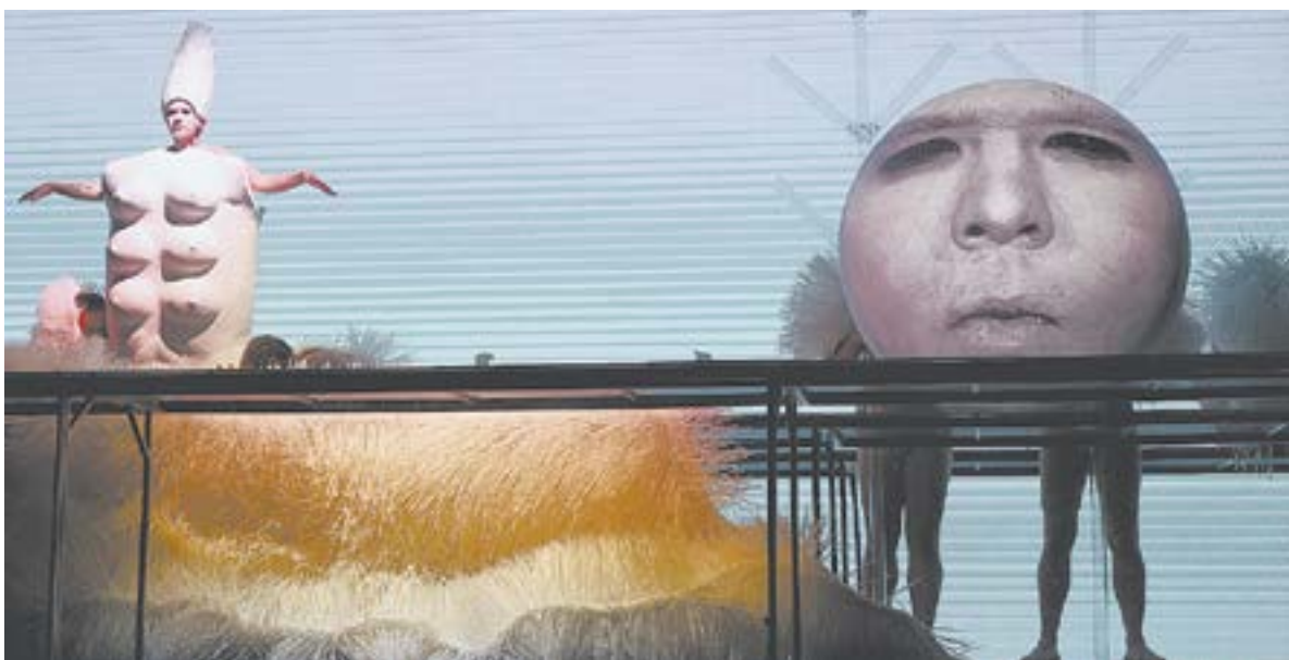
Театр кукол позволяет воплотить на одной сцене миры людей и волшебных существ.