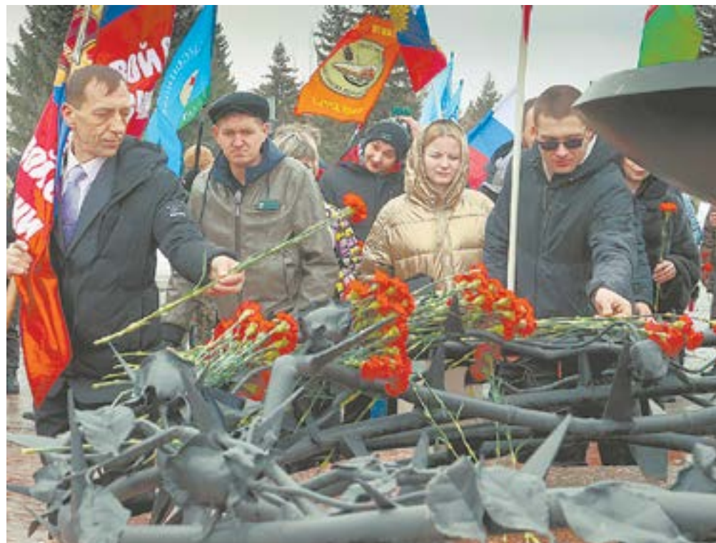
Жители Барнаула выразили поддержку Вооружённым силам России и соотечественникам.