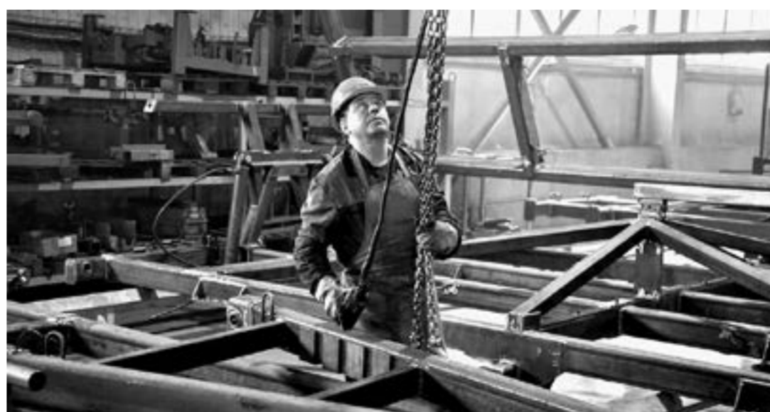
АНИТИМ стал еще одним участником нацпроекта.

По его словам, предприятия отмечают пользу от участия в национальном проекте. Основные маркеры, по которым можно оценить увеличение производительности труда на предприятиях-участниках, – это время протекания процесса, увеличение выработки и сокращение незавершенного производства в пилотном потоке. Очевидную картину дают цифры 2021 года. Так, на Бочкаревском пивоваренном заводе произошло сокращение незавершенного производства