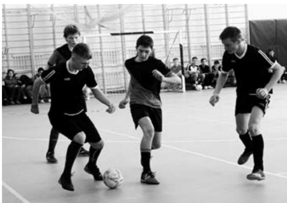
Футбольные баталии в Родино получились захватывающими.