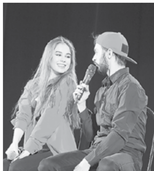
Радеут зал «Биполарочка»...