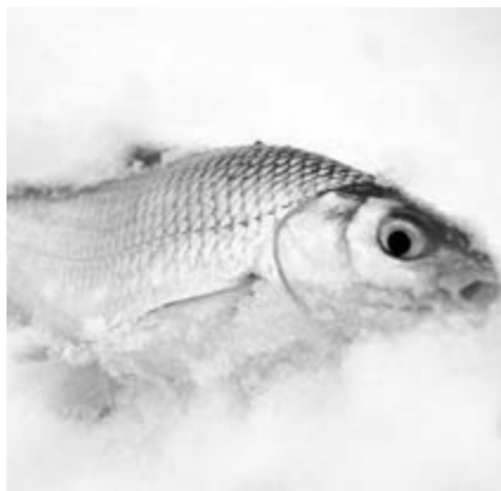
В улове и окунь, и сорожка.