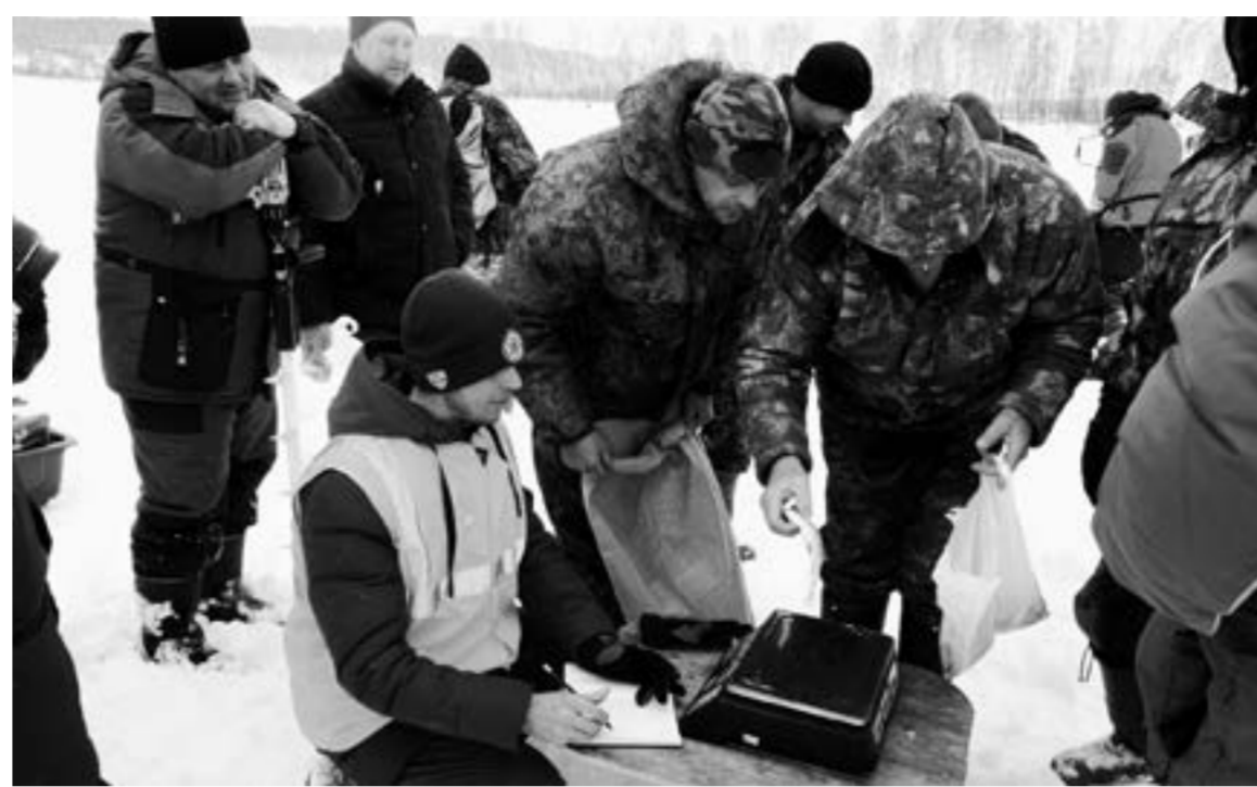
Взвешивание добычи – волнительное дело.