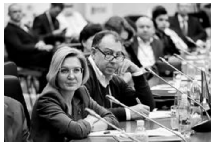
Среди участников – вице-губернатор Томской области Андрей Кнорр.