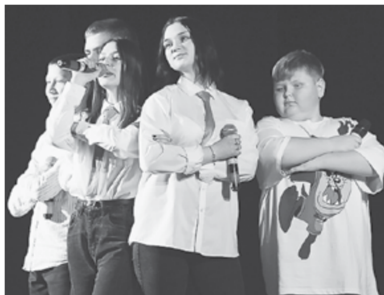
...и заринская команда «Чувство-Ю».