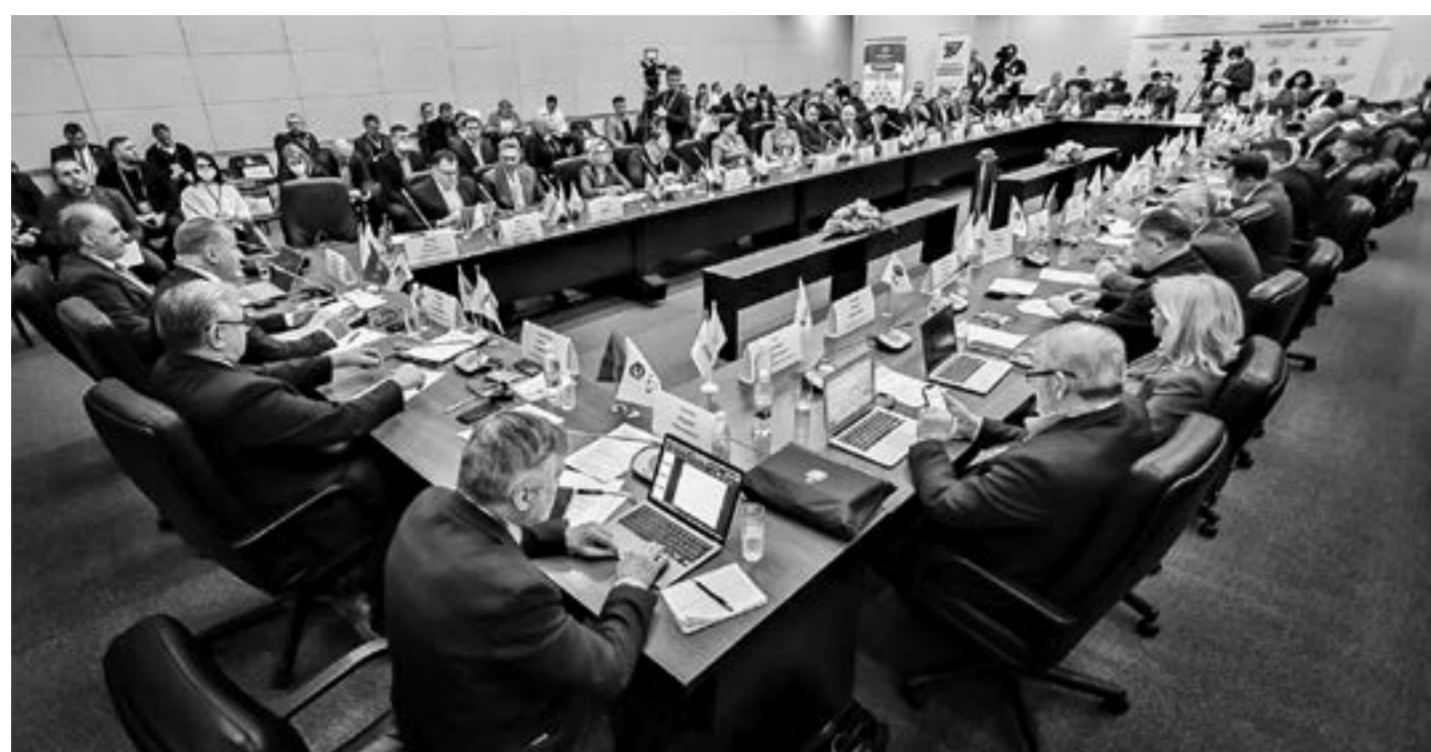
На конференцию приехали руководители более 120 компаний.

Нынешний рост цен продолжается. Если неделю назад пшеницу трейдеры в крае закупали по 17 тыс. за тонну, то