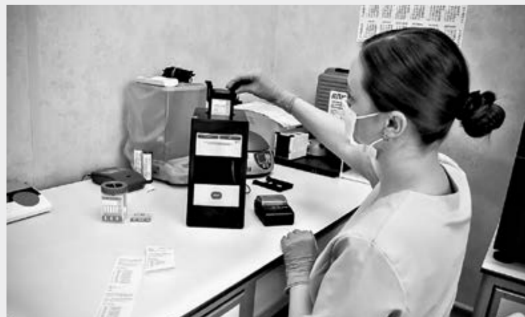
Токсикологический анализ позволяет выявить, употреблял ли человек алкоголь в течение последнего месяца.

водит экспресс-диагностику. Она будет направлена на исследование памяти, внимания, интеллекта, мышления и личности. В течение 15–25 минут психолог сможет понять, есть ли отклонения от нормы. Получив заключение, пациент возвращается к психиатру, который принимает окончательное решение, имеется ли у обследуемого противопоказание к владению оружием или нет.