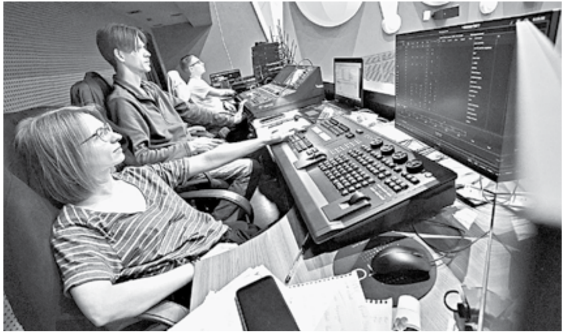
В театре работают над сложной световой партитурой.