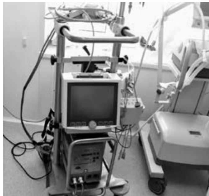
Новая аппаратура расширила возможности врачей.