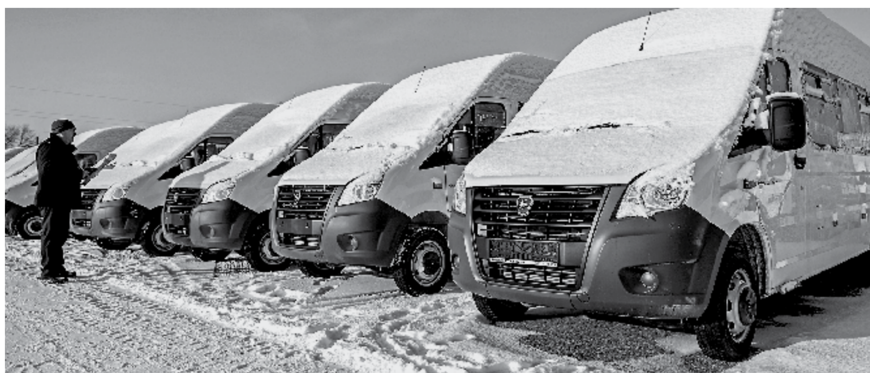
Автобусы получены. Найдутся ли водители...

Относительно повезло тем, у которых уже были муниципальные автопредприятия. В Локтевском районе МТП «Пас-