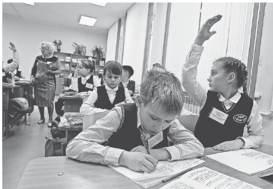
Значительно выросли расходы на образование.

– По указным категориям выходим на прирост более 18% к уровню минувшего года. Мы поддерживаем инициативу Президента РФ в части увеличения мер социальной поддержки на 8,6%, то