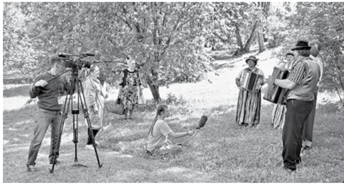
Для мультимедийной энциклопедии отсняли ряд фольклорных коллективов края.

В начале марта начнет работу новый интернет-ресурс – мультимедийная энциклопедия народов, населяющих Алтайский край.