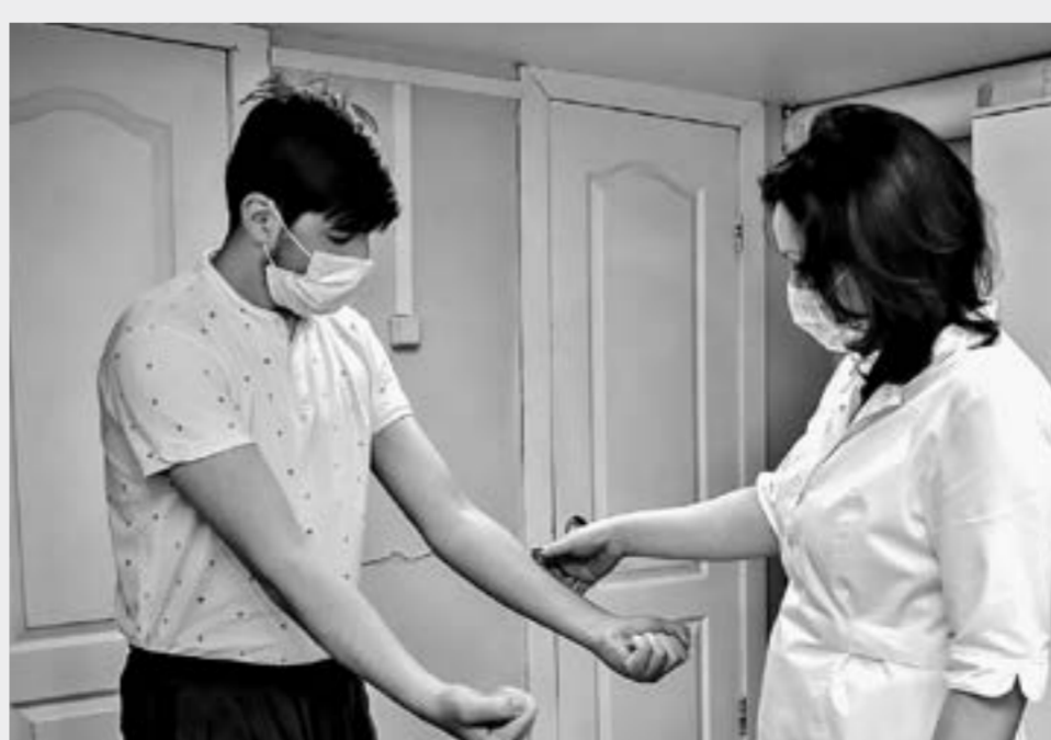
На приеме у нарколога.

Чтобы подтвердить свое право на владение оружием, граждане должны пройти переосвидетельствование раз в пять лет. Оно включает в себя психиатрическое освидетельствование, химико-токсикологические исследования на присутствие в организме наркотических и психотропных веществ и их метаболитов, осмотры психиатром-наркологом, психиатром, офтальмологом и терапевтом. И выдачу заключительной справки в поликлиниках. Данные обо всех гражданах, которые получают право на владение оружием, будут передаваться в Росгвардию. Эта мера, по мнению законодателей, позволит исклю-