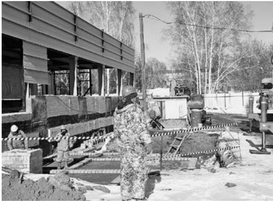
Строительство спорткомплекса в рамках нацпроекта чересчур затянулось.