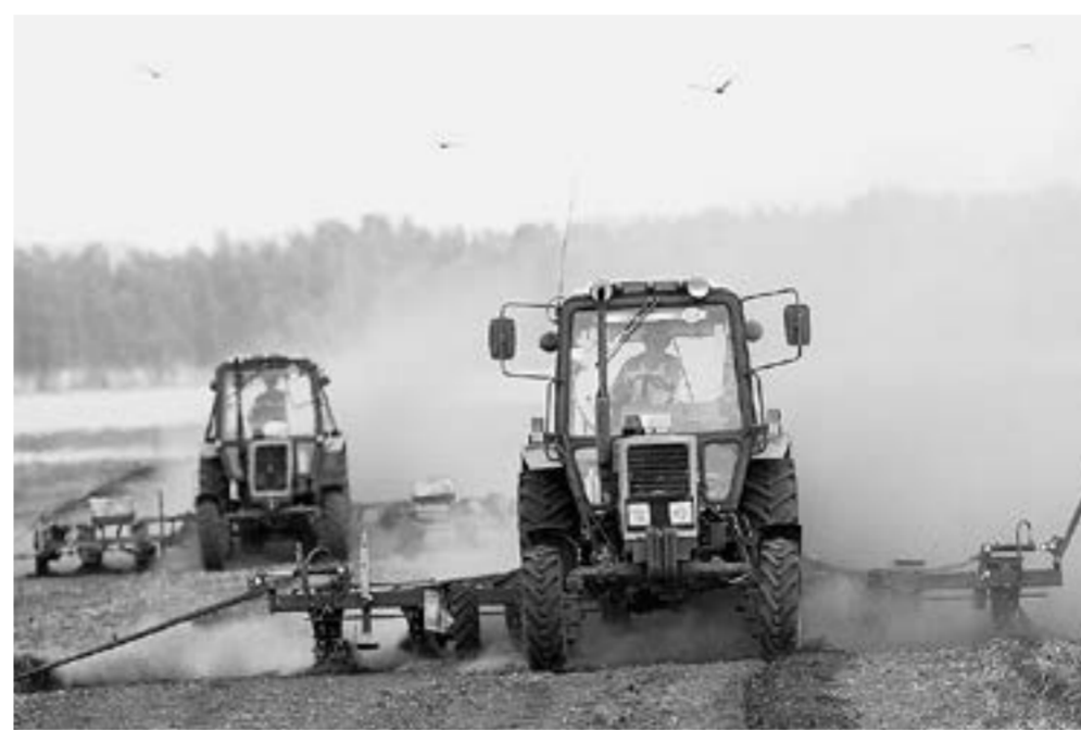
Весенние полевые работы не за горами.

Сегодня уже многие сельхозпроизводители поняли, что без минеральной подкормки высокой урожайности не добиться, и вы-