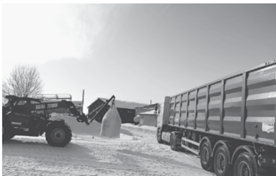
Далеко не всем фермерам удалось запастись удобрениями и посеять.

Для фермеров предусмотрен отдельный лимит по льготным кредитам. Благодаря