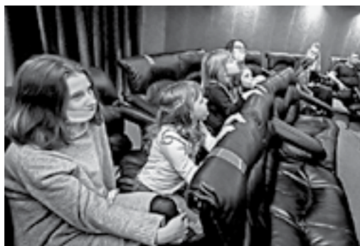
Весной в зале установят новые кресла.