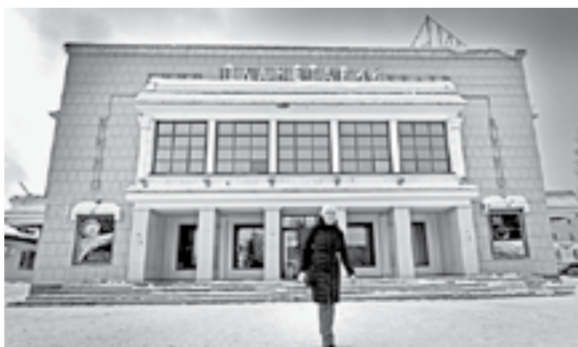
Реставрация фасада пока в планах.