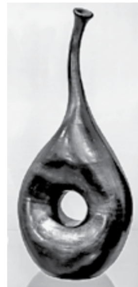
Сочетание традиции и современного искусства.