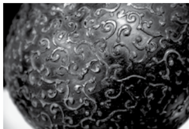
Фрагмент вазы «Анур».