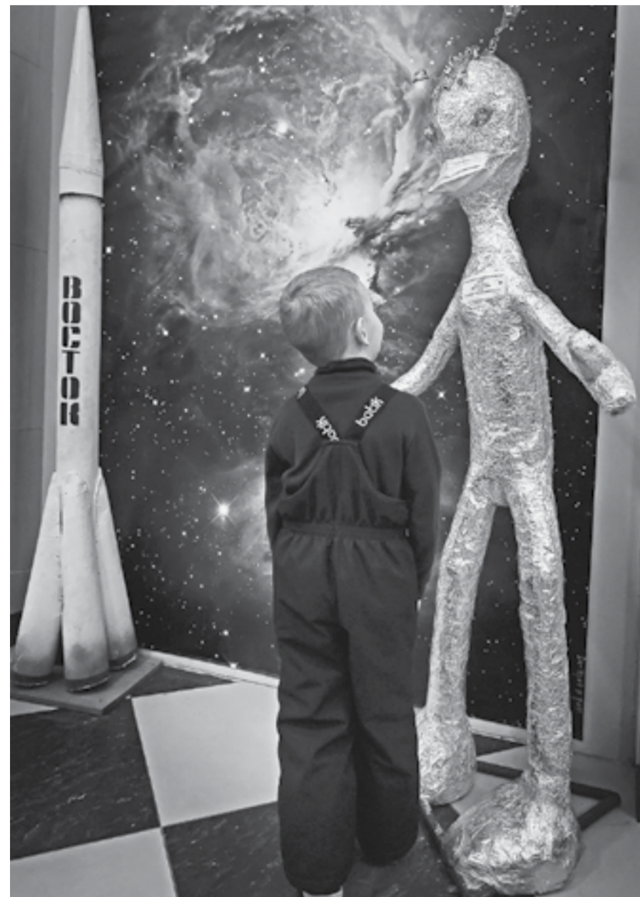
Знакомство с космосом.