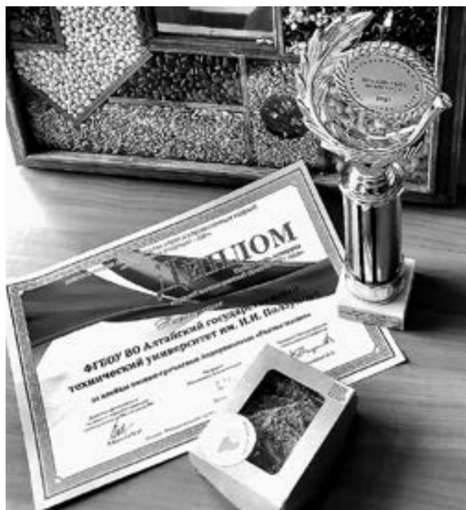
Мероприятие проходило в Москве.