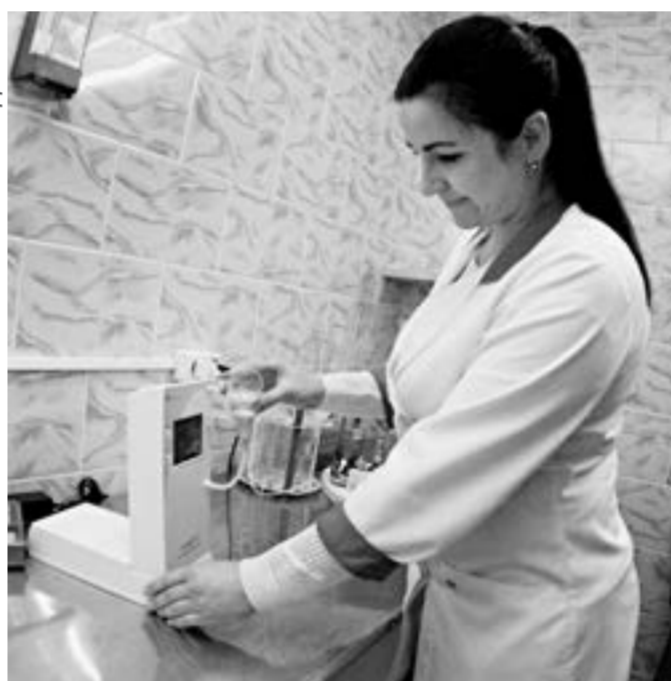
Теперь ежедневный контроль молока будет усилен.

торий находятся в некоторой растерянности. Например, до сих пор непонятно, будет ли осуществляться доплата за дополнительную работу действующим сотрудникам. Ждать ли пополнения специалистов? Как будет производиться забор образцов молока из молоковозов? У переработчиков это делается на специально оборудованных площадках. До последнего времени образцы молока из молоковозов ветврачами не забирались, их предоставлял сам заказчик. Будет ли выделено помещение для осуществления экспертизы? В общем, вопросов больше, чем ответов. Ясно пока только с оборудованием. Ветлаборатории выписывают специальные аппараты для автоматического проведения экспертизы.