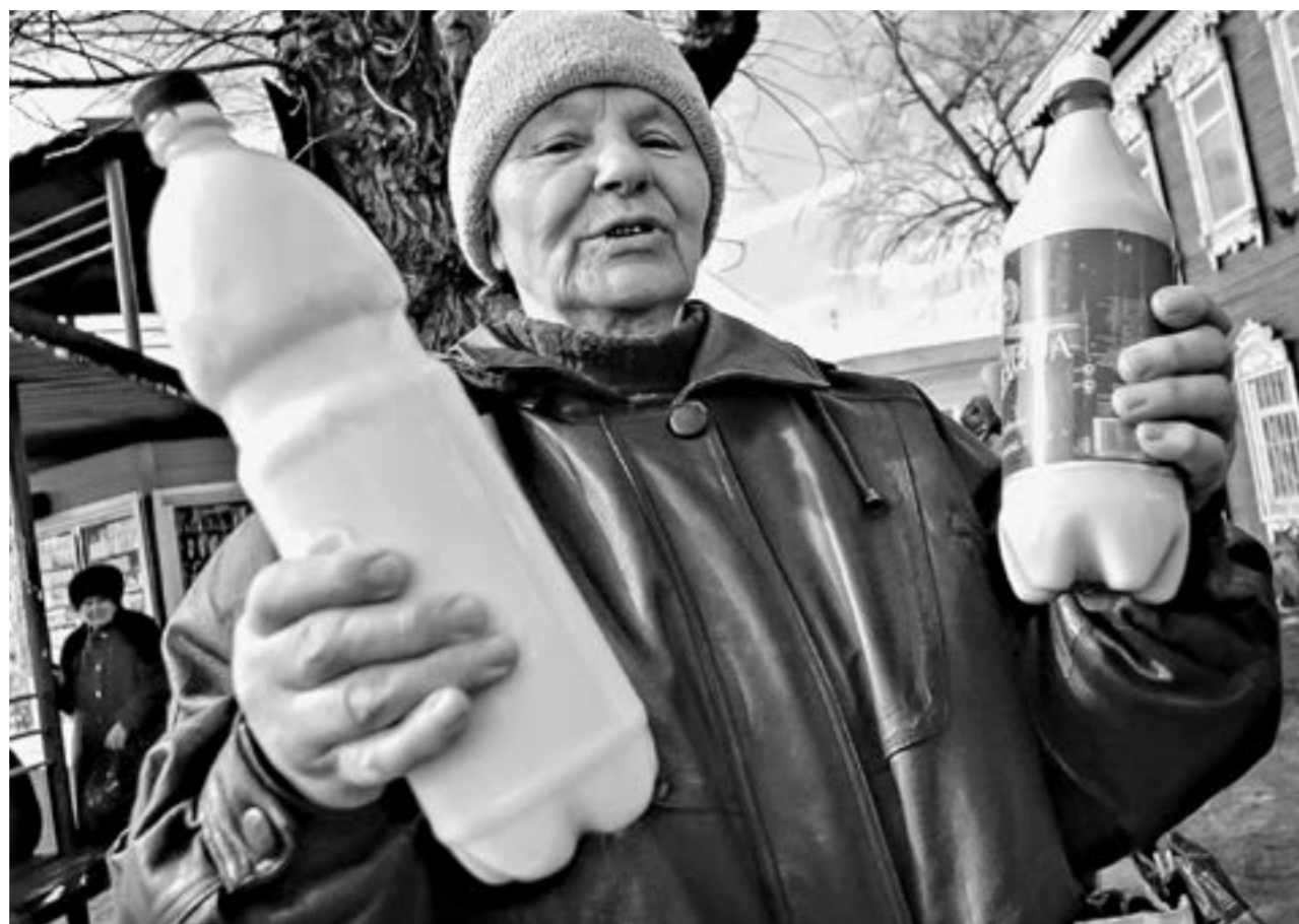
Новые правила ветеринарно-санитарной экспертизы вступают в силу в марте.