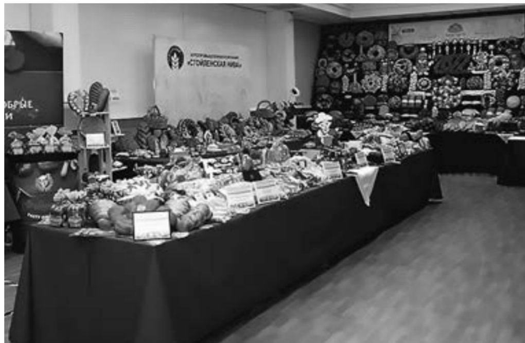
Во время конкурса специалисты обсудили качество современного хлеба.

В рецептуре же нового продукта – пророщенные гречка и овес, а еще морская капуста. Почему именно эти ингредиенты? Все просто. В состав традиционных хлебобулочных изделий входит, как правило, пшеничная мука, лишённая ценных частей зерна. Ученые вуза уже несколько лет занимаются разработкой улучшенного состава хлебцев. Одной