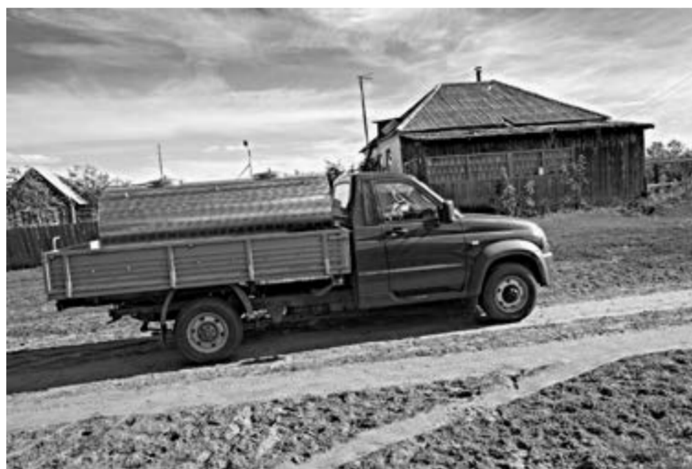
В Волчихинском районе – 10–15 сборщиков молока.