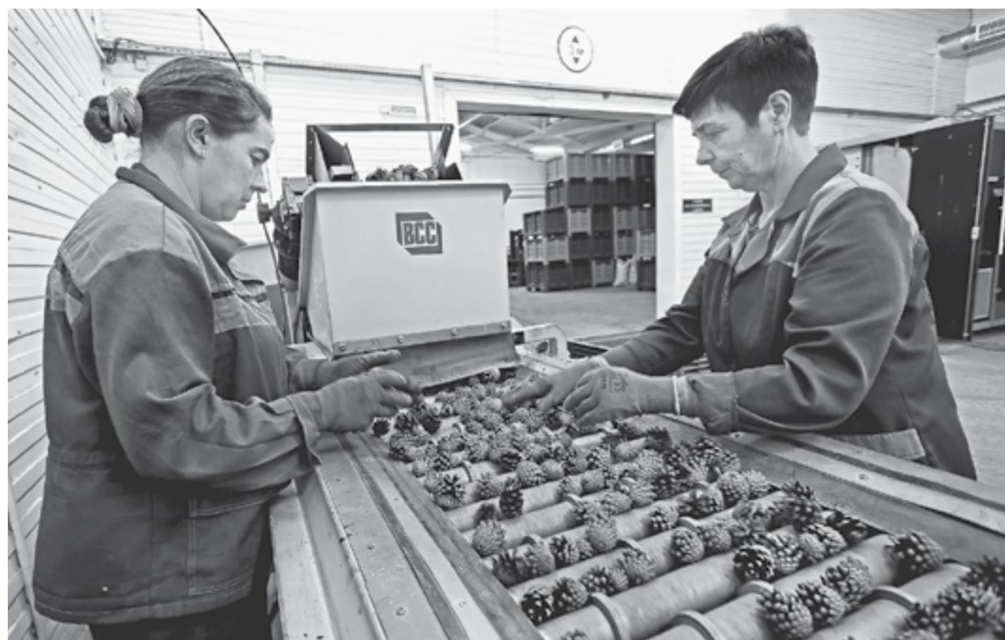
Процесс выборки нераскрывшихся шишек.