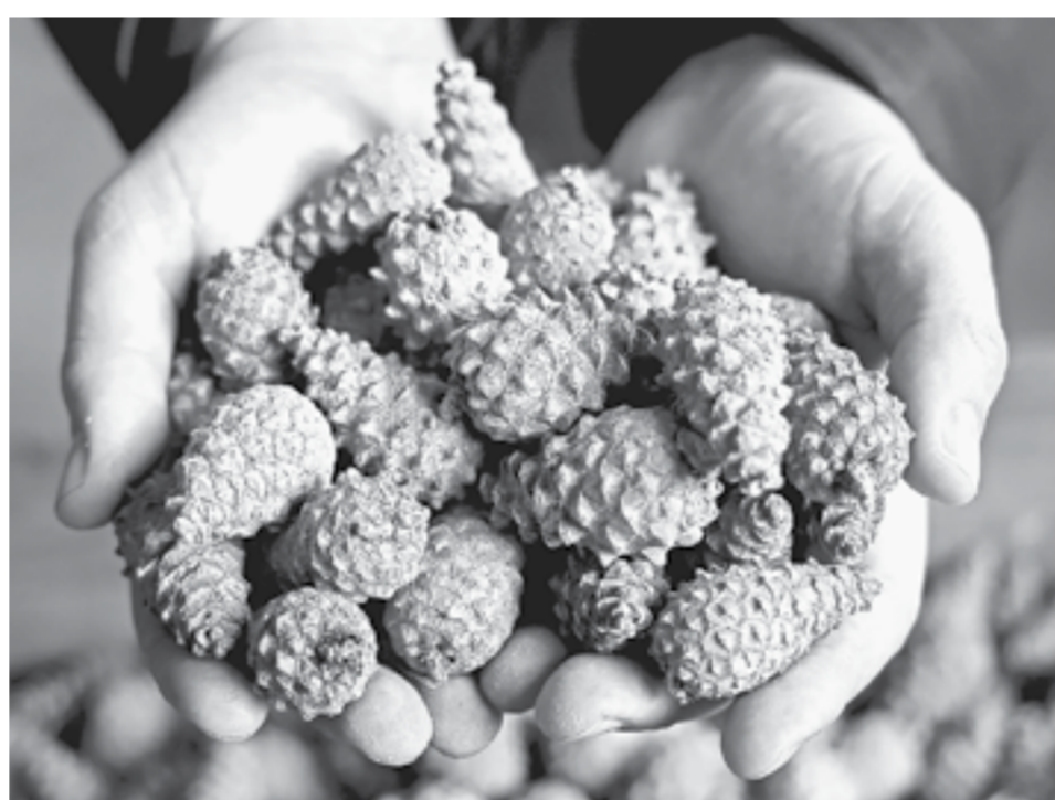
Пока что шишка, будут семена.