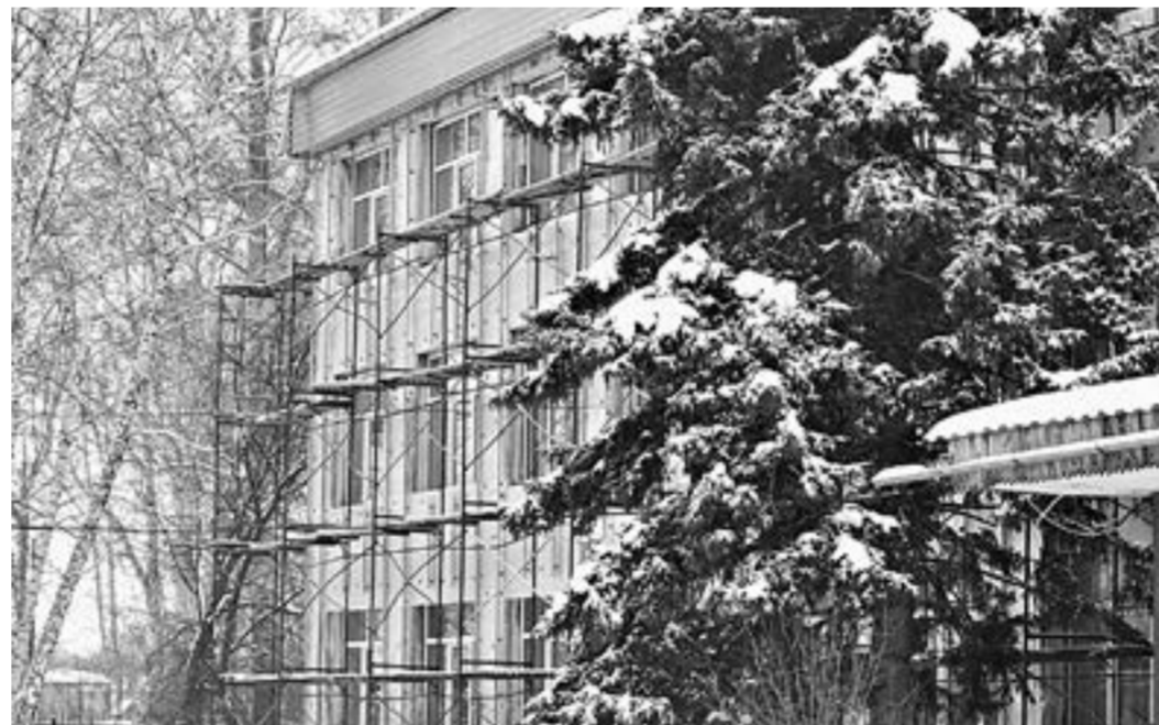
Теперь с Волчно-Бурлинской школы леса сняли.